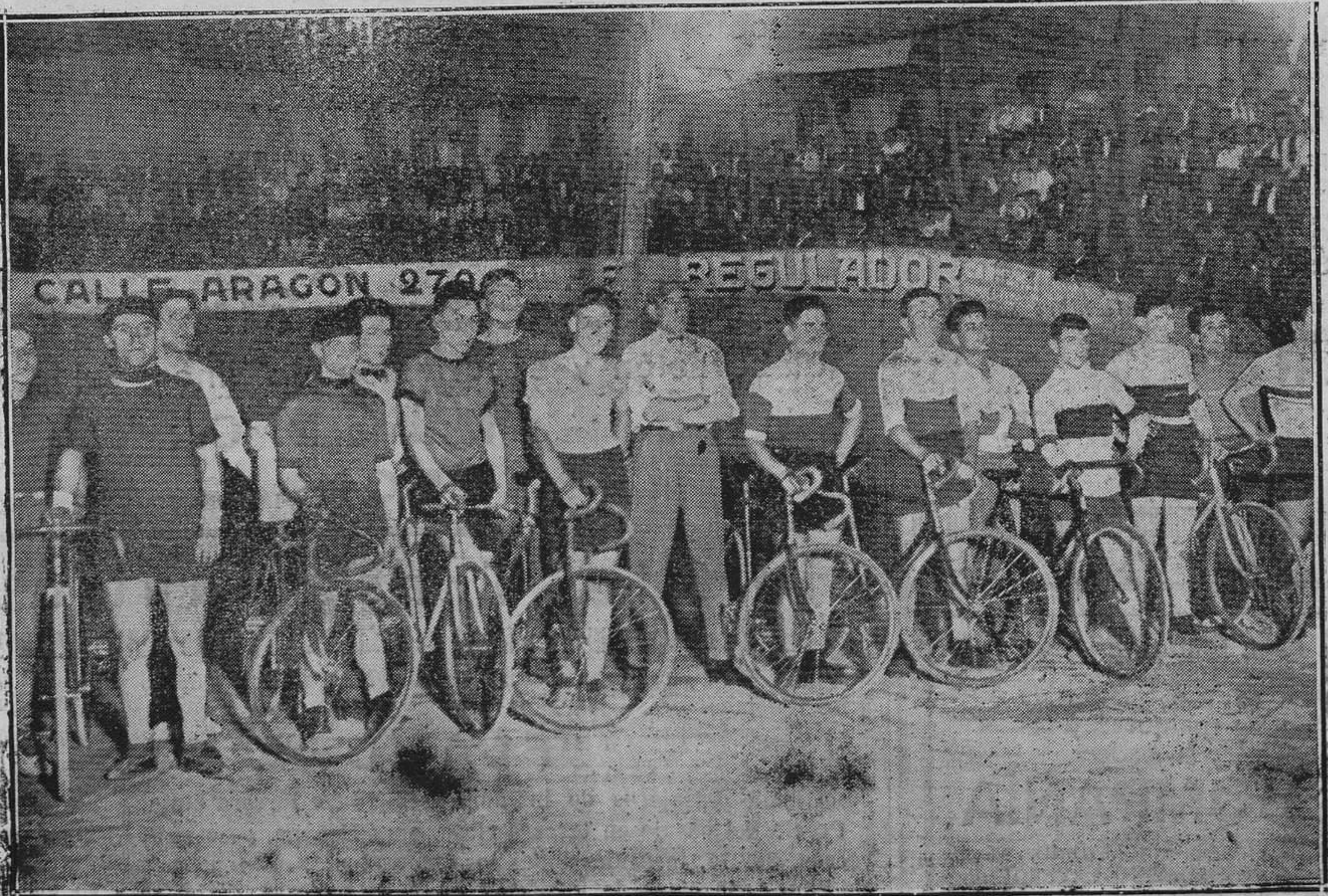
BARCELONA.--LA CARRERA DE 24 HORAS EN EL VELODROMO DE SANS: Los corredores momentos antes de salir.