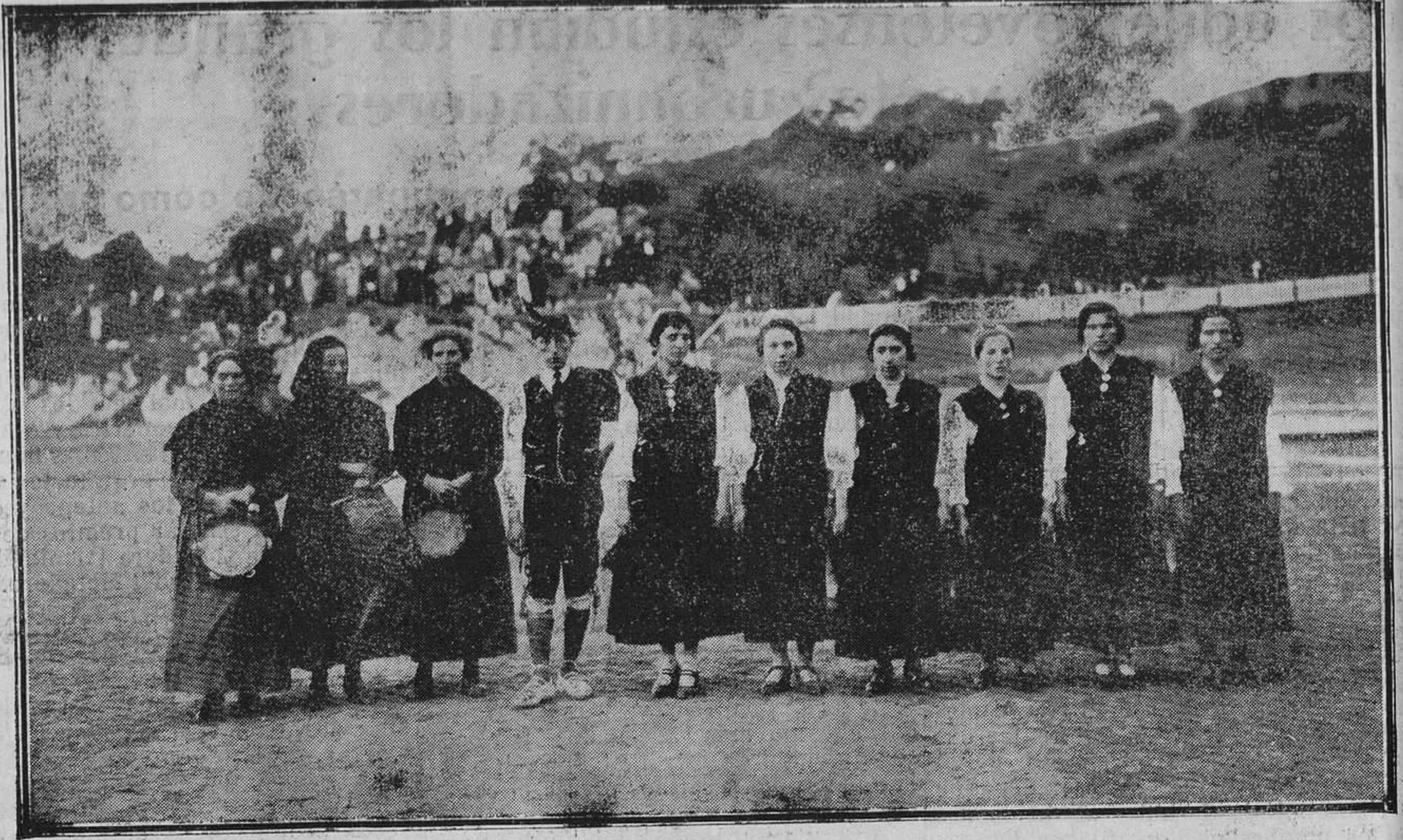
LLANES: DEL FESTIVAL ASTURIANO.--Los del "Corri-Corri", de Cabrales; cantadoras y bailarinas con "su hombre".

de los ordinarios y el importe de las contribuciones especiales para determinados servicios, y otro con recursos de crédito.