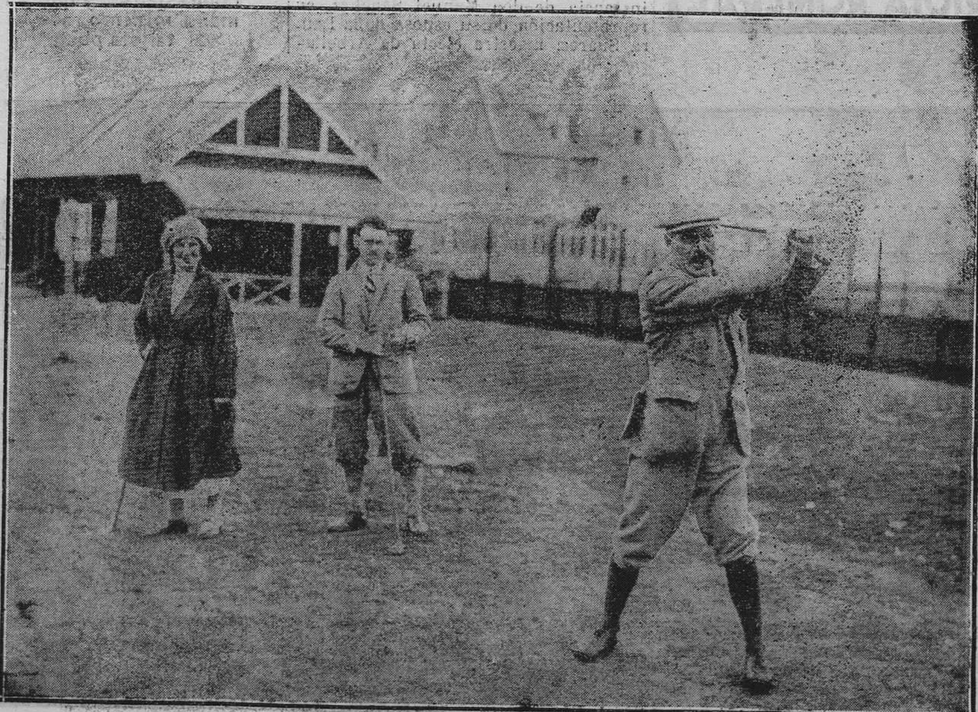
LONDRES.—El presidente del gobierno Mac-Donald jugando al golf en el campo de Spey Bay. Presencial el juego sus hijos Malcom e Ishbell.

No fiarse de corredores que digan en las estaciones que no hay habitaciones.