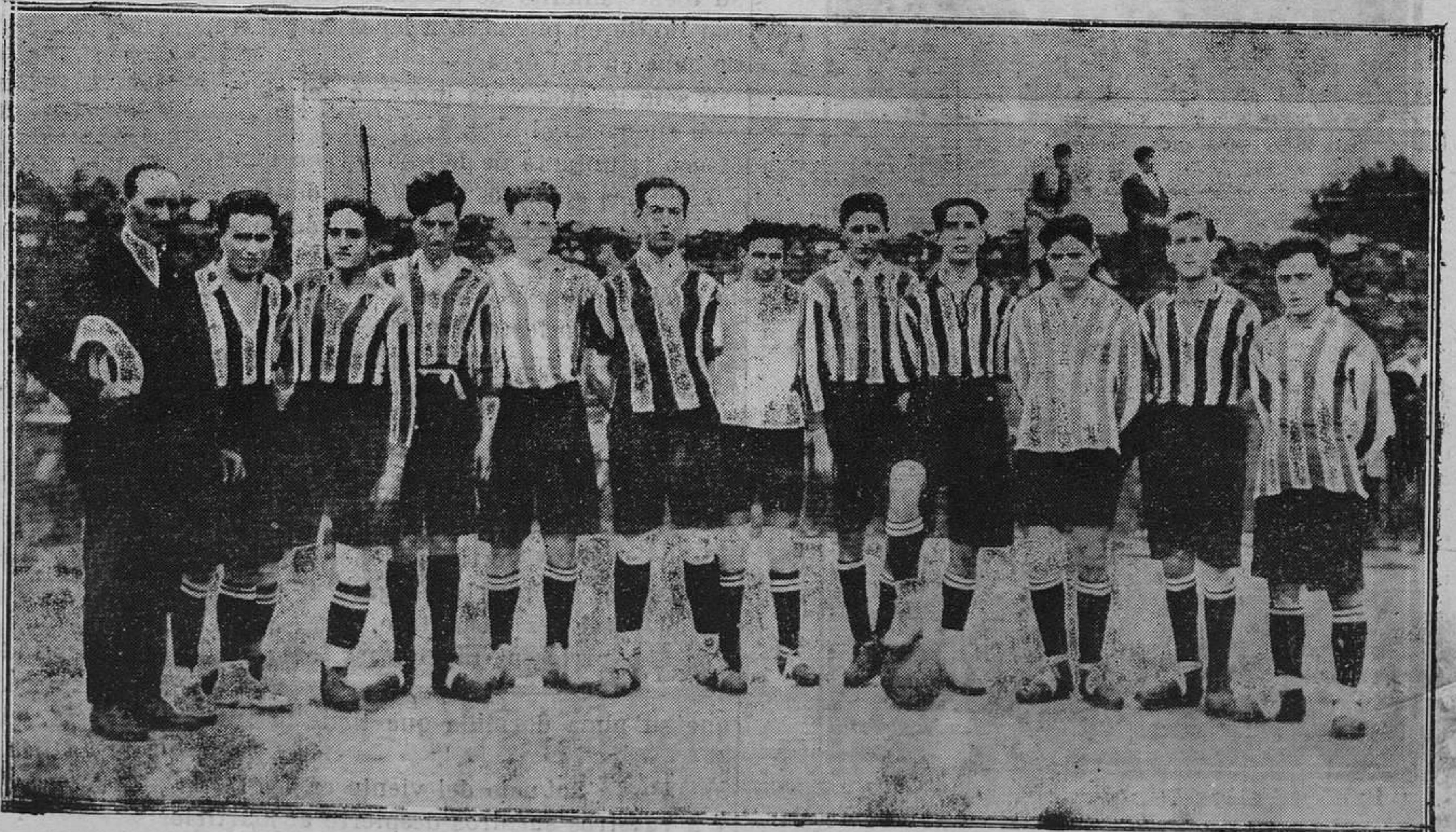
El equipo de fútbol Astur Club Vegadense, campeón de Occidente.

El mismo día el Club Ciclista Gijonés organiza una caravana ciclista a Villaviciosa, para ver la carrera y pasar el día con sus nuevos compañeros del naciente Club Ciclista Villaviciense.