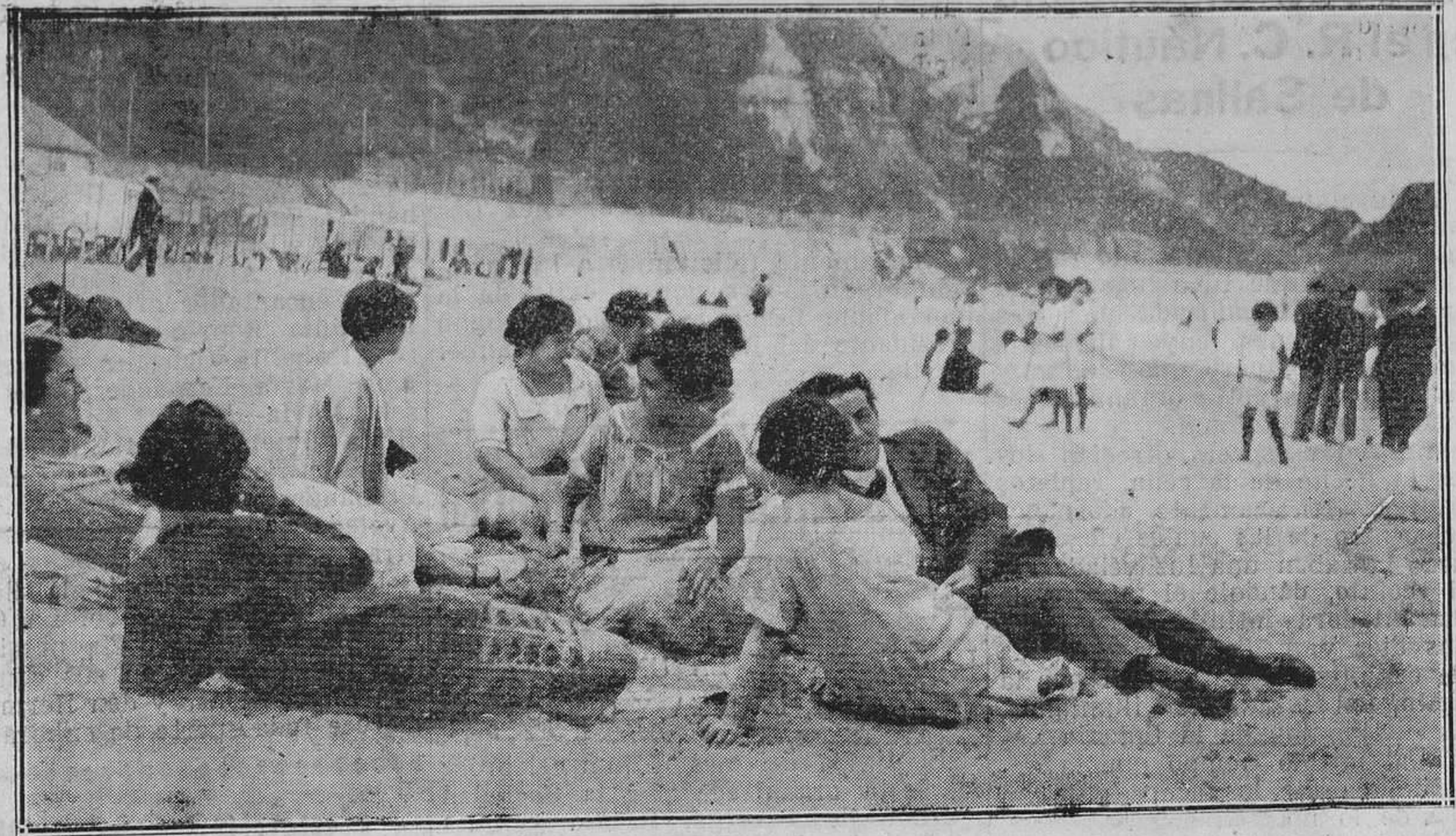
EL VERANEO EN ASTURIAS.--Un grupo interesante en la playa de Salinas.