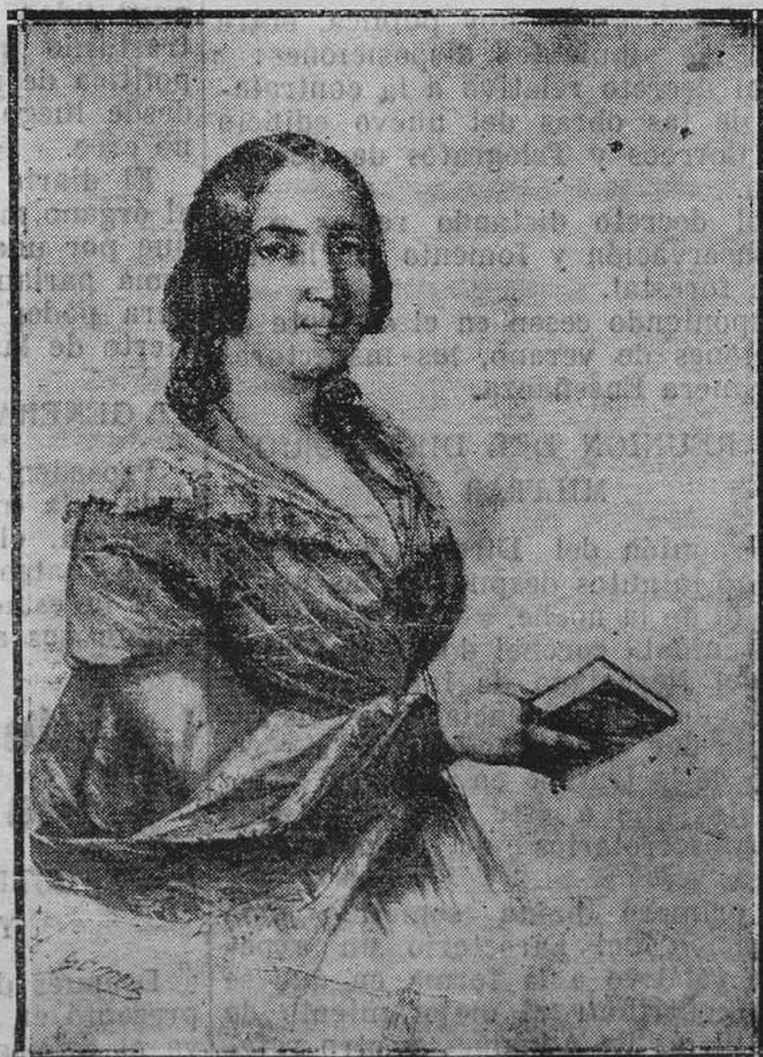
ESCRITORAS DISTINGUIDAS.—La celebrada poetisa Gertrudis Gómez de Avellaneda, gloria de Cuba, su patria, y de la lírica española.

Para anuncios en esta página, pueden dirigirse, hasta las siete de la tarde, al apartado nú mero 42