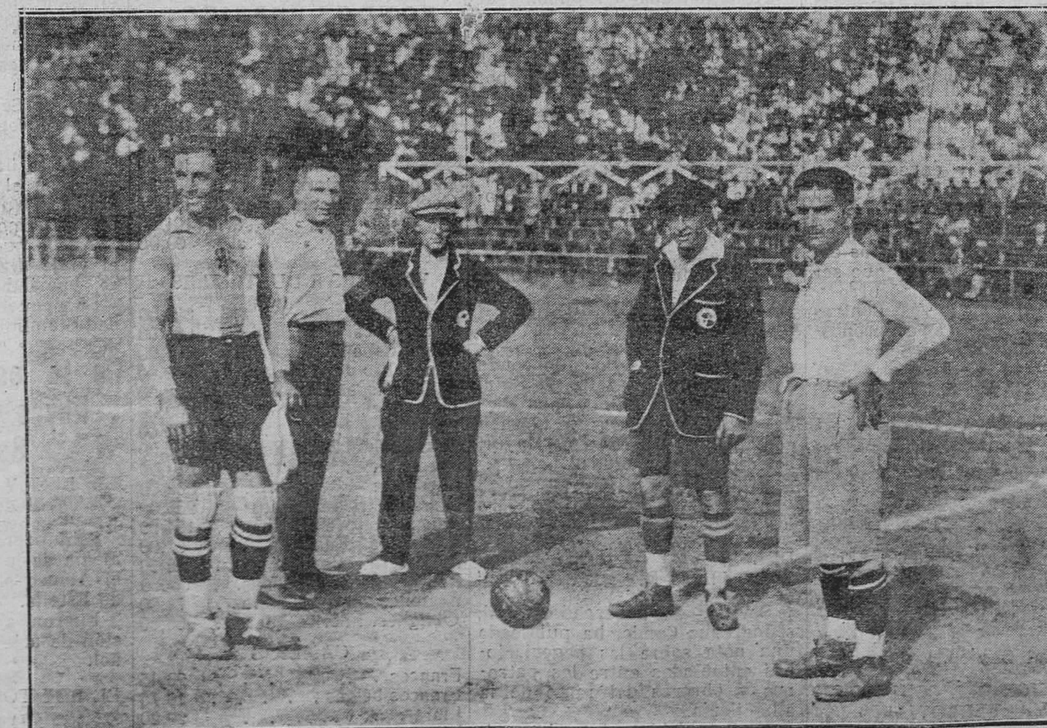
AVILES.—Del partido del martes.—El árbitro y los capitales, momentos antes del partido.