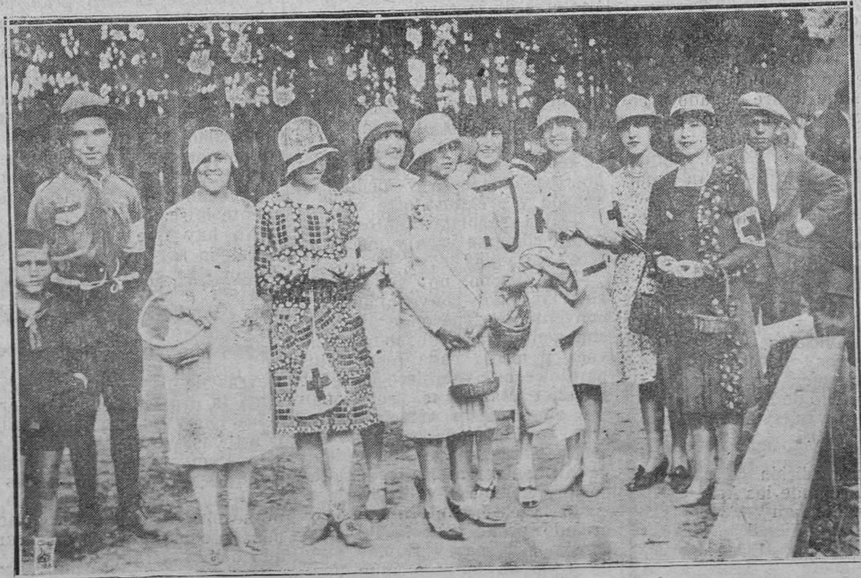
AVILES.-Grupo de bellísimas postulantes en las fiestas de San Agustín