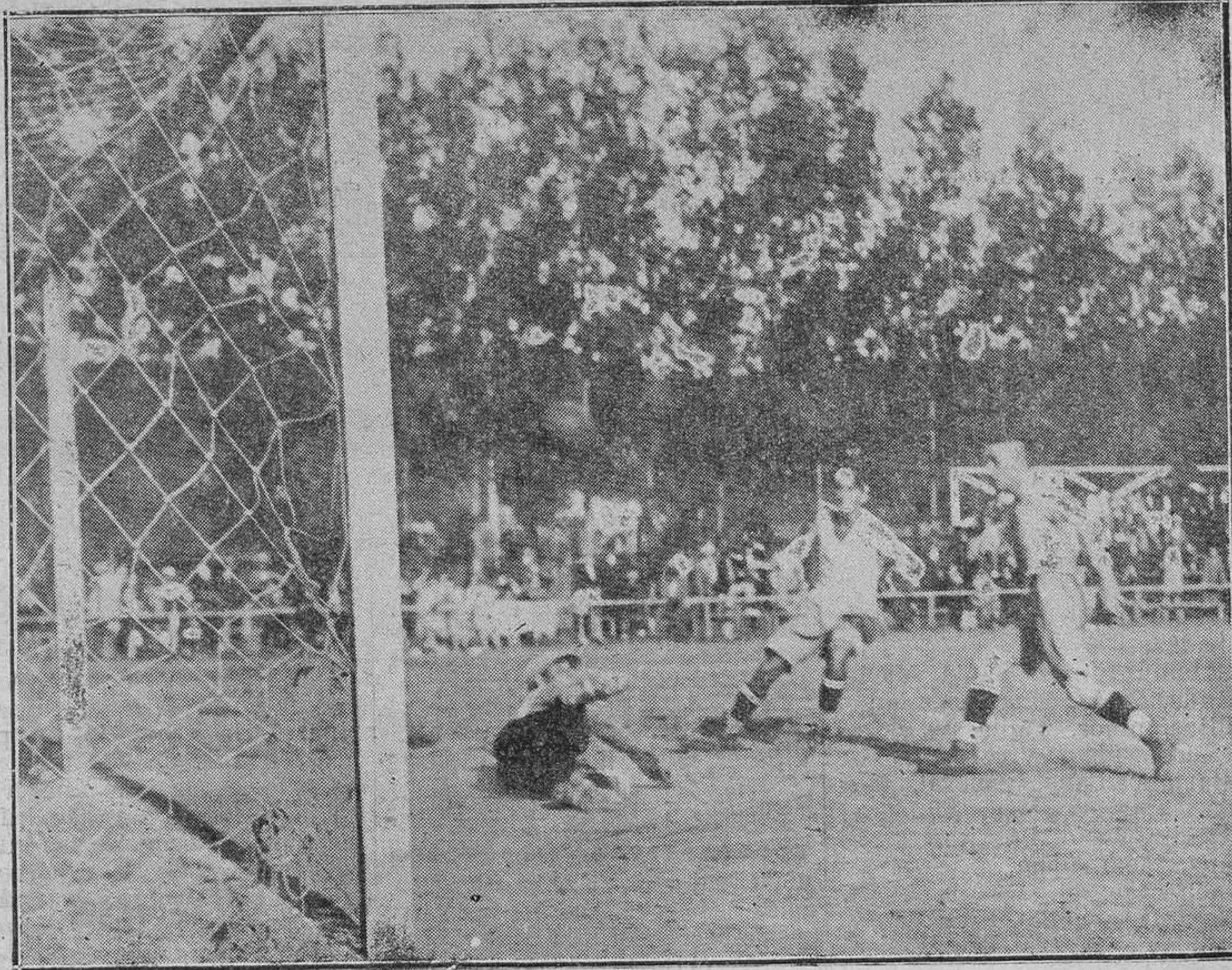
AVILES.-Del partido del martes. La portería ovetense atacada por los contrarios

"Con satisfacción recibo el telegrama de V. E. revelador de cuánto agradecimiento a la provincia merece la acertada gestión del gobernador señor Caballero que Gobierno comparte y corresponde agradeciendo el saludo que se le dirige haciendo fervientes votos por la prosperidad de esa gloriosa tierra cuna de la independencia española. Le saluda."