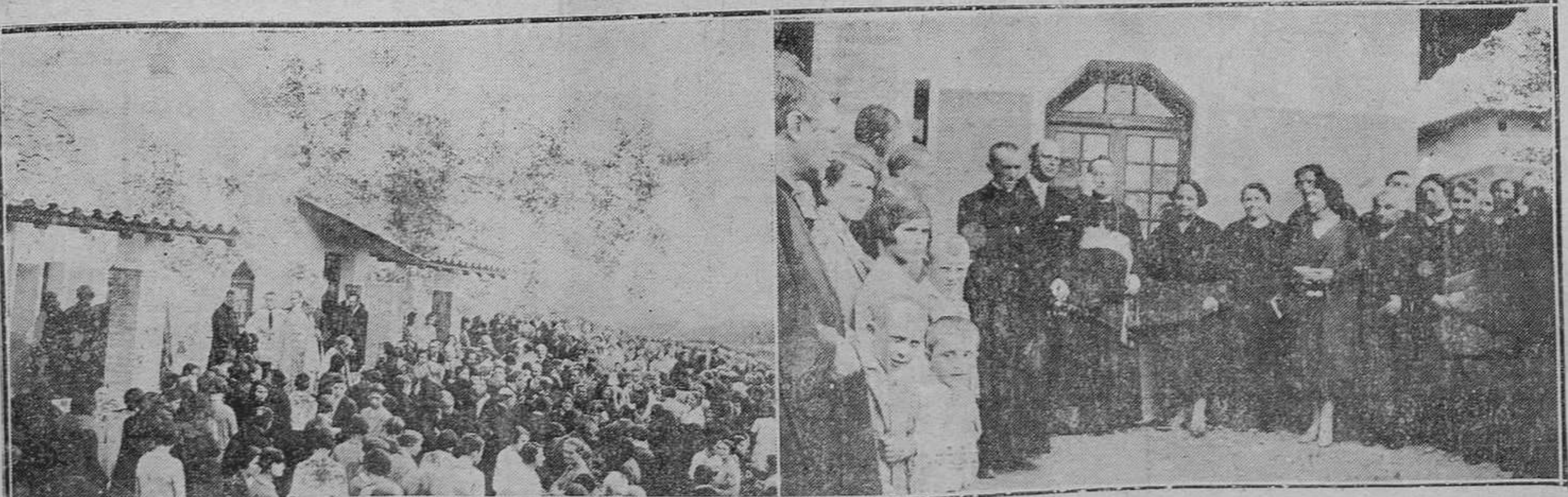
COLUNGA.-Un aspecto de la inauguración de los Asilos de Colunga, al ser bendecidos éstos por el Sr. Obispo.-Las damas de la Unión Social de Colunga, con el Sr. Obispo, el Alcalde y el Párroco, después de la inauguración de los Asilos.