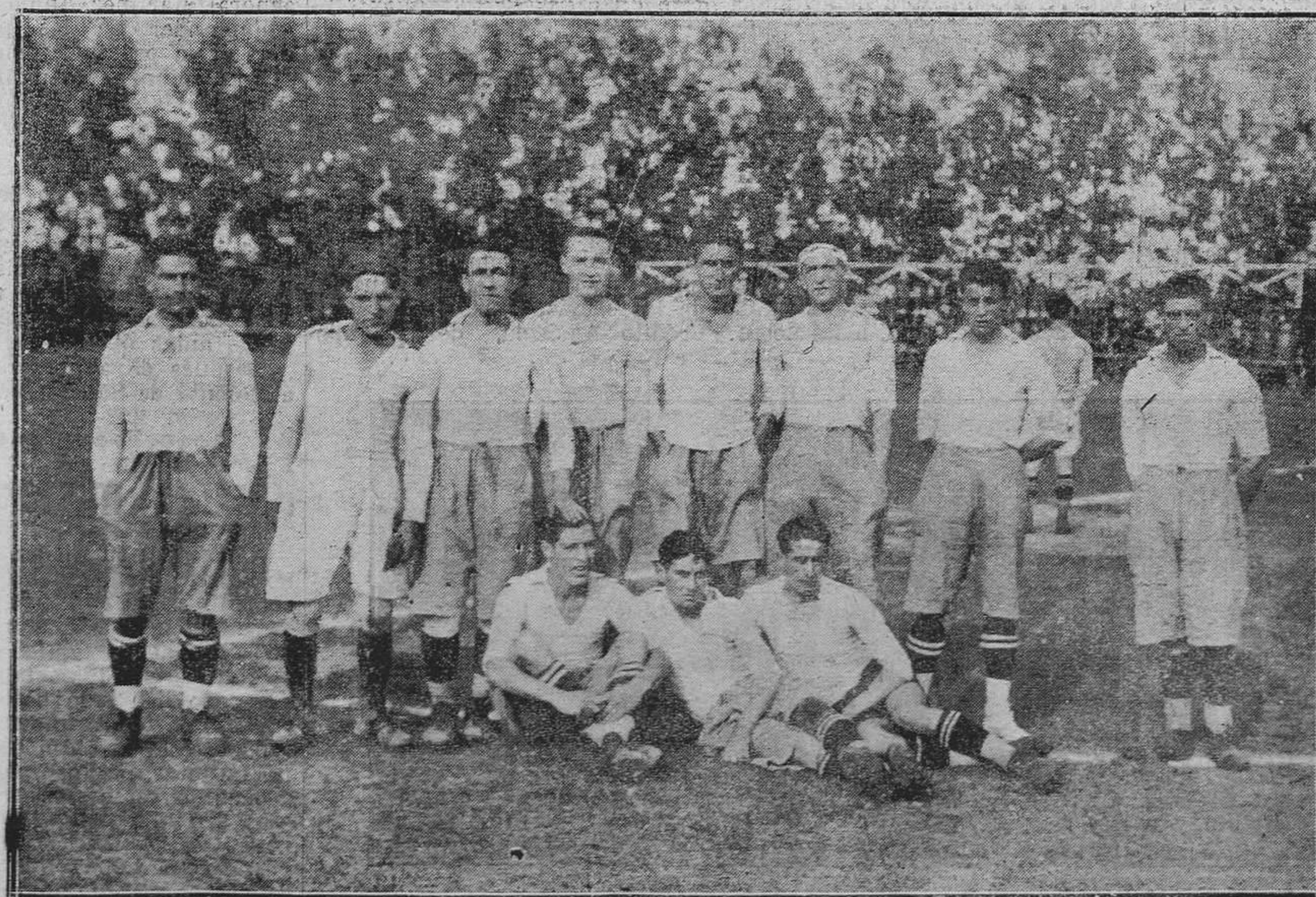
AVILES.—Del partido del martes.—El Real Stadium Avilésino, que venció al Real Oviedo por 5 - 4.

Del balcón entreabierto de una casa sale un ráfaga de luz que acuchilla a la noche. Se oye el teclear de