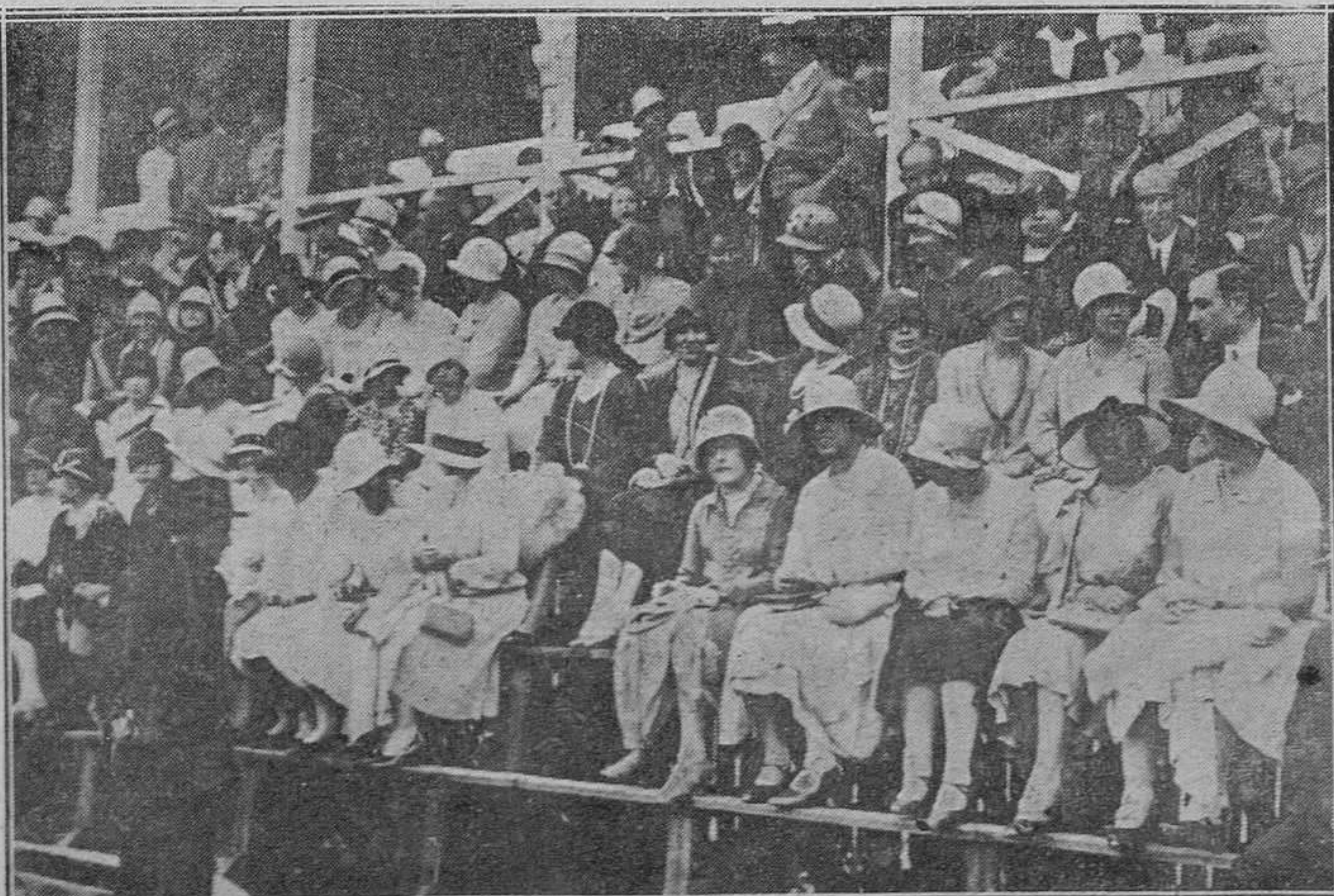
AVILES.-Del partido del martes. Un aspecto de lindas espectadoras

Curación rápida y sin dolor de toda clase de erupciones, úlceras, varices, hemorroides, orquitis y tumores de piel. Horas de once a una.