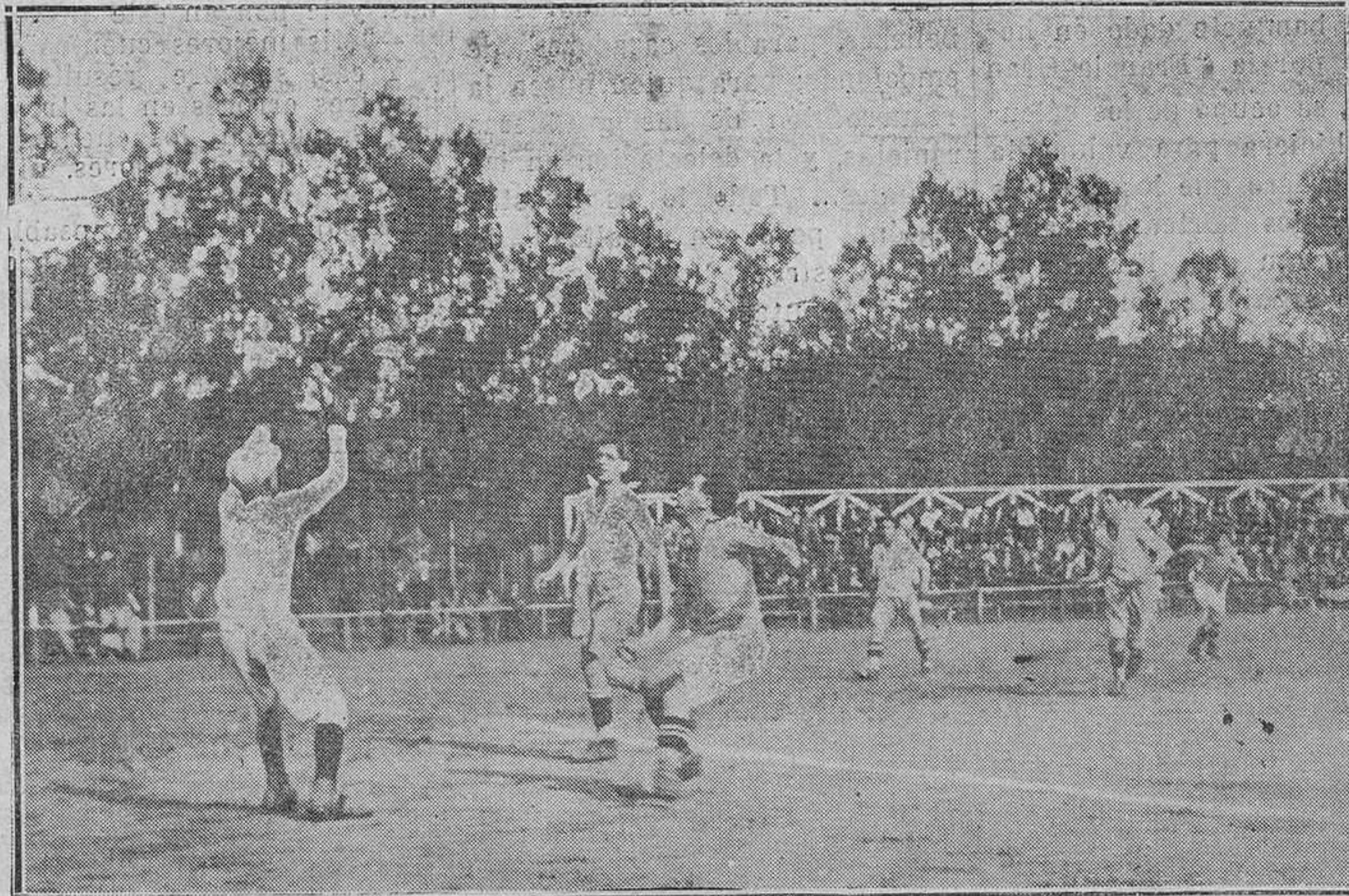
AVILES.-Un momento de peligro para los aviesinos en el partido del mar

Uno de estos obreros aún agregó: Yo que me apunté el jueves y hago el número 17, aún no entré a trabajar y otros no hacen más que llegar e inmediatamente se les envía a reconocimiento.