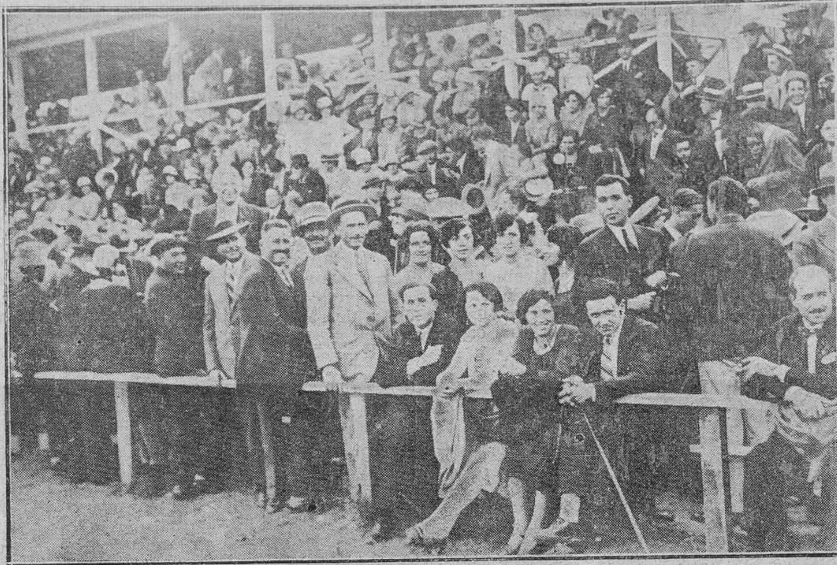
AVILES.-Un grupo de asistentes al partido del martes en el campo de las Arobias

Se acentuó ayer el mal tiempo, soplando vientos del Noroeste Cantábrica. Poniente en el señalando el barómetro 765 milímetros.