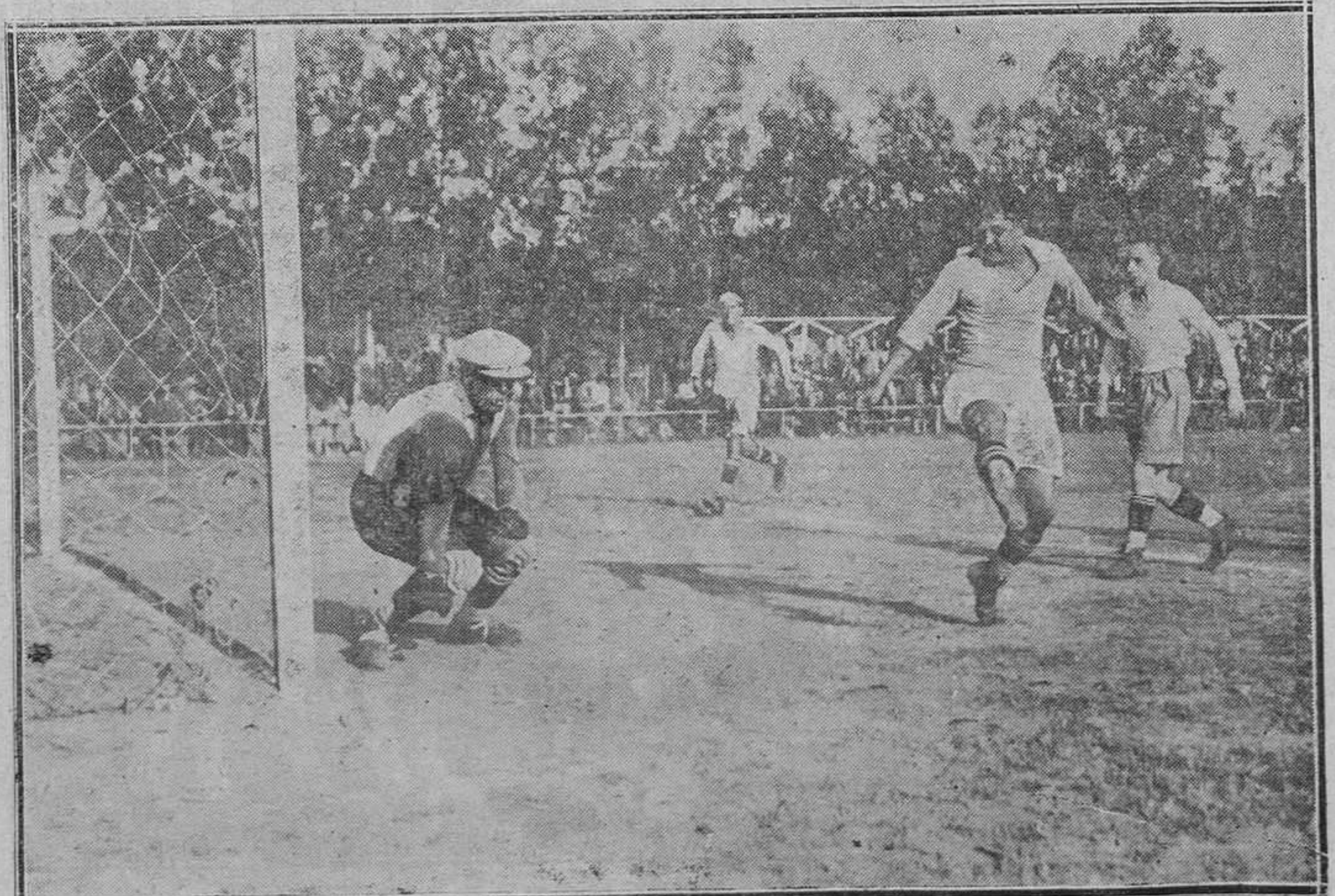
AVILES.-Uno de los tantos en el partido del martes