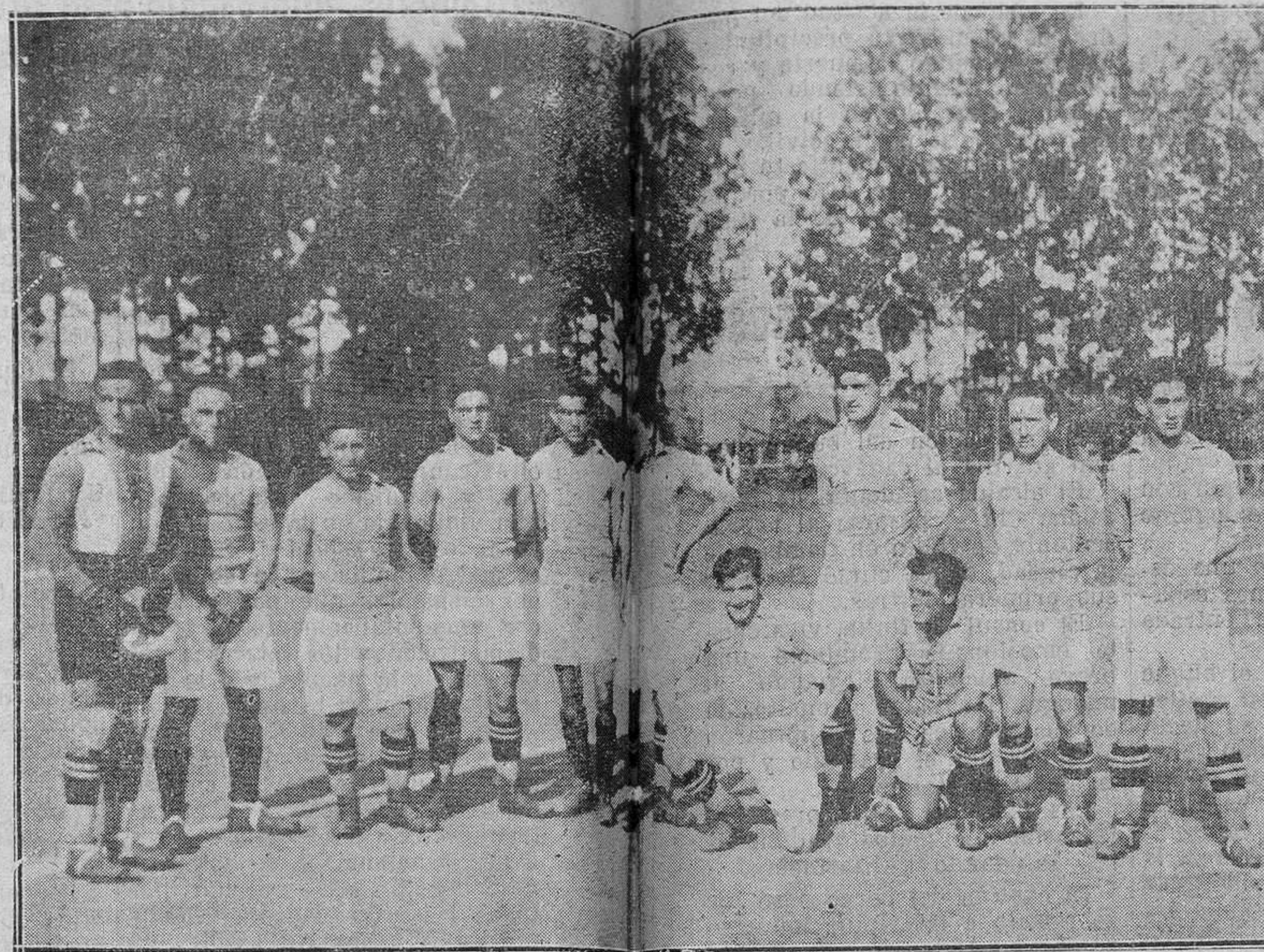
AVILES.—El Real Oviedo que fué vencido el martes último en el campo de las Arceñas.