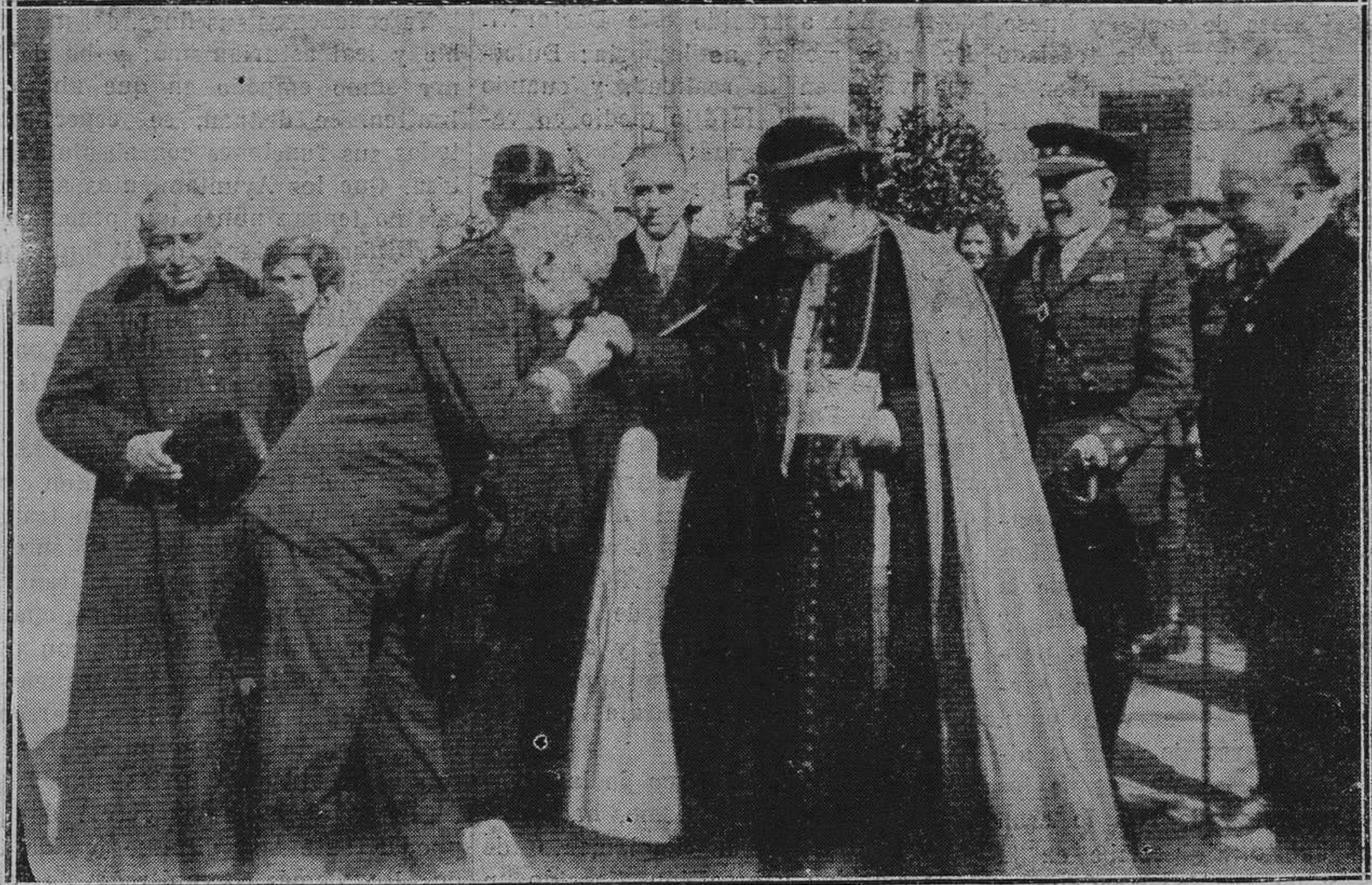
GIJÓN: EN EL HOSPITAL DE CARIDAD.-El comandante de Marina besando el a nullo pastoral.

beralidad y amor a la cultura, ofrece subvencionar a dos de los maestros expedicionarios y se propone, por tanto, que se destinen 100 pesetas para atender a los gastos de cada uno de los ocho restantes.