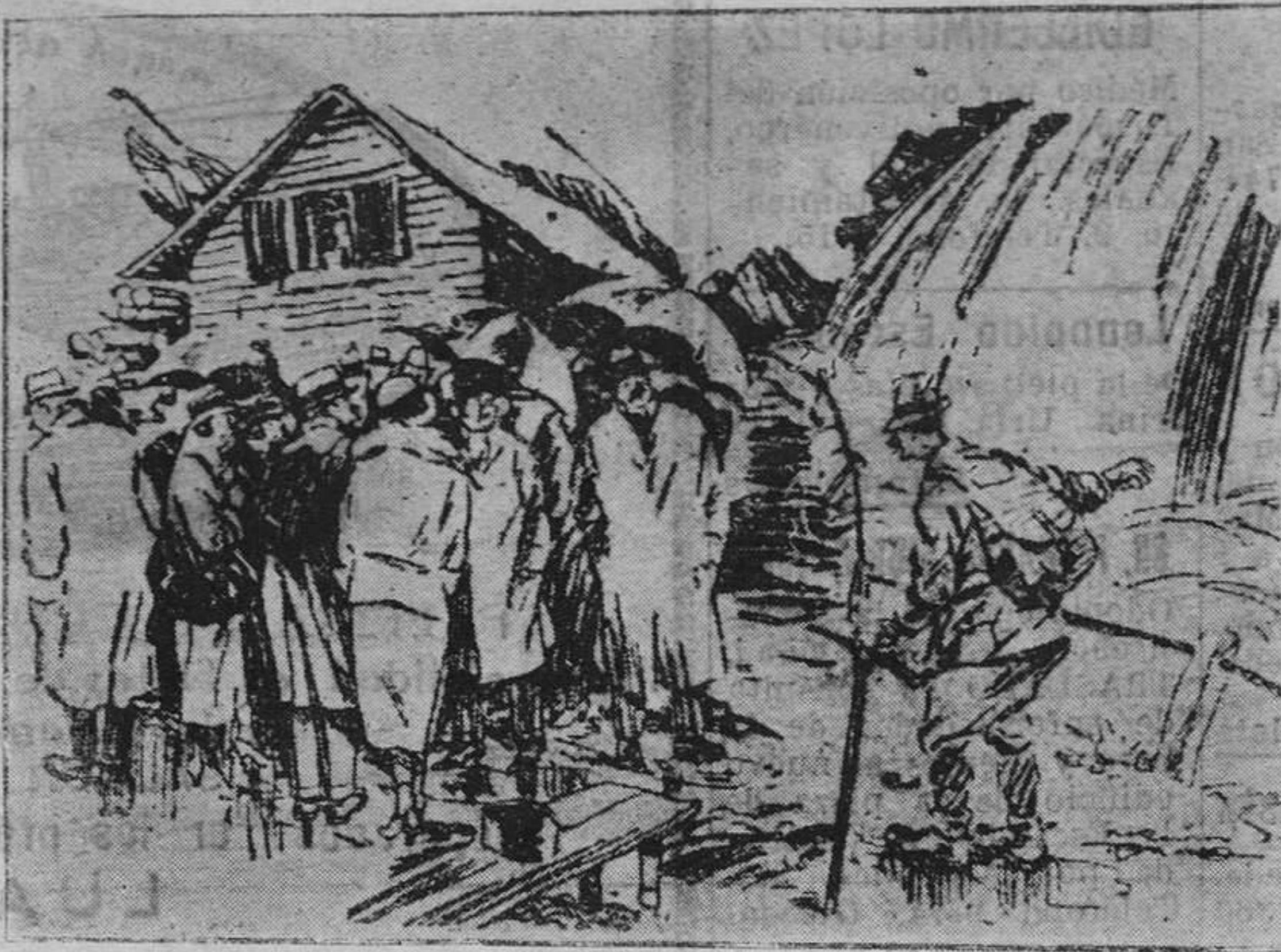
El guía.—Esta es la gran cascada de los Alpes. Si esas señoras quisieran callarse un poquito, se oiría el rumor del agua.