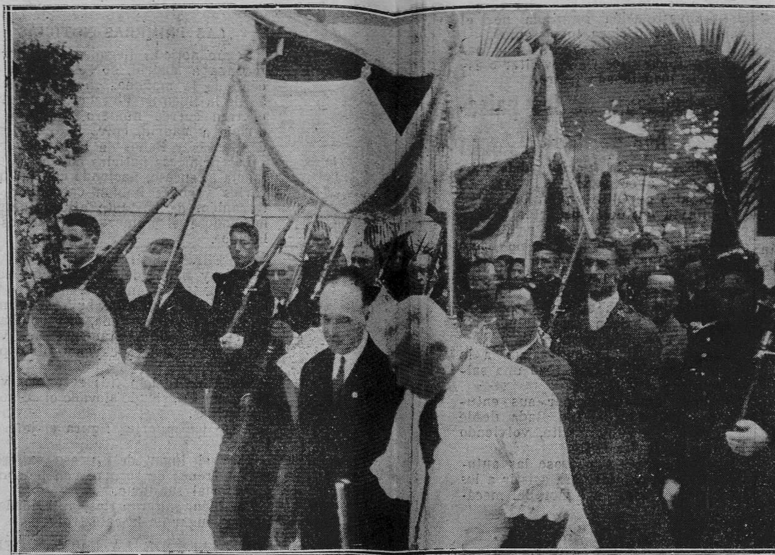
SIJON.-La procesión del Santísimo en el Hospital.