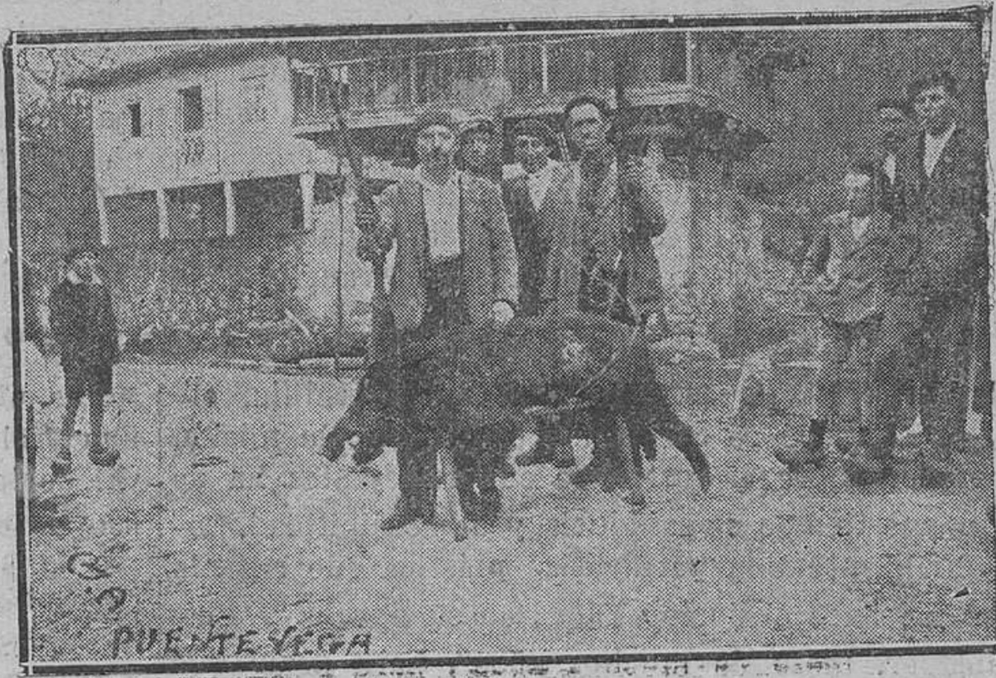
Una gran ballena de jabalí, de 8 arrobas de peso, cazado en los montes de Arango (Pravia)

En una herrería del pueblo de Torlá, una caballería, a la que estaban herrando, de una