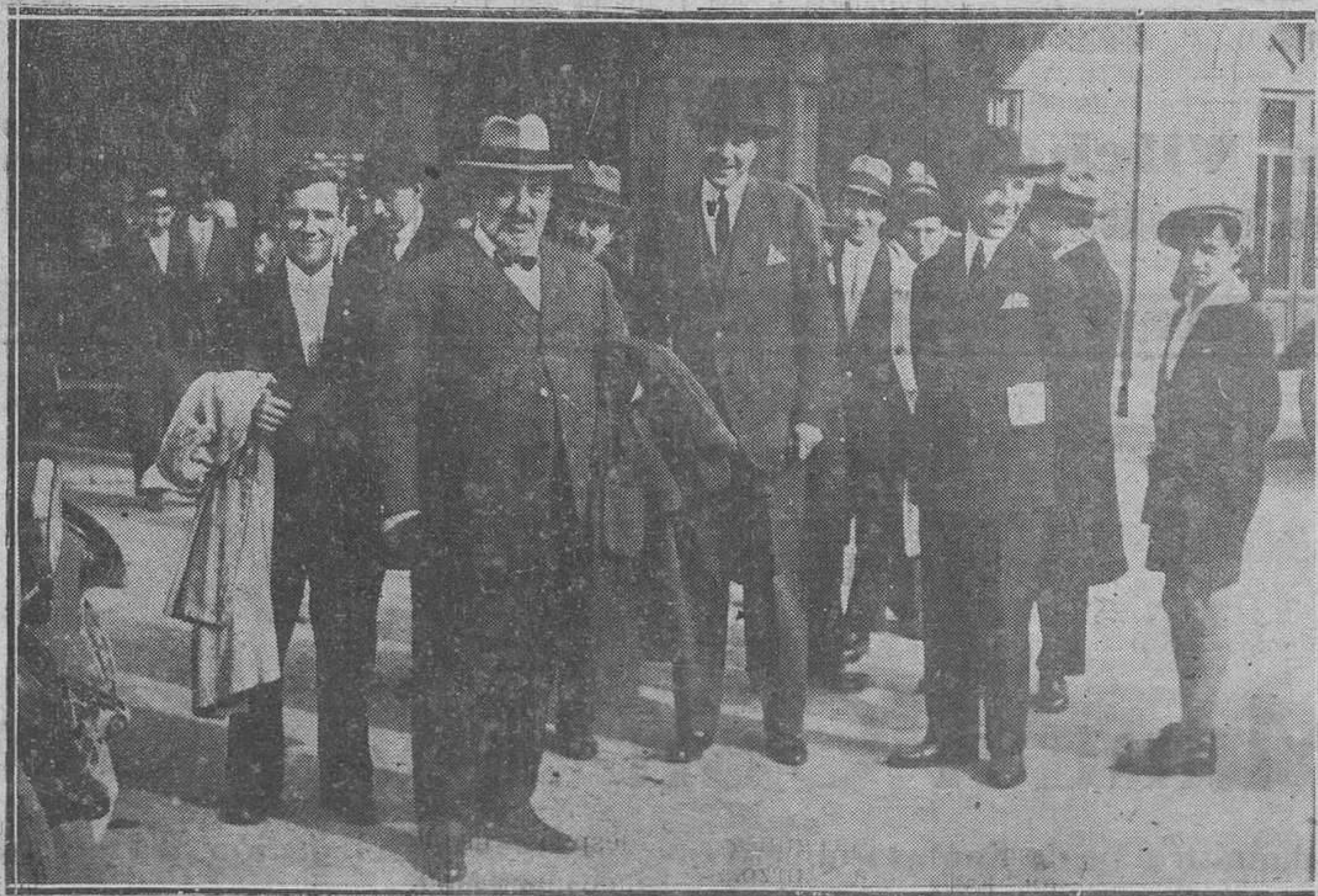
OVIEDO.-El ilustre abogado madrileño don Angel Ossorio y Gallardo, momentos después de su llegada a la capital donde fué invitado por los estudiantes católicos, para dar una conferencia en el Paraninfo de la Universidad

Don Manuel Prada, que desea dar bailes públicos en Olloniego.