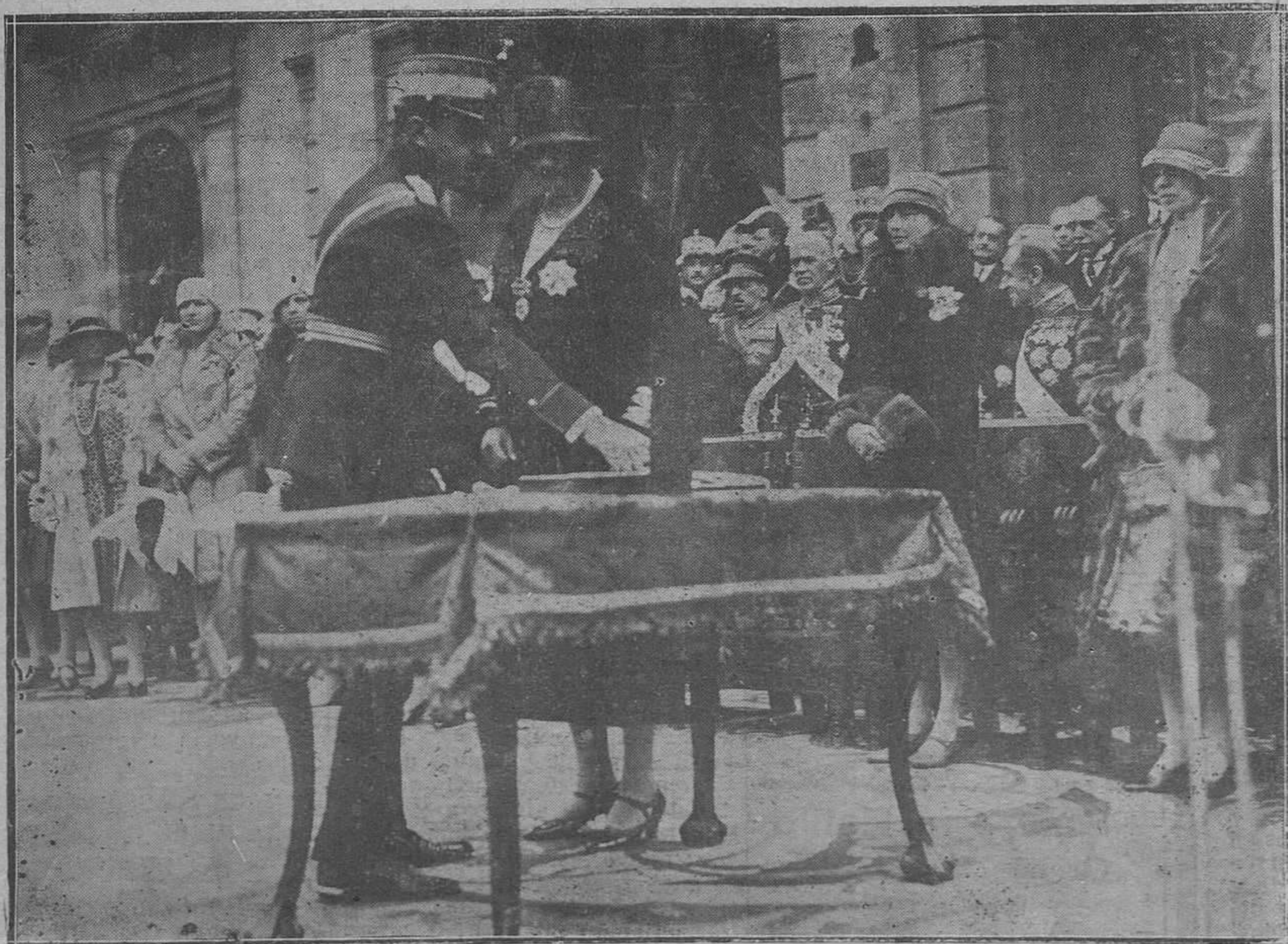
SEVILLA.—Imposición de la gran cruz del Mérito Militar a S. A. la Infanta doña Luísa. S. M. el Rey don Alfonso en el acto de condecorar a S. A. la Infanta

Hace mención de la "Exposición de médicos-artistas" en la que sobresalían obras de verdadero mérito. El temor a omitir bastantes nombres le obliga a