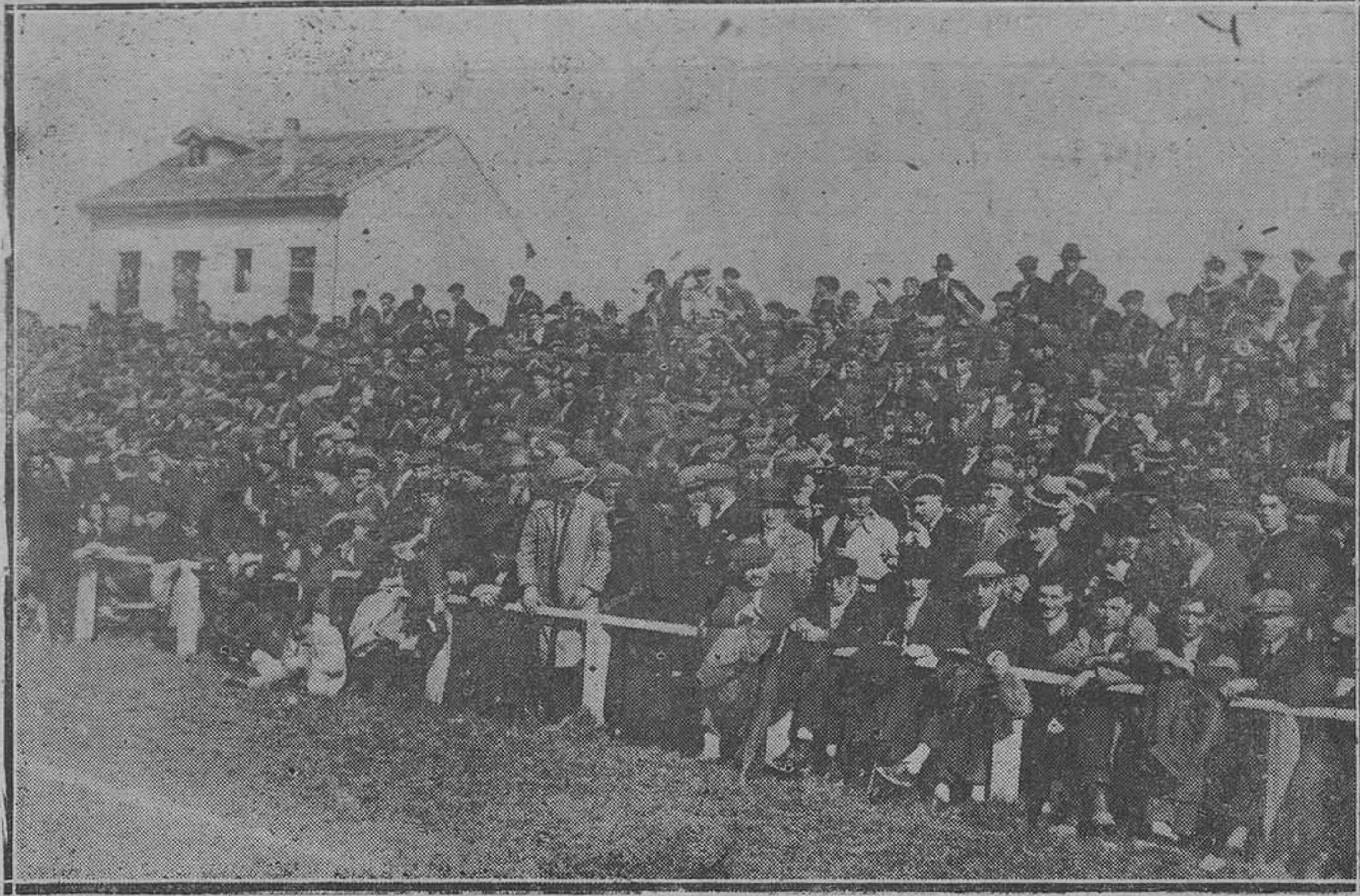
OVIEDO.—El partido Barcelona Oviedo. Un aspecto de la general.

Laviana. — Condenando a Benjamín Ruano Blanco, por el delito de tenencia ilícita de arma de fuego, a la pena de un mes y un día de arresto mayor y al pago de cien pesetas de multa.