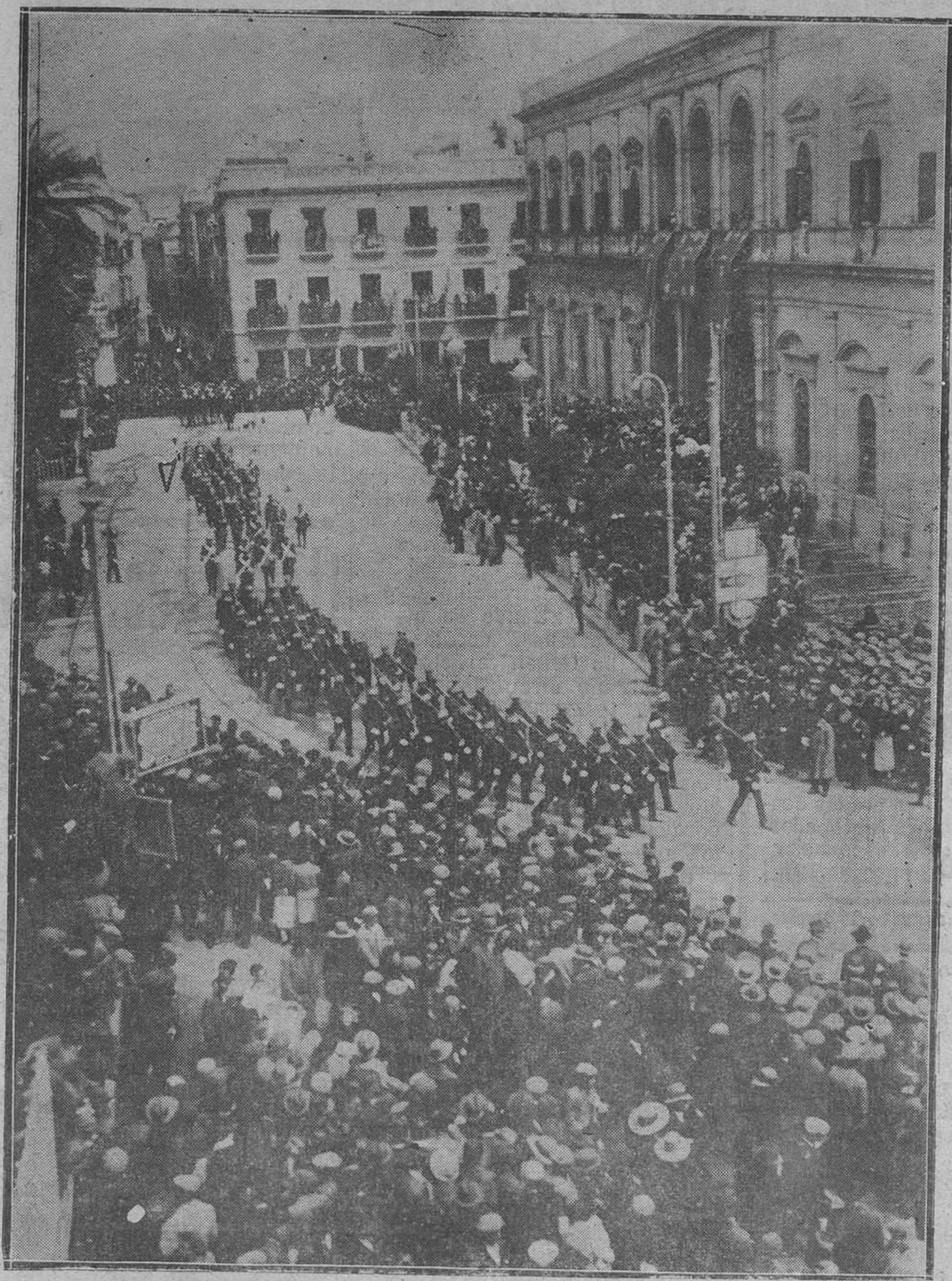
SEVILLA.-Las tropas, desfilando ante los Reyes e Infantes, después de la gran Cruz del mérito militar a la Infanta Luisa (Vidal)

Un poco de trabajo, repetido trescientas sesenta y cinco ve- ces, rinde trescientas sesenta y cinco veces un poco de dinero. Al mismo tiempo, se ha labra- do la gloria.