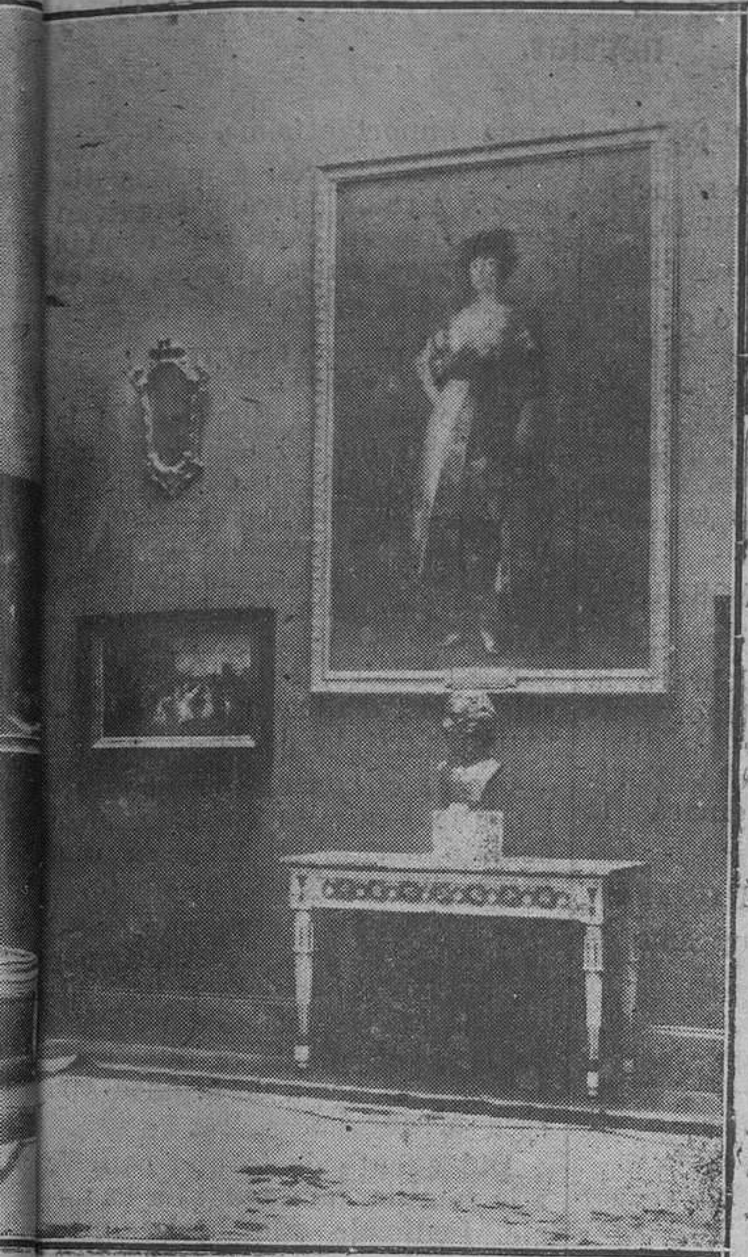
Exposición en la Academia de San Fernando