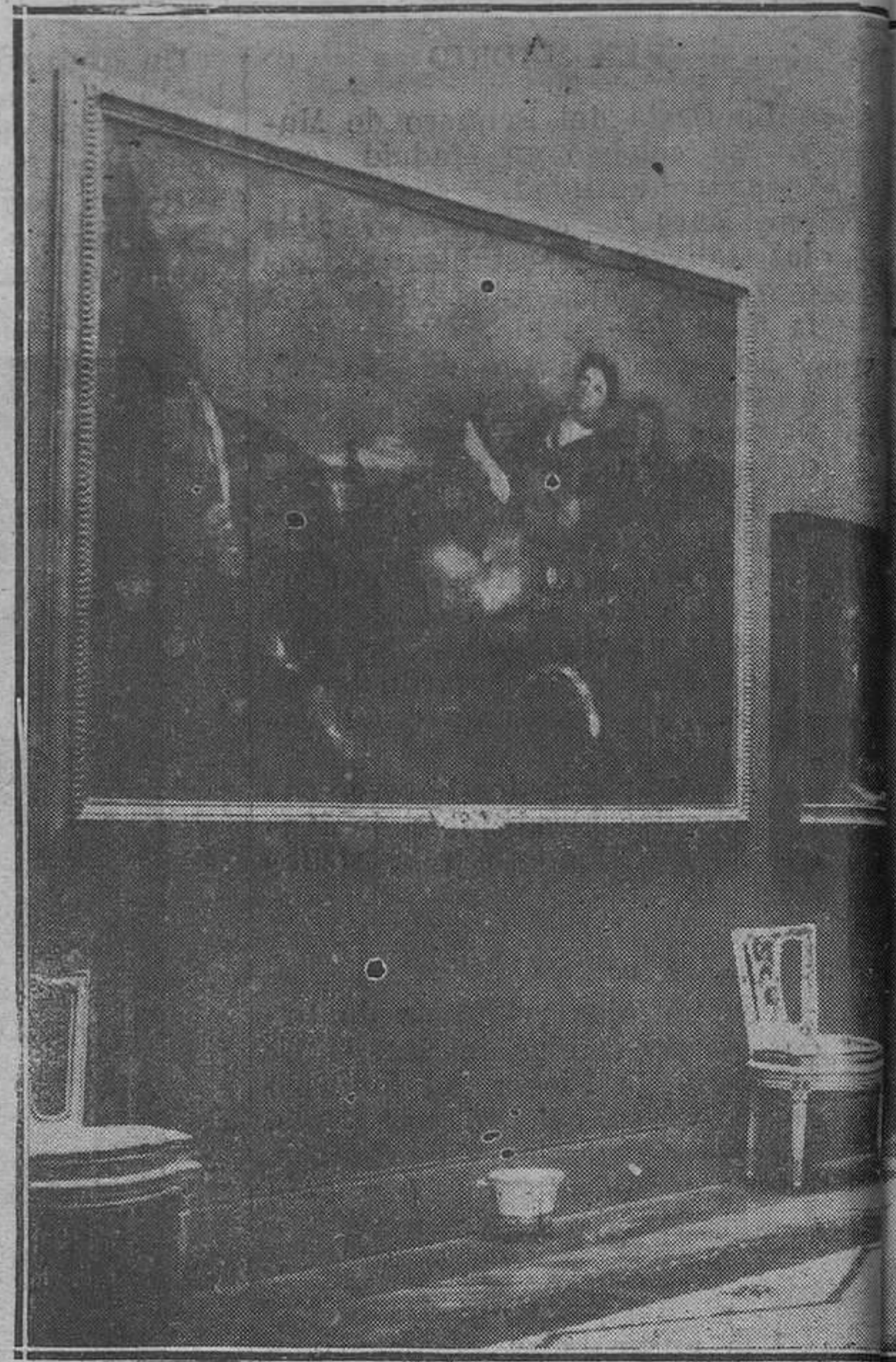
DE UN CENTENARIO.—Un aspecto de la nueva Expi,