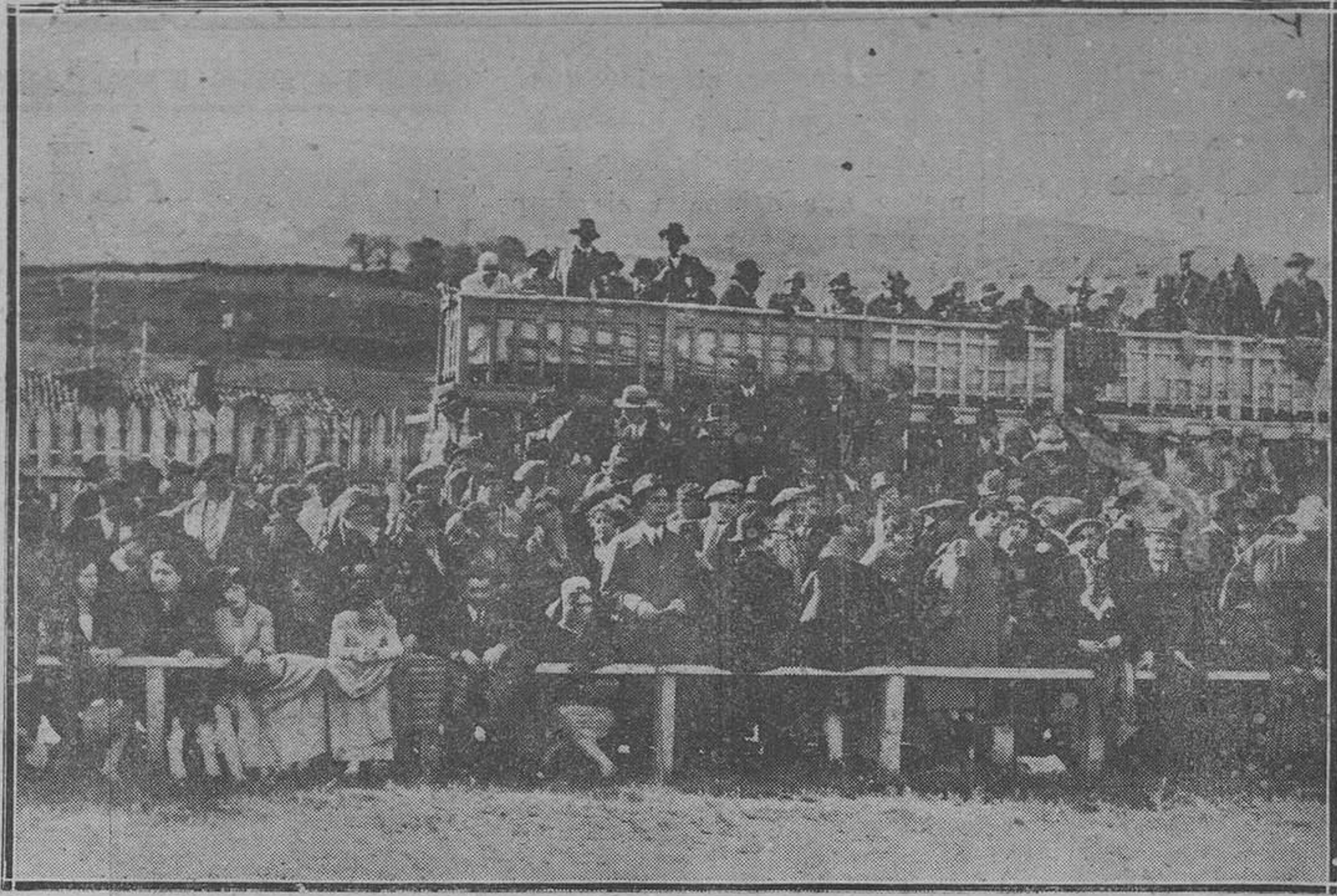
OVIEDO.-El partido Barcelona-Oviedo. Un aspecto de la tribuna de preferencia.

El partido popular presentóse a las elecciones de 1919 y en ellas obtuvo 99 puestos, casi la quinta parte de los del Congreso.