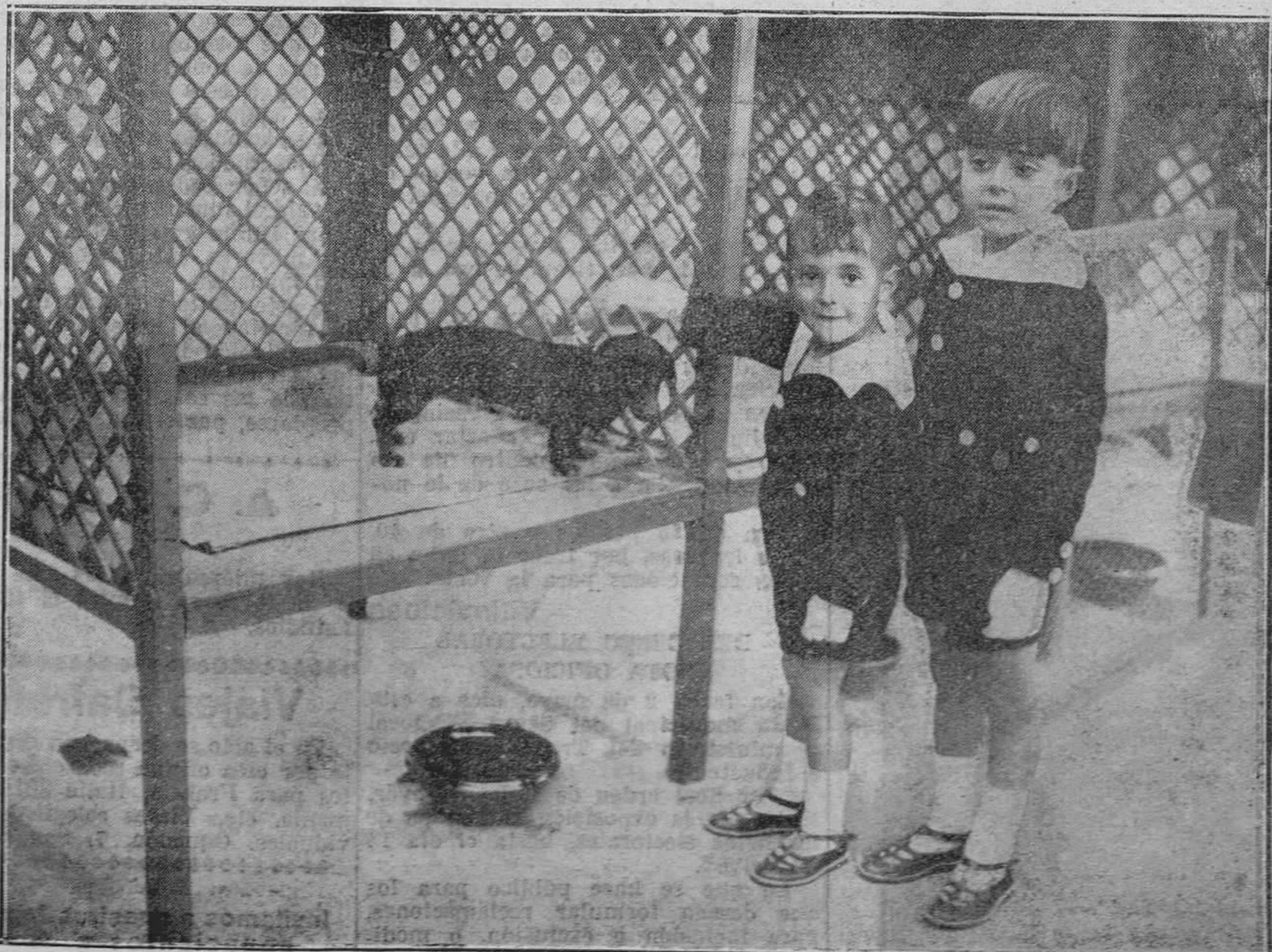
MADRID.--Niños con su perrito, que han presentado en la Exposición Internacional canina.

Duró el baile, hasta bien entrada la noche, sin que, durante el tiempo que duraron las fiestas, hubiese que lamentar, ni el menor incidente desagradable.