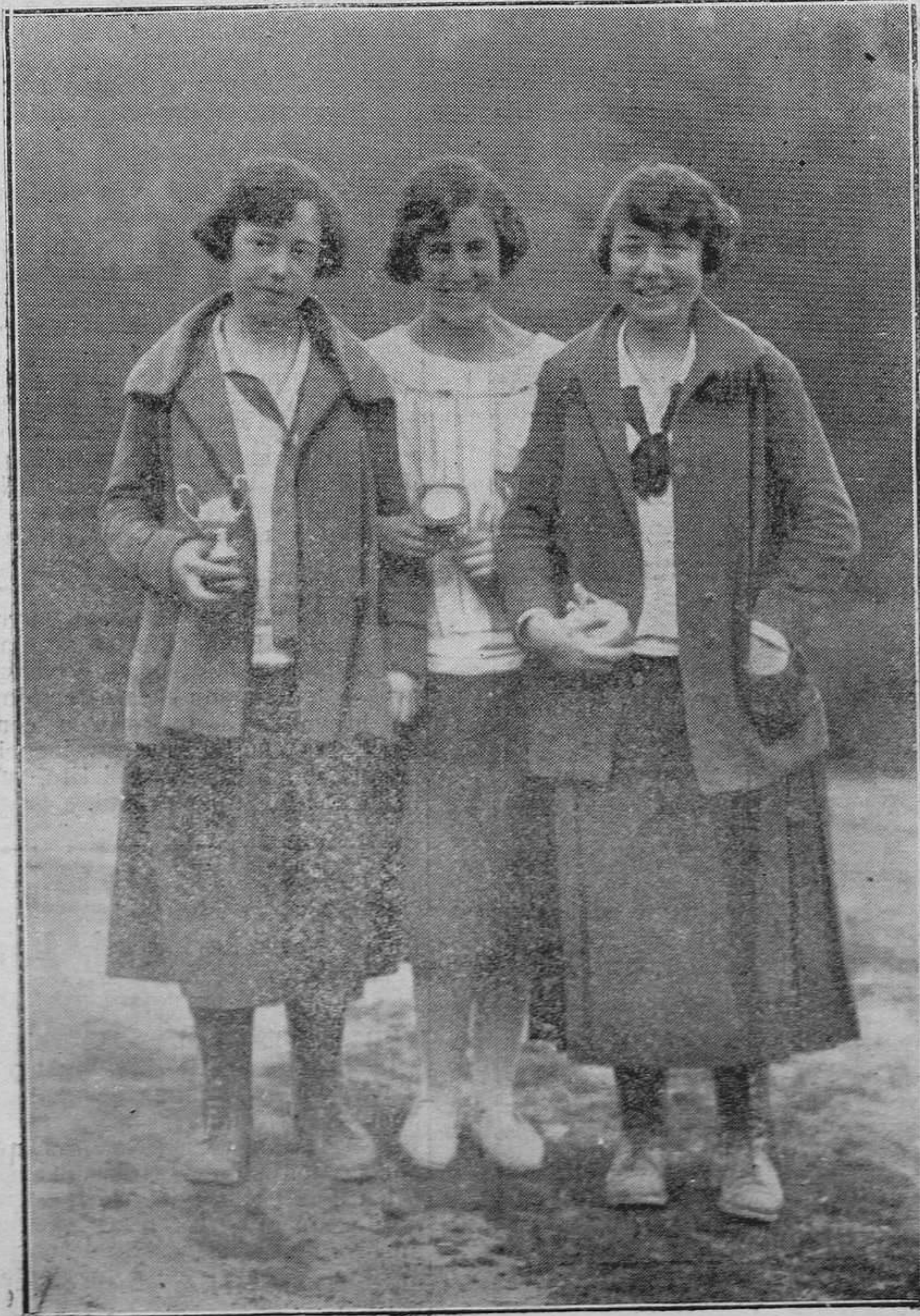
MADRID.- Tres bellas concursantes de 'skis', que han ganado diferentes premios.

Invitamos a nuestros lectores y anunciantes a comprobar que la tirada de REGION es la mayor de todo los periódicos asturianos.