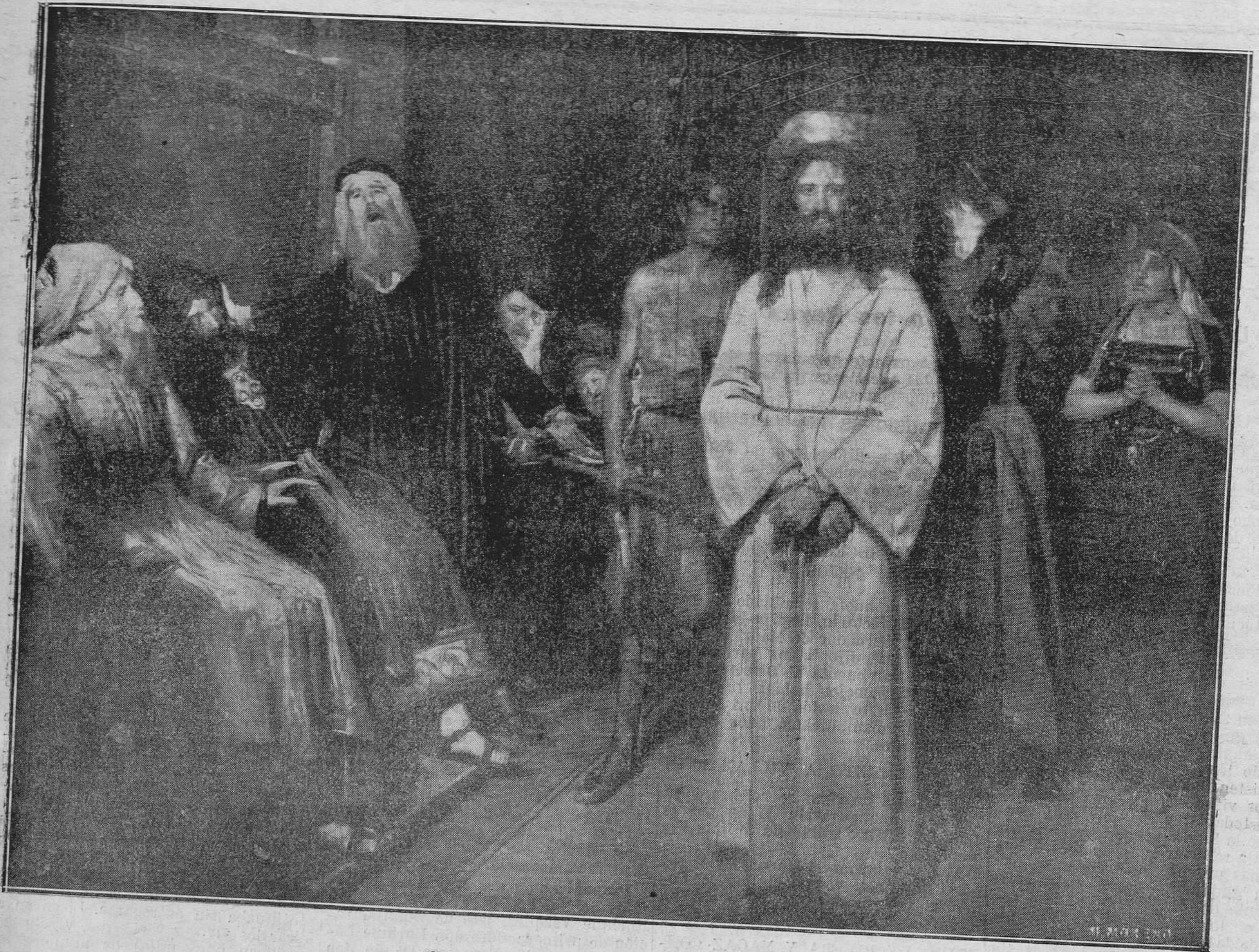
"YO SOY", tabla de Luis Menéndez Pidal.

EXPLORACIONES INVENTOS Y CIENCIAS APLICADAS Varios artículos y fotografías interesantes