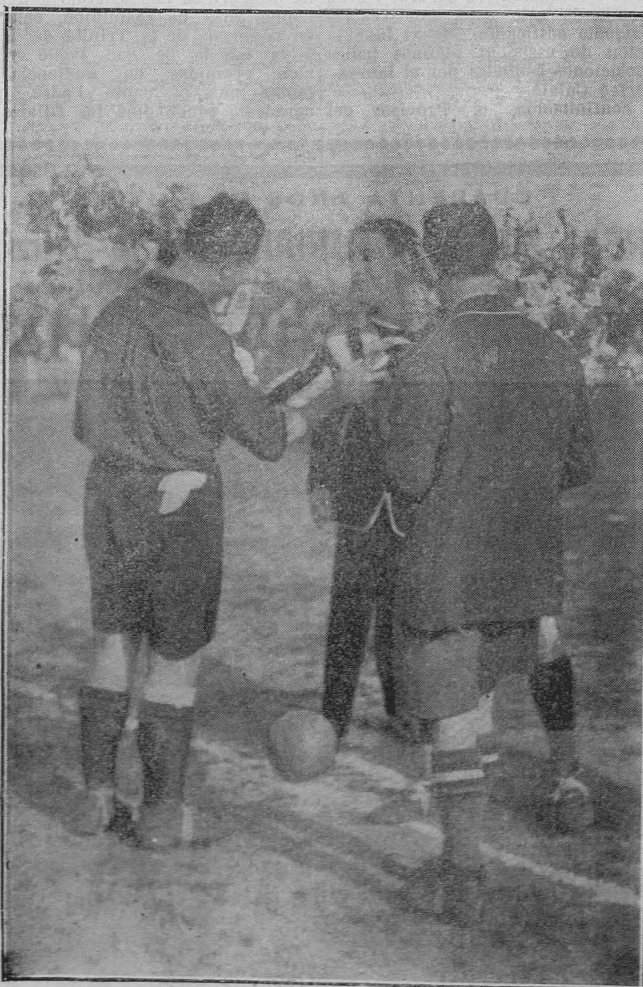
DEL PARTIDO DE SELECCIONES ASTURIAS-CANTABRIA.—Los capitanes se cruzan los ramos de flores antes de empezar.

Aprende que más te vale ofender al prohombre mismo, que al hombre que le sirve en su guardarropa.