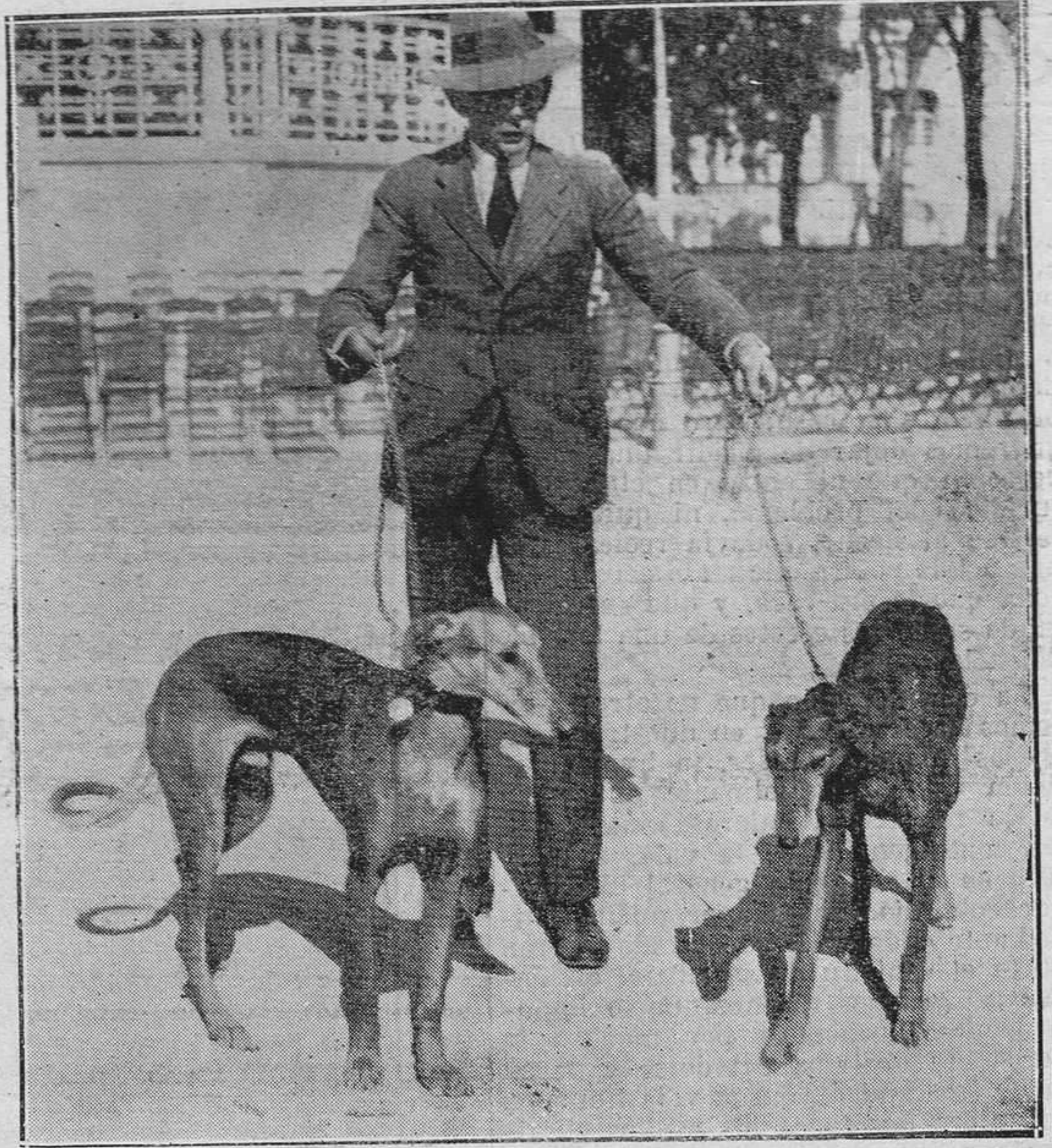
MADRID.- Dos hermosos ejemplares de gaigos, presentados en la Exposición internacional canina.

Otra de 10 pesetas, a un vecino de esta ciudad, por embriaguez.