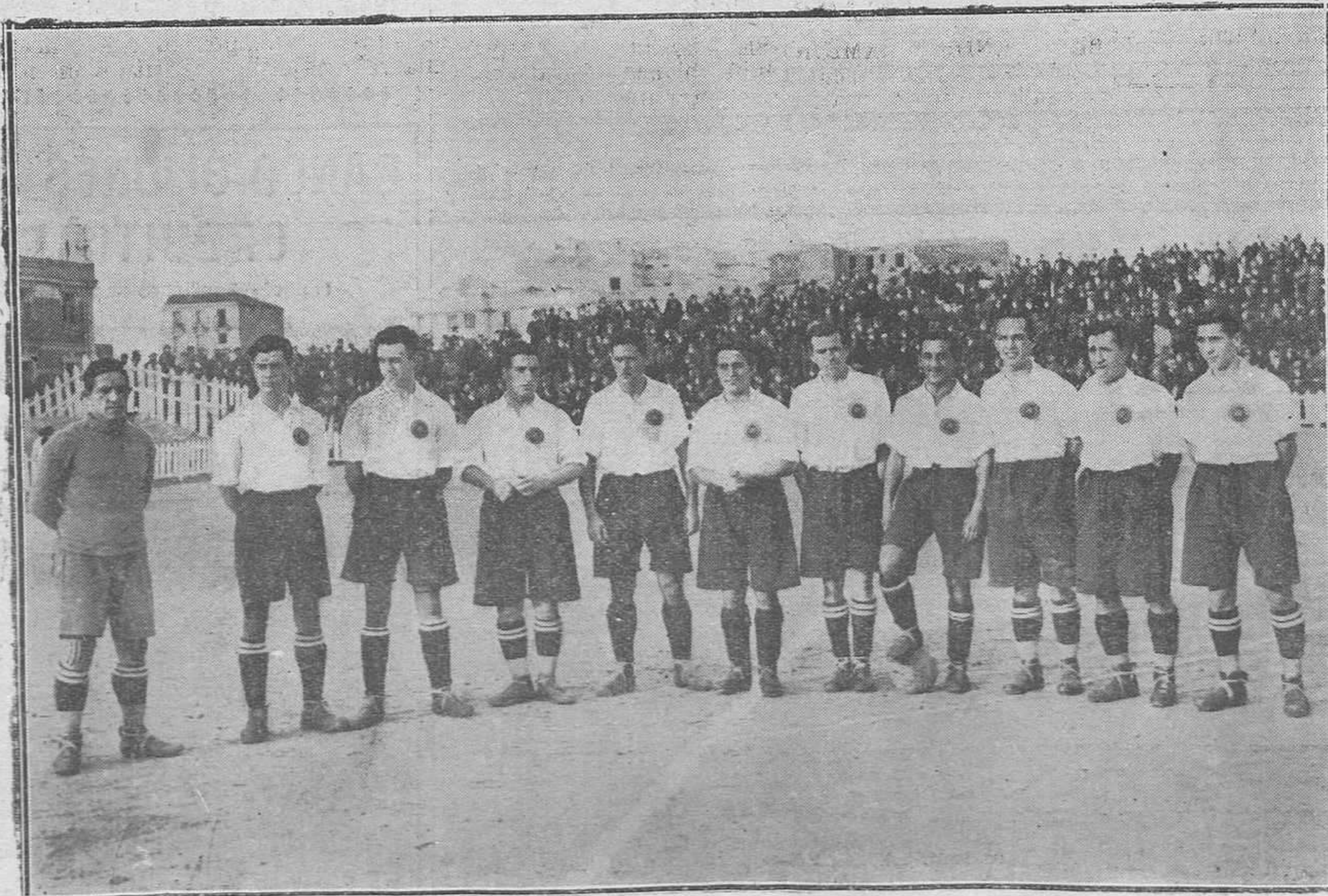
MADRID.-Equipo del "Real Madrid", que en el partido del pasado domingo venció a su contrincante el "Unión Sporting".