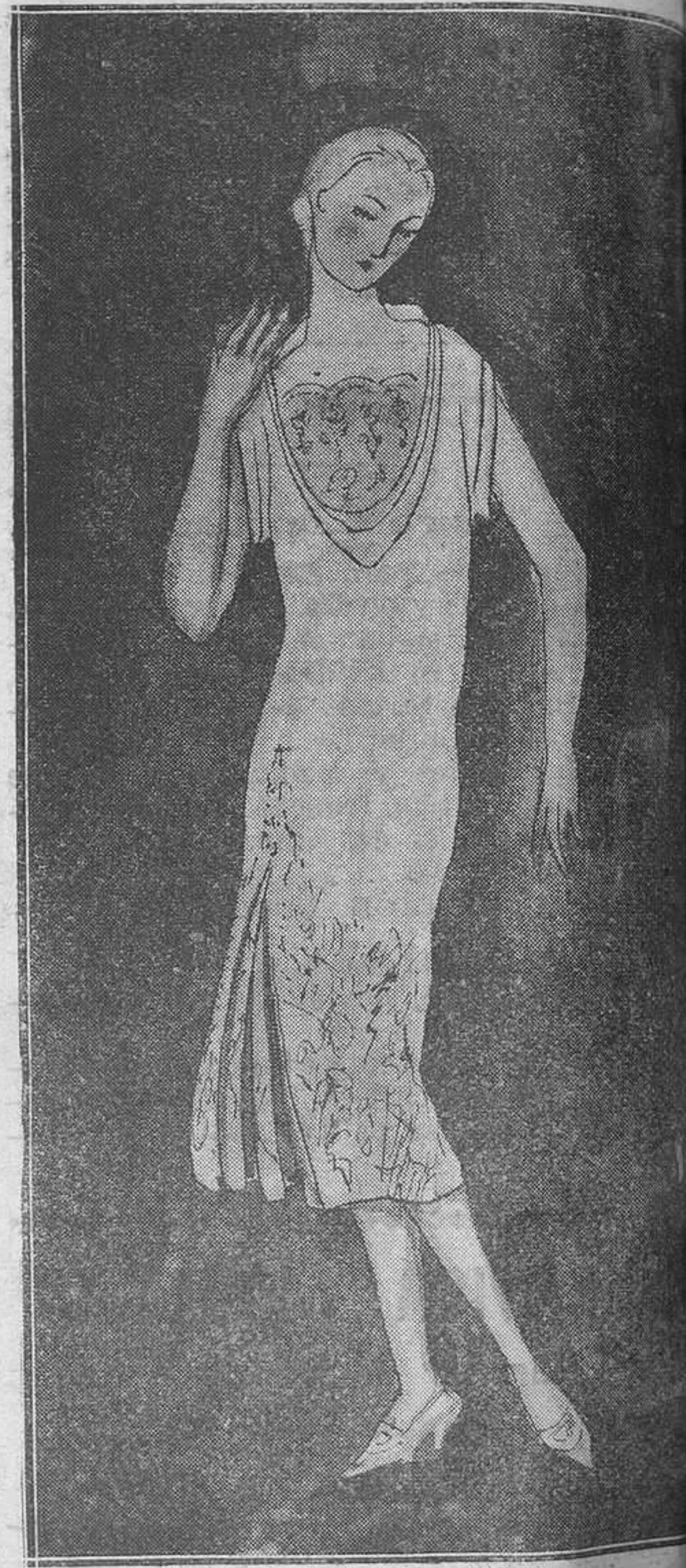
III.-Un elegantísimo vestido para fiestas de tarde en crespón mordoré, bordado en cristal con un pechero de antiguos encajes de chantilly

por unos bonitos gemelos hechos de botones quines de esmeraldas y guarneciendo los puños de las mangas unos estrechos lazos de "moaré". Veamos también este otro modelo para tarde, en crespón "mordoré", bordado en cre