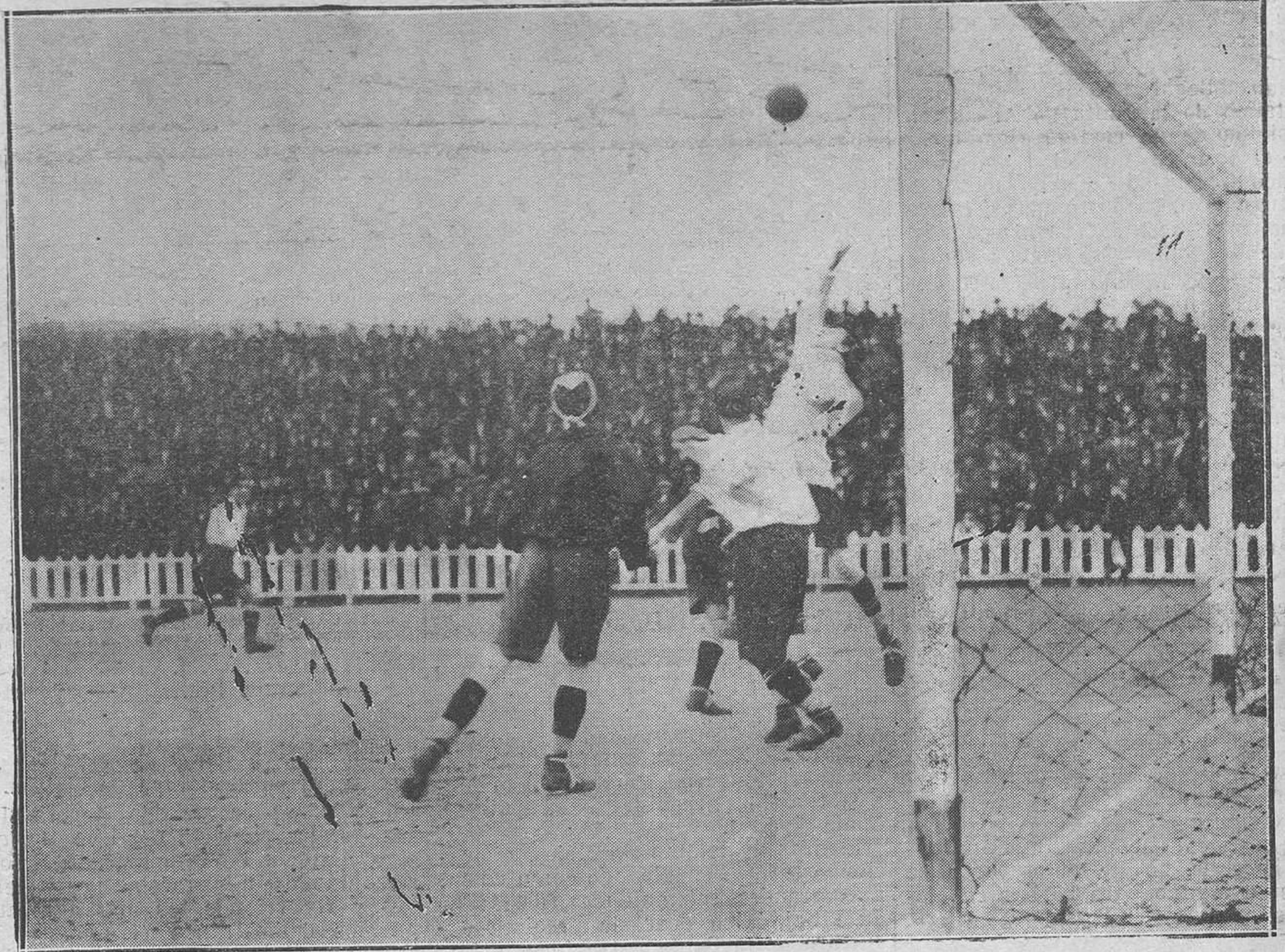
MADRID.-Un momento interesante del partido celebrado entre el "Madrid" y el "Unión Sporting".

Esto trae como consecuencia el dominio de Avilés, que se hace dueño