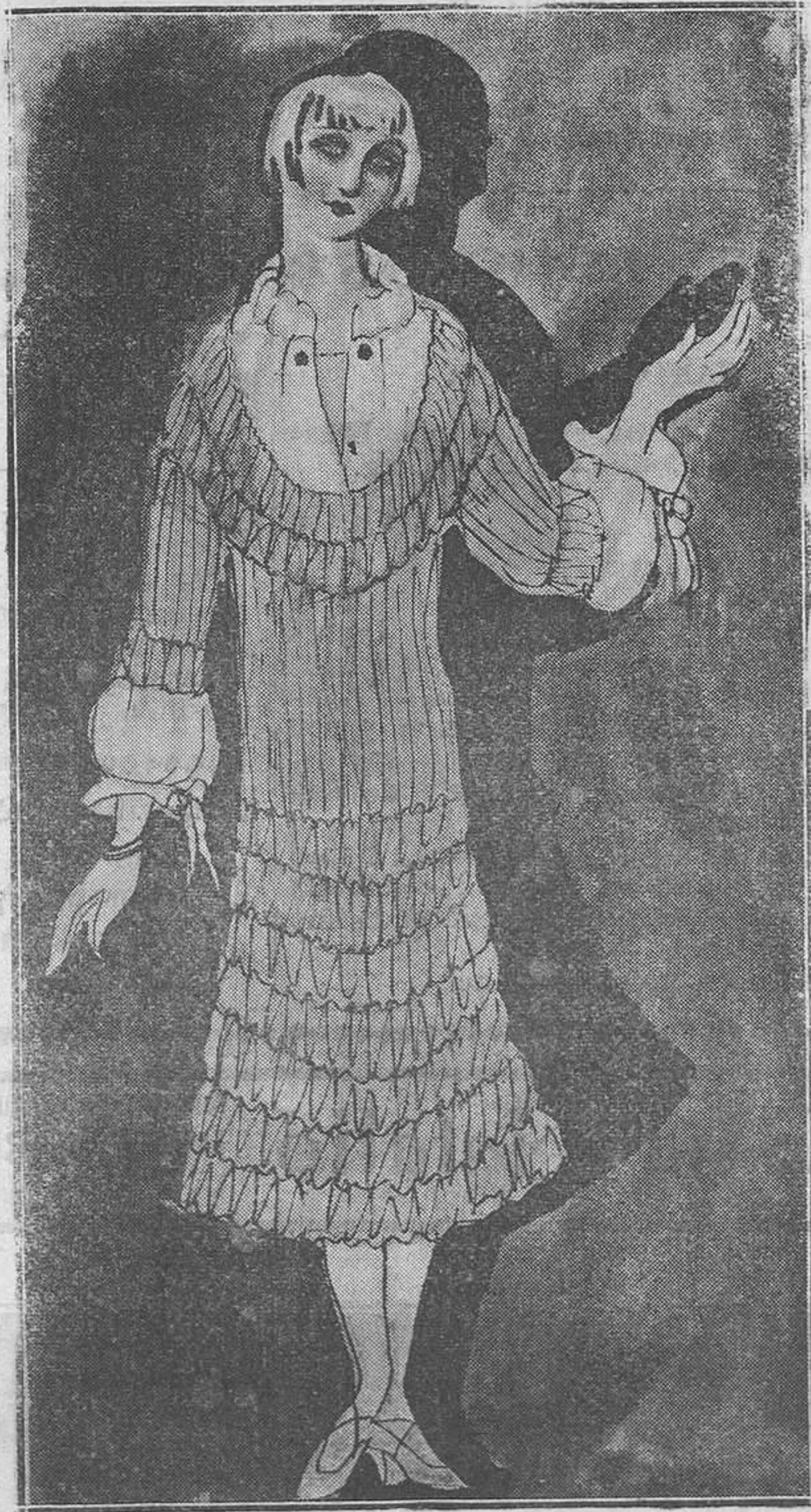
II.-Un original modelo en gasa georgette, fruncida con pechero y mangas de crespón en un delicioso tono, verde almendra, para el georgette y blanco para el crespón.

estilo, porque ya saben mis lectoras que los modelos son infinitos y que de uno de ellos podemos hacer infinitos con sólo pequeñas variaciones.