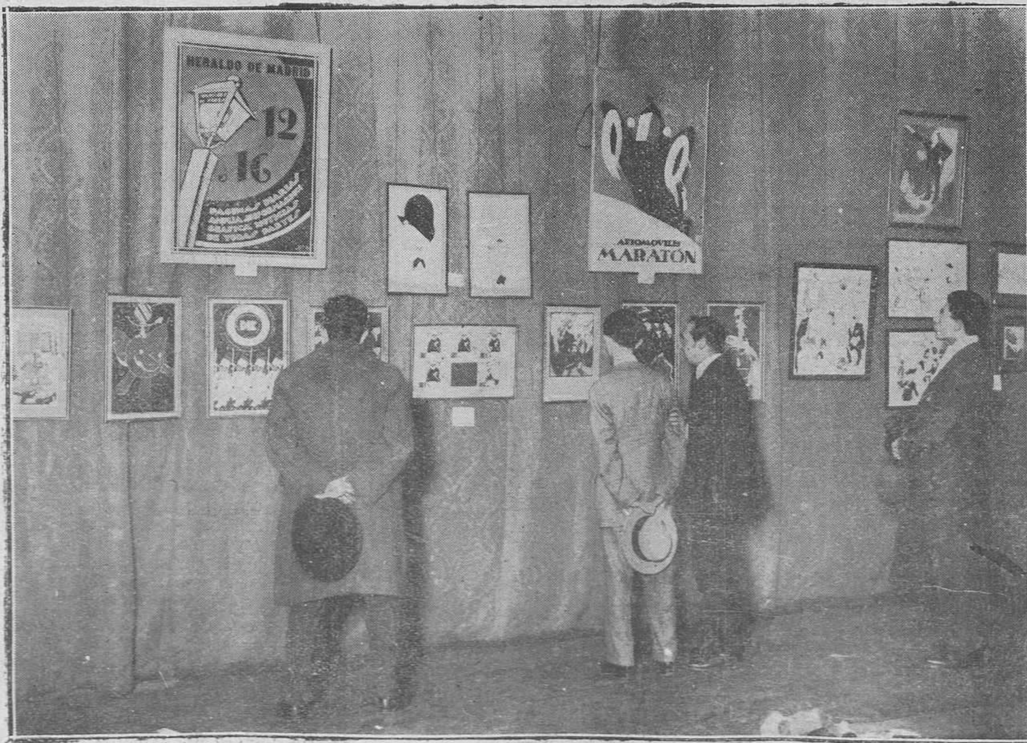
MADRID.-Inauguración de la interesante Exposición organizada por la "Unión de Dibujantes Españoles".