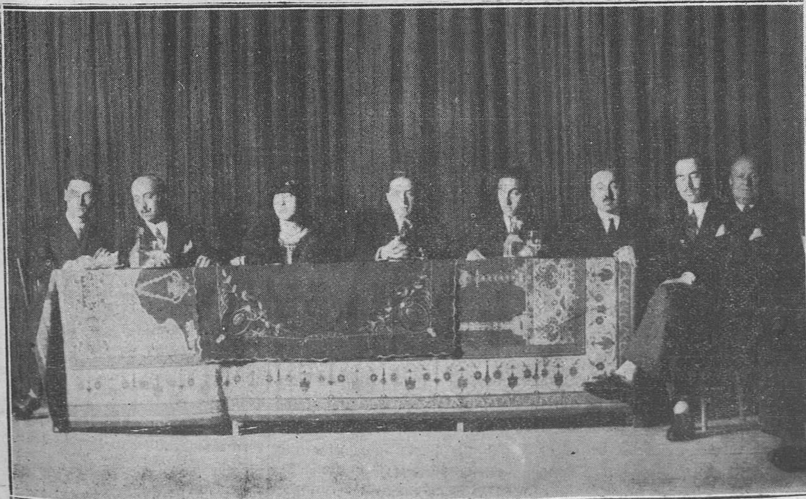
MADRID.—La presidencia del acto organizado por el Comité Hispano filipino de Madrid, como homenaje a los ideales de Filipinas.