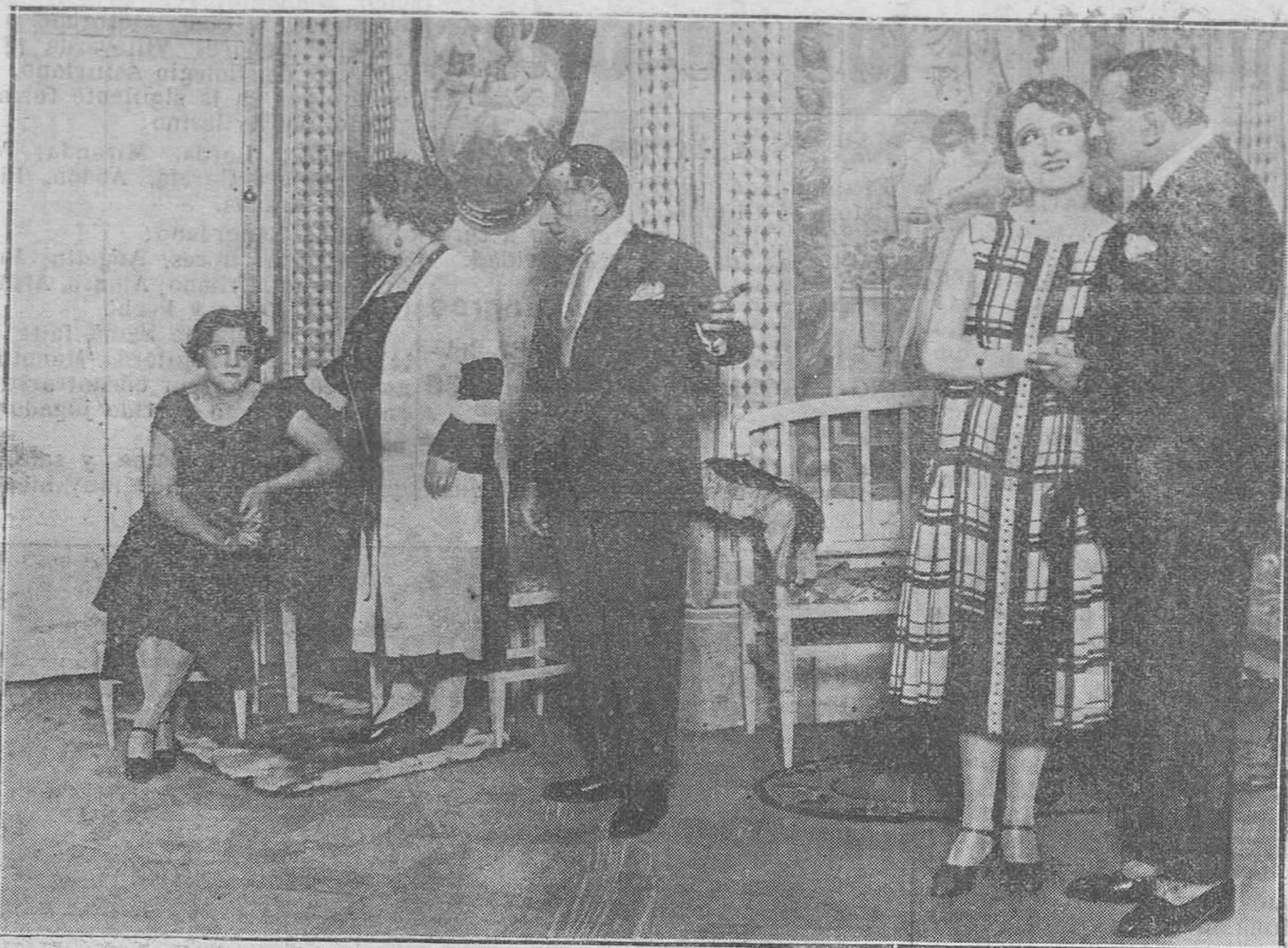
OVIEDO.-Escena final de la obra "La dama sa vaje", estrenada la noche del lunes en el teatro Campoamor por la Compañía Meliá-Cibrián.

Tanto la madre como la recién nacida se encuentran en excelente estado de salud, por lo que enviamos a los padres nuestra enhorabuena más sincera.