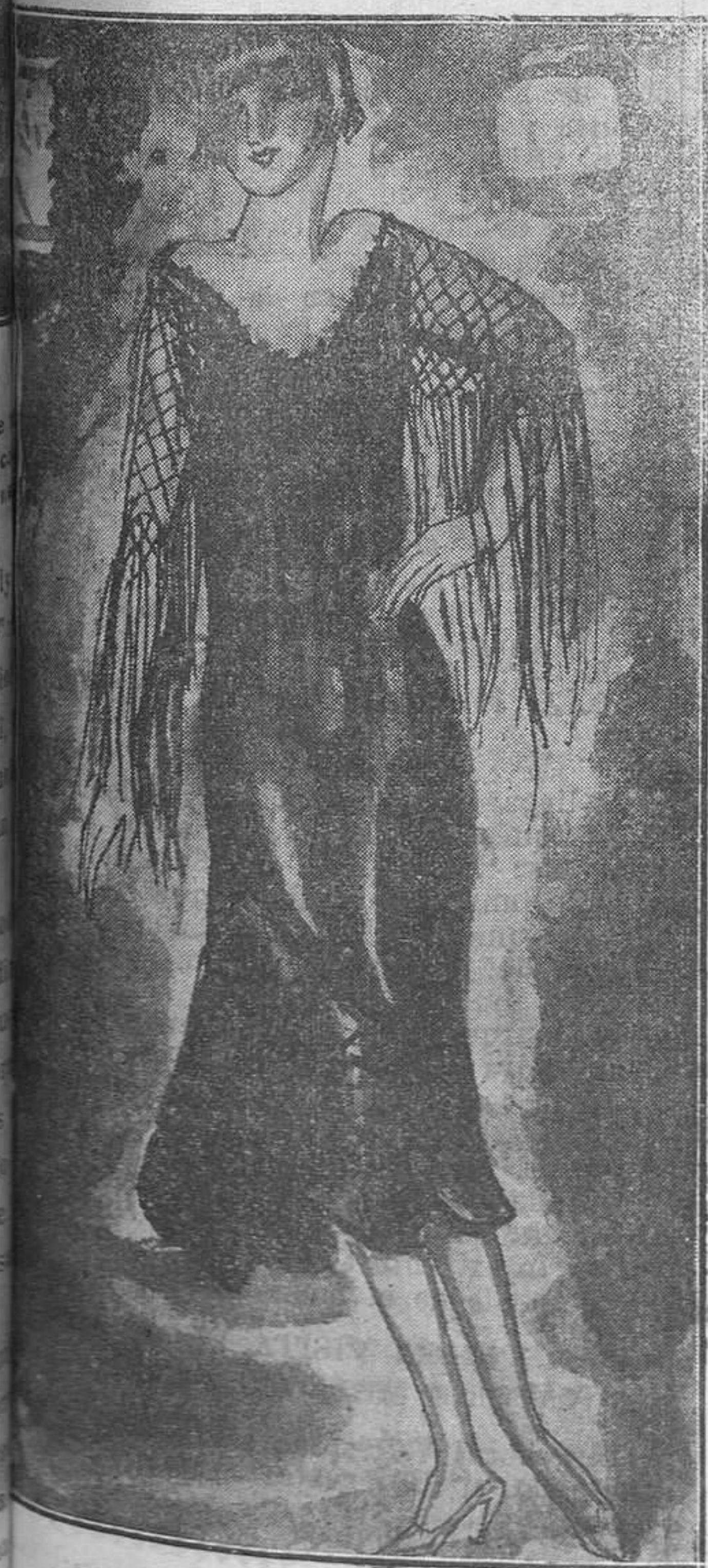
Un original vestido para una fiesta español- se, en terciopelo negro, con la base bordada de azabache y flecos de seda negra