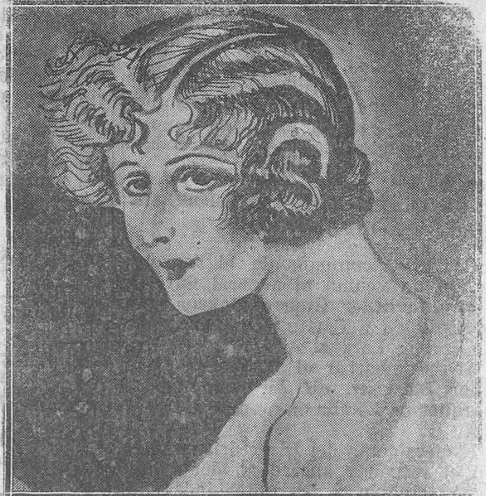
V.-Un peinado para teatro, sencillamente encantador.

Y, sobre todo, unos abrigos de pieles de Hartel Re-