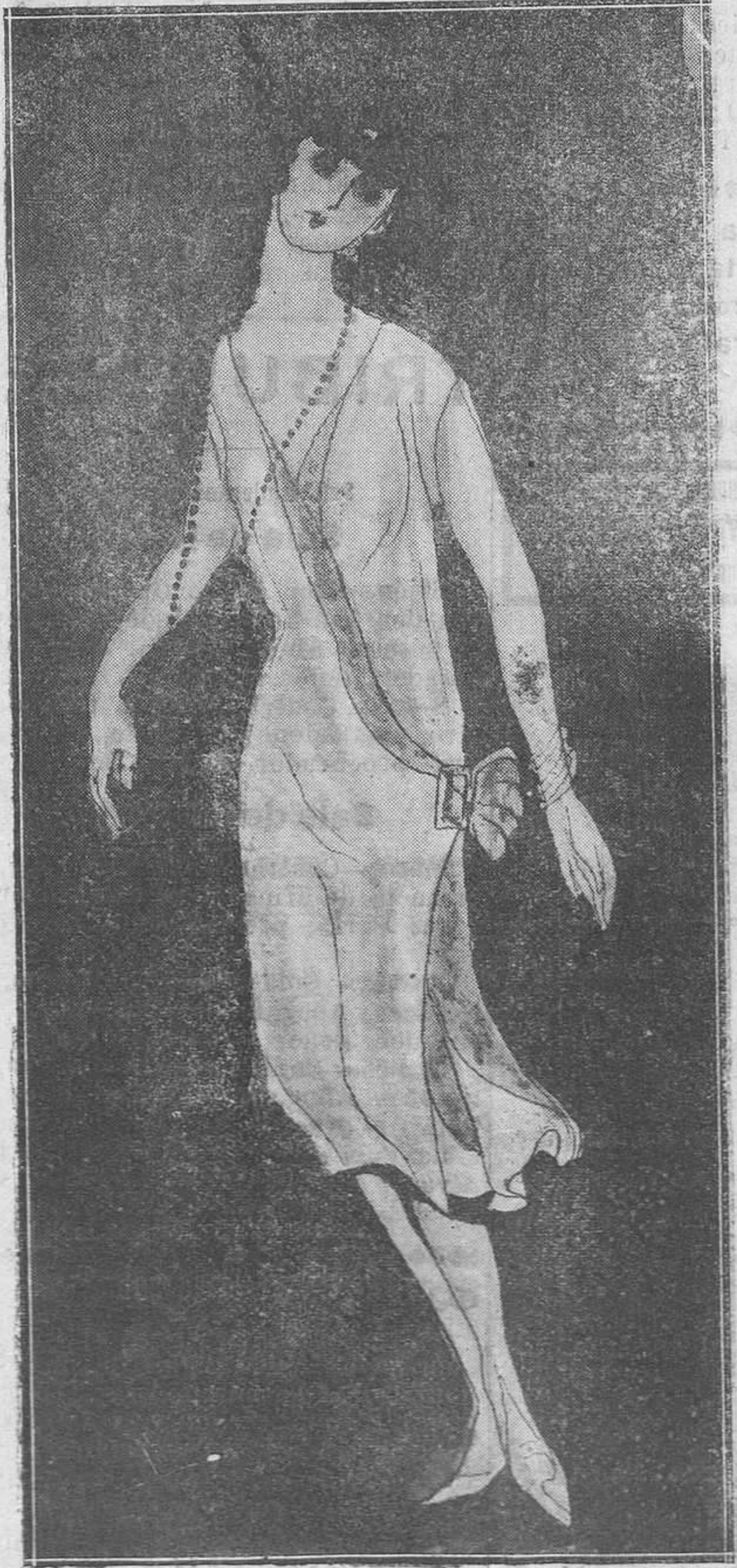
I.-Un bonito vestido de baile en lamé de plata gris, con adornos de terciopelo violeta, bordado de plata.

nácar en toda su longitud, abrochado con presillas de felpa del mismo tono del vestido y entre estos botones, que dejan entreabierto el vestido por el largor de las presillas, un forro de terciopelo del mismo tono "orange"; podía seguir enumerando modelos en este