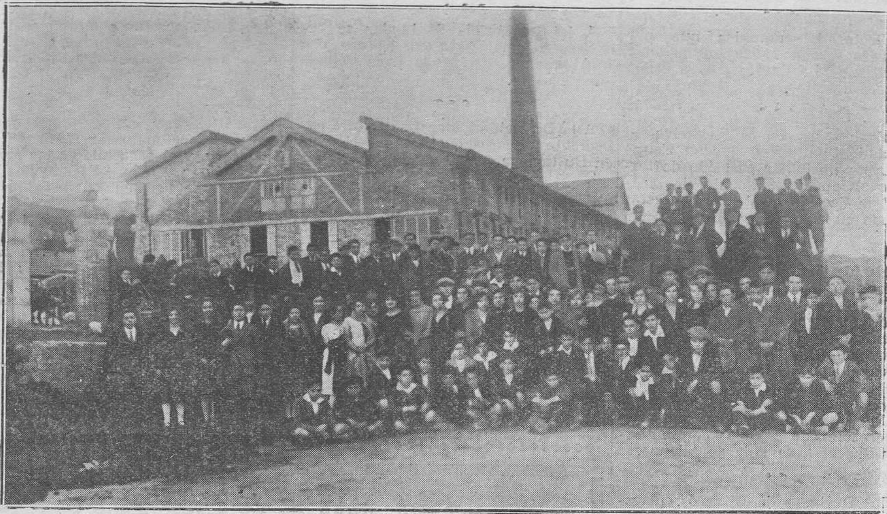
OVIEDO.-Alumnos de la Sección Comercial, de la Academia Ojanguren, que el 17 del actual hicieron una excursión a pie, al vecino pueblo de San Claudio, con objeto de visitar importantes industrias.

ARTICULOS SANITARIOS Pídan presupuestos, se facilitan gratis Artículos hidráulicos, Azulejos de Talavera y sevillanos Las mejores fabricas de España, etc., etc. GARCIA Y ESCOBEDO (antes B. Piquero y Compañía) Oviedo - Gijón