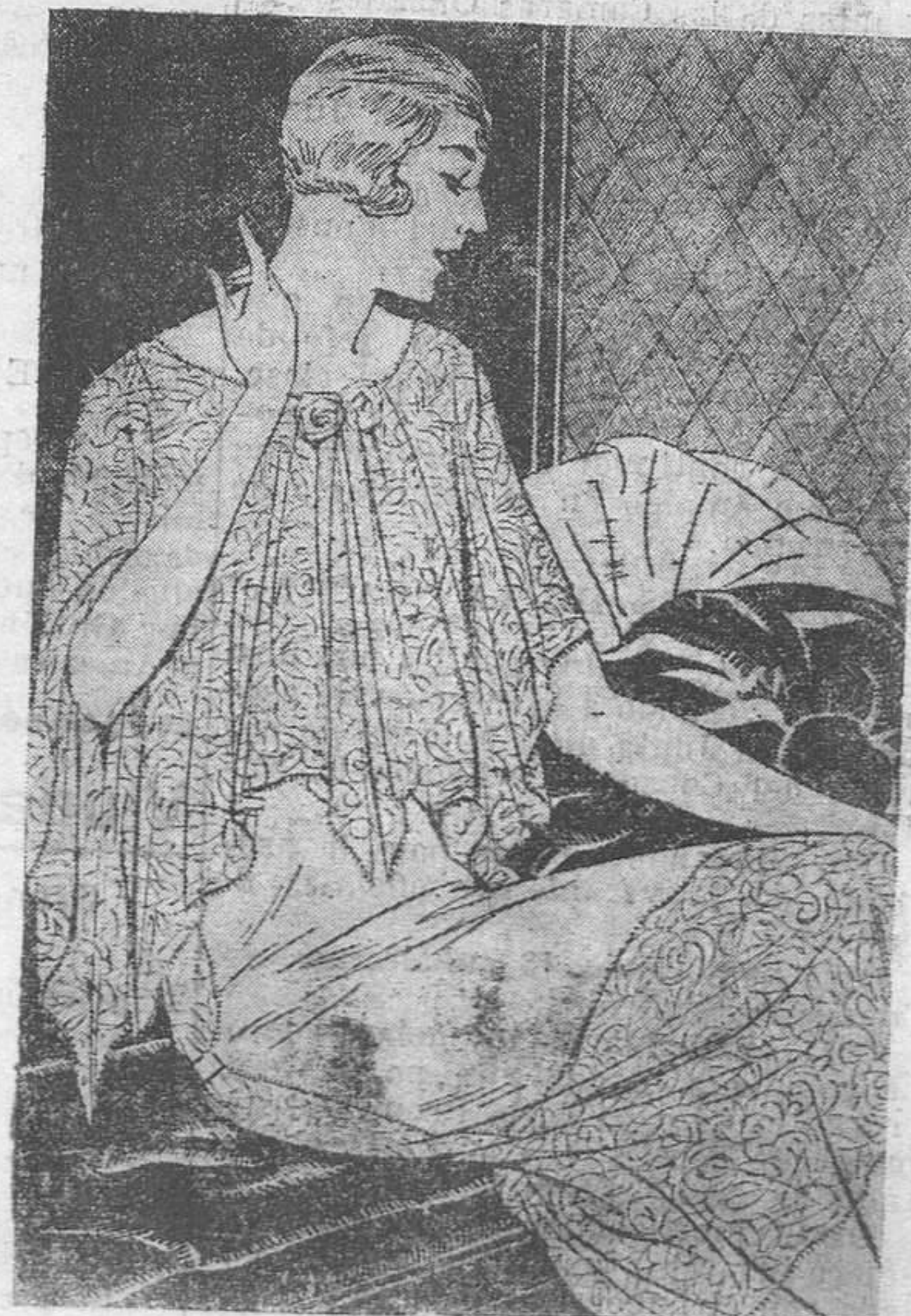
Graciosa "robe" de china crepé grano negro matizada con encajes de plata antigua.

Por eso muchas mujeres no son guapas más que sin sombrero. Hemos podido verificarlo una vez más en una cena dada, recientemente, con motivo de la inauguración de un gran restaurant abierto en París. La concurrencia, muy elegante, que se apiñaba en torno a las mesas, multiplicada por las circunstancias, destacaba con mayor abundancia de mujeres hermosas de la que estamos acostumbradas a ver a esas otras horas en que el fieltro obligatorio, cubre las cabecitas elegantes y las que no lo son. En esta cena, algunos descotes de hombros y espaldas tuvieron un éxito sensacional, por su impecabilidad de línea. Había, entre todos, un traje de terciopelo azul, bordado de perlas y lentejuelas, cuyo escote en V era una maravilla... y no obstante, no todo el mundo puede llevar este modelo.