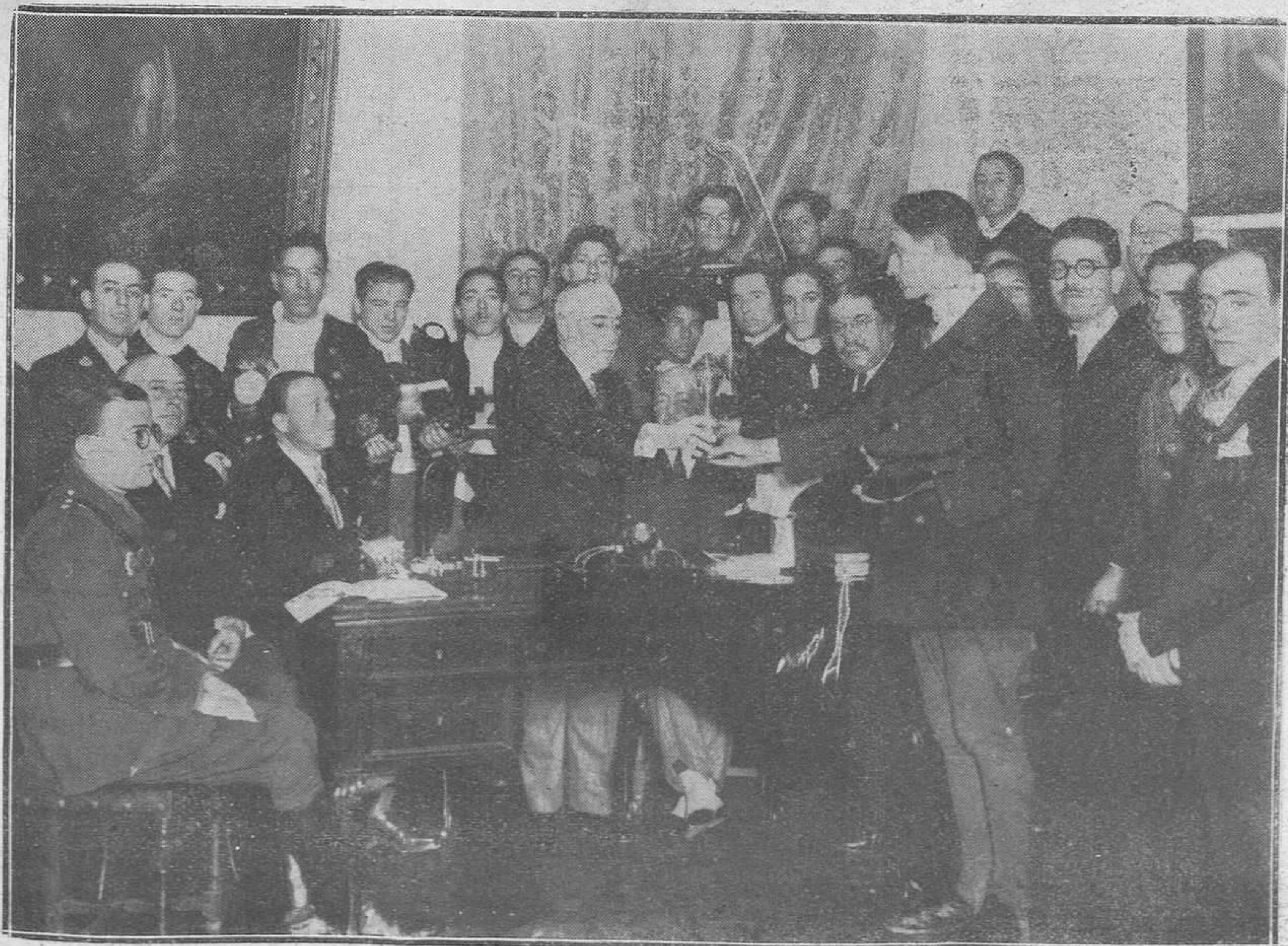
MADRID.-Reparto de premios del trofeo "Juventud Morales", organizado por la V Comisión de la Cruz Roja.

CUARENTA AÑOS DE ÉXITO REAL SIDRA ASTURIANA-(Cima-Extra) De l Excmo. Sr. D. José Cima Carcia.-Oviedo