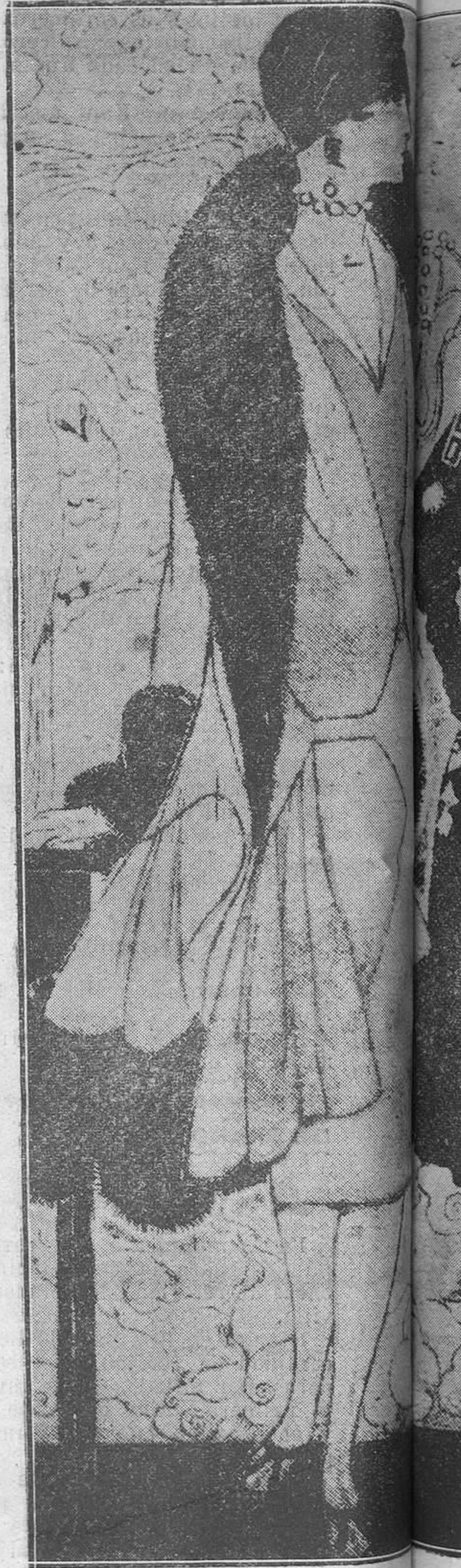
Conjunto elegante en "beria" roja. MANTEAU LLECLA color ciruela guarnecido de bordados

¿Por qué vacilar en ponerse unos trajes tan bellamente femeninos, cuando puede unirles el confort de un pequeño vestido de mullida y suave lana, de tricel, que las más decididas pueden hacerse ellas mismas? No es ninguna empresa del otro jueves el hacerse un sweatus , de aspecto curiosamente chino, que se puede hacer con una gran rapidez con lana "Sudo", para