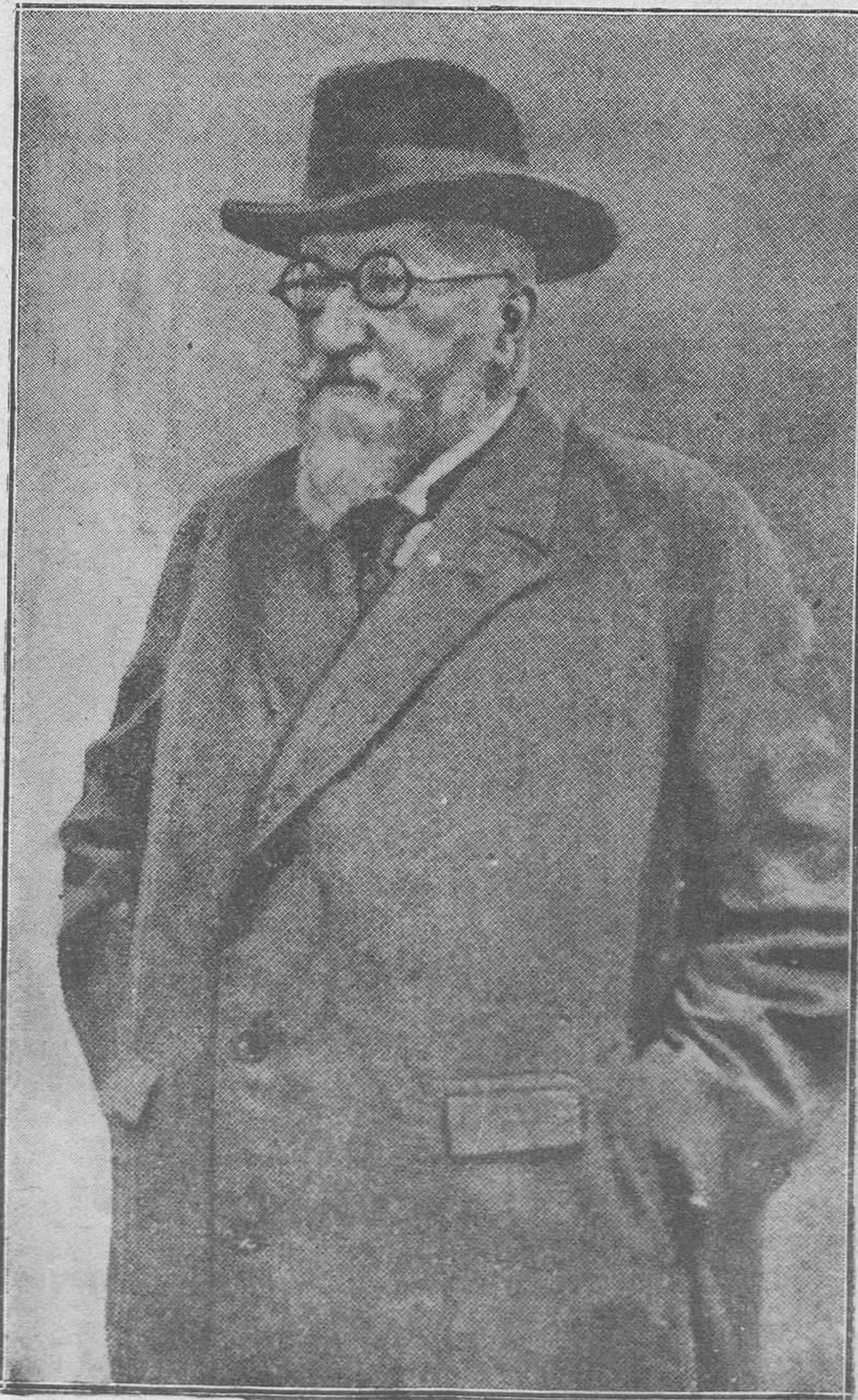
LOS REYES EN EL DESTIERRO.-Reciente fotografía del ex rey Fernando de Bulgaria, tomada en Berlín con motivo del Congreso de Ornitología de que el antiguo zar balcánico fué uno de los miembros más distinguidos.

No se devuelven los originales aunque no se publiquen