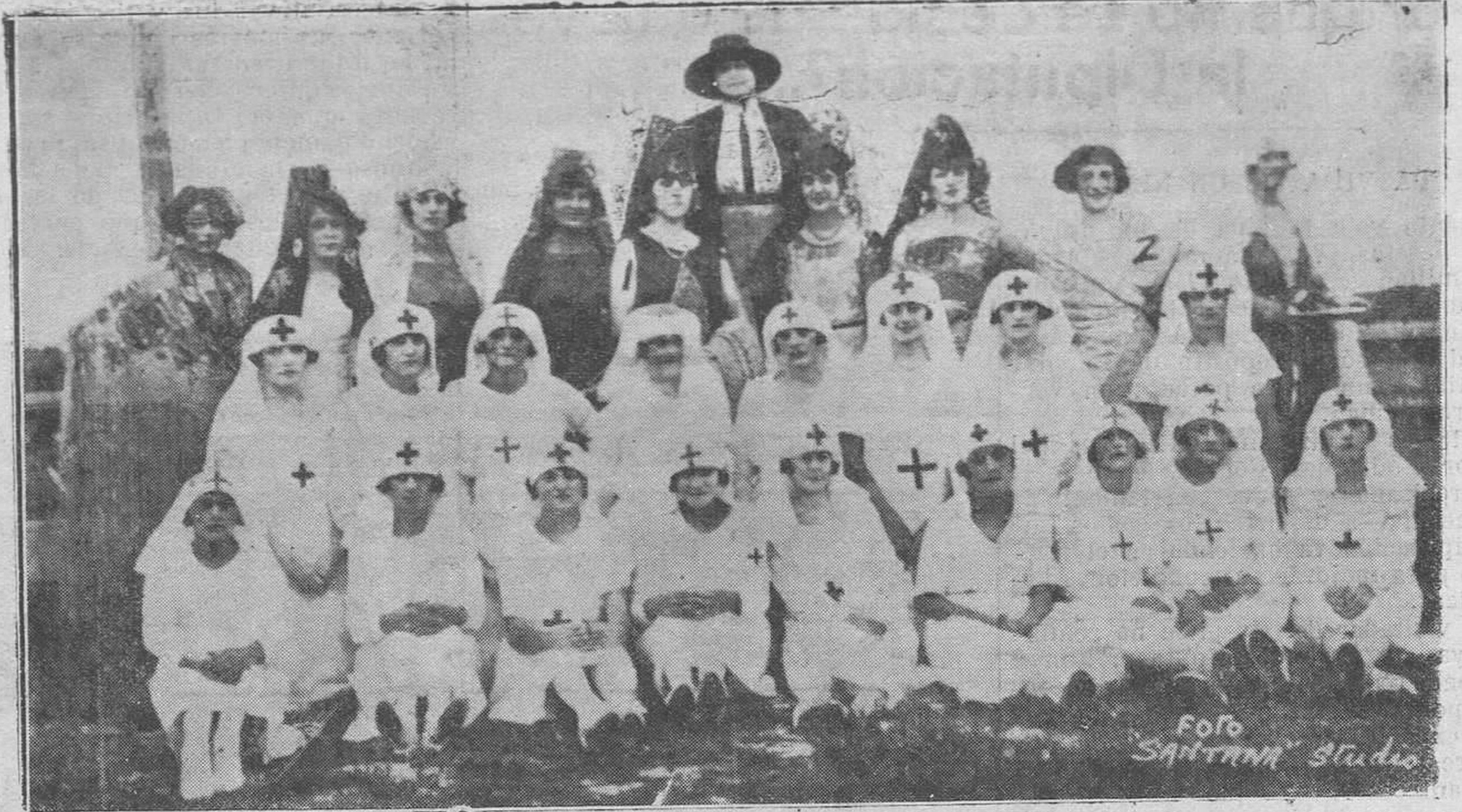
Grupo de señoritas de la colonia asturiana de Lampa, que organizaron una notable fiesta española celebrada con gran éxito.

REGION no depende de ningún partido político, ni de ninguna oligarquía financiera