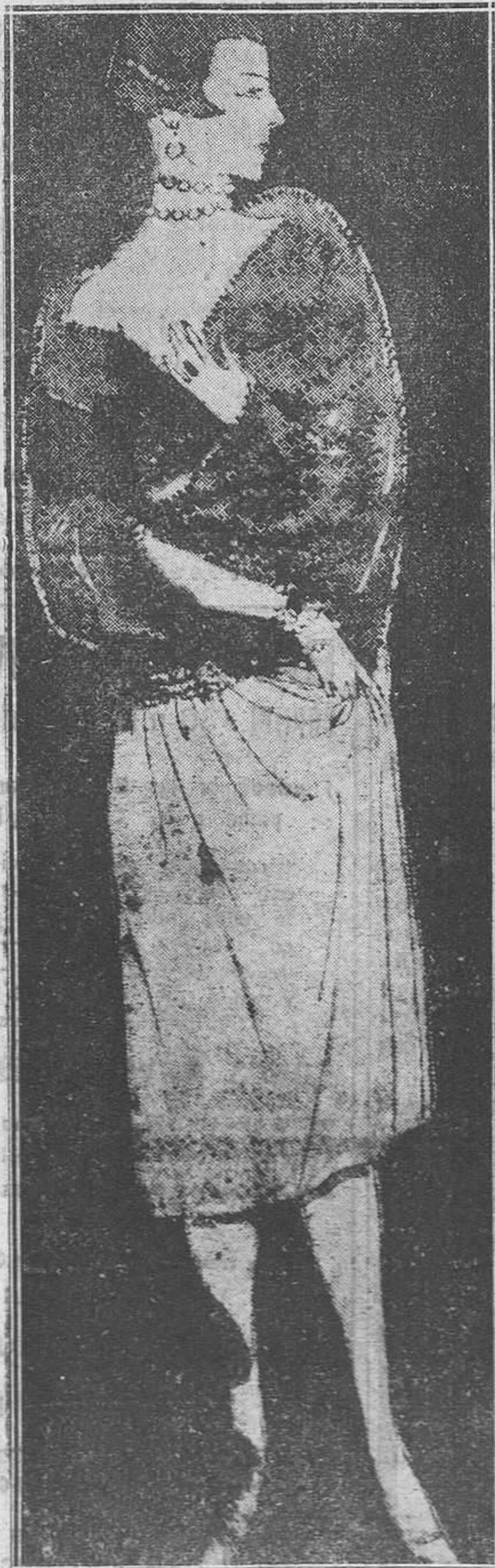
Hermosa capa de noche de terciopelo azul.

Se cuenta que en una gran Casa de Modas, en el momento de hacer desfilas la colección de maniqués, una de ellas se puso precipitadamente un modelo y pasó