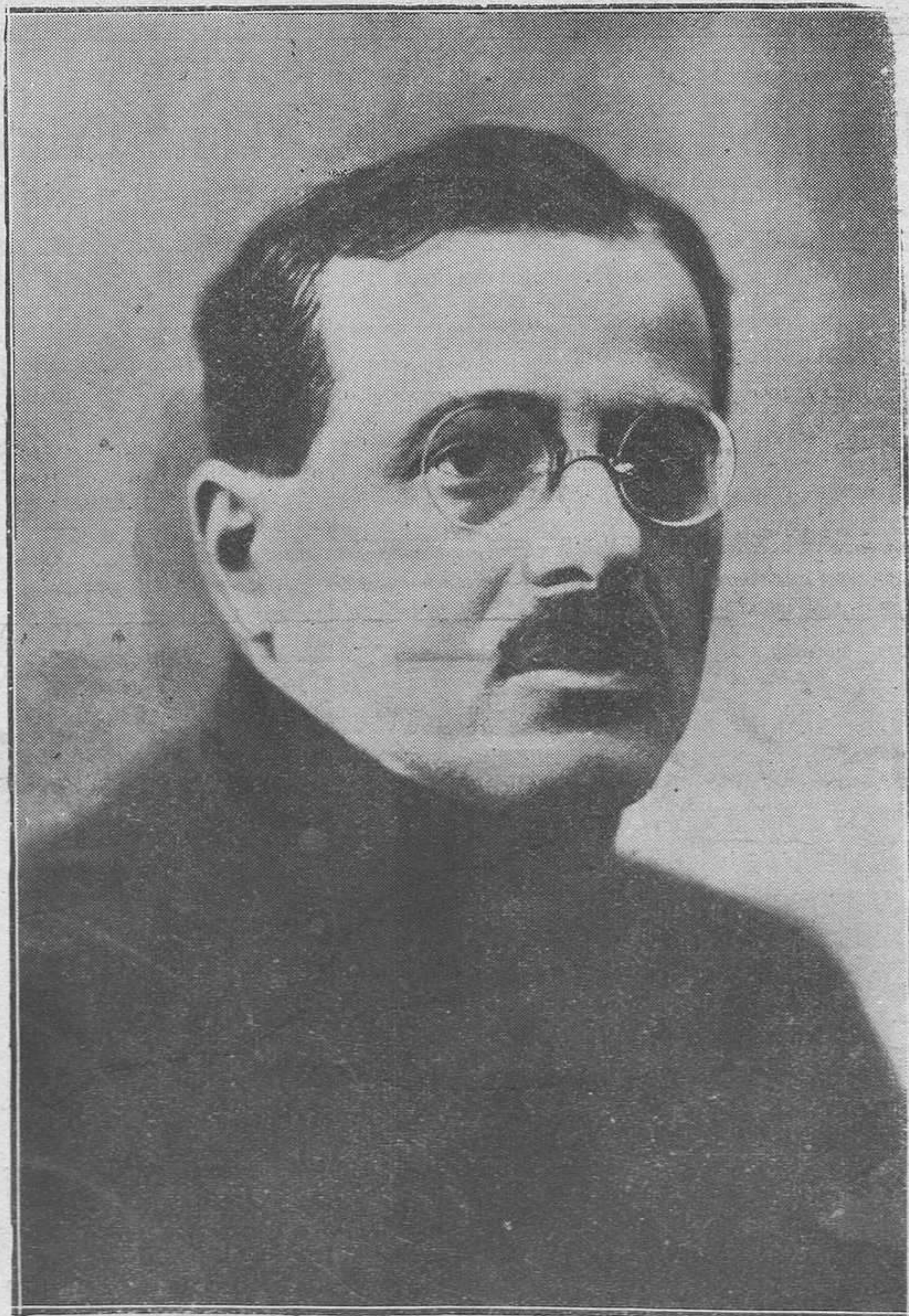
UNSCHLICHT, que ha sido nombrado Comisario de Guerra, de los Soviets, cargo vacante por fallecimiento de Frunse.

Funciones para hoy, miércoles. A las siete menos cuarto y diez y cuarto, la película cómica en dos partes "Casimiro, en los Angeles".