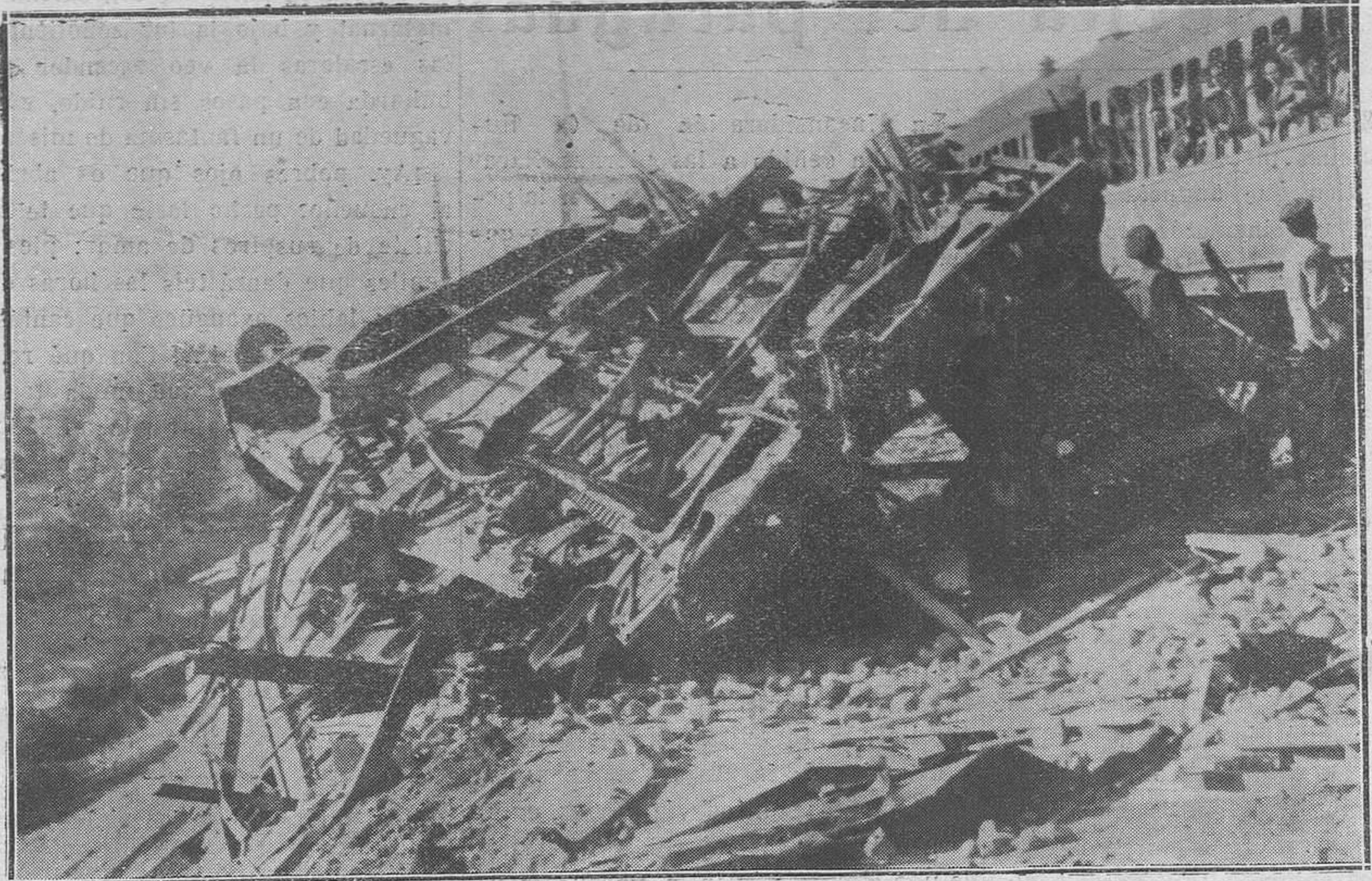
Del choque del rápido de Barcelona con un mercancías, en San Fernando del Jarama. El tren de mercancías, volcado sobre un terraplén.

Era tradicional en el pueblo celebrar la romería en un campo situado