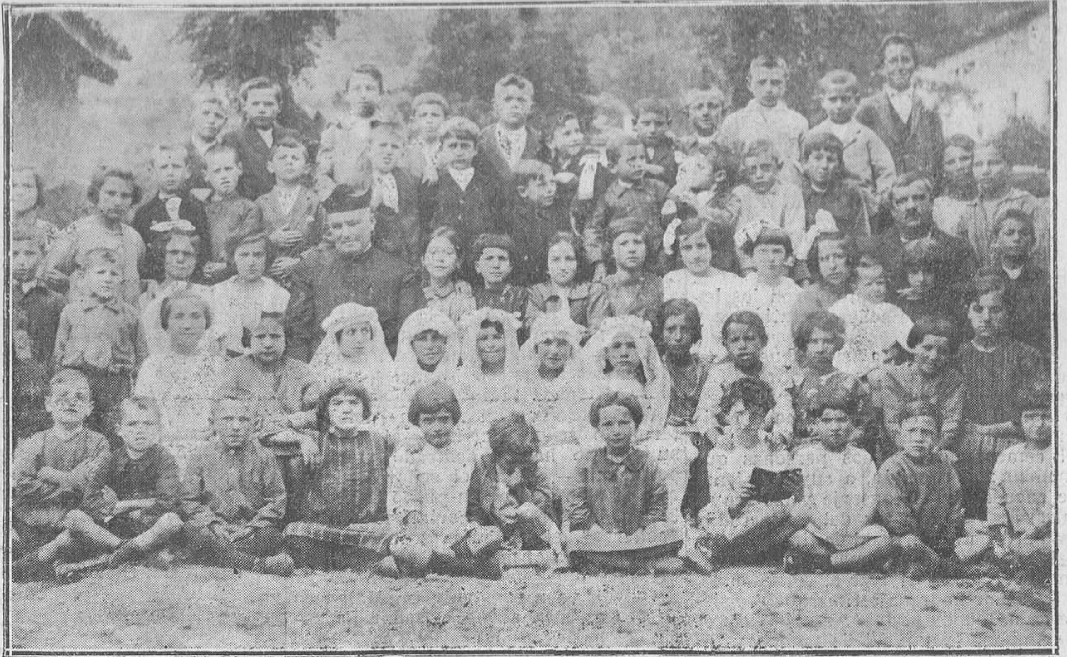
CAMPO DE CASO.—El párroco de Campo de Caso, rodeado de los niños que el pasado jueves recibieron la primera comunión.

Estos objetos serán de suma utilidad y gran servicio para la casa de mucha familia.