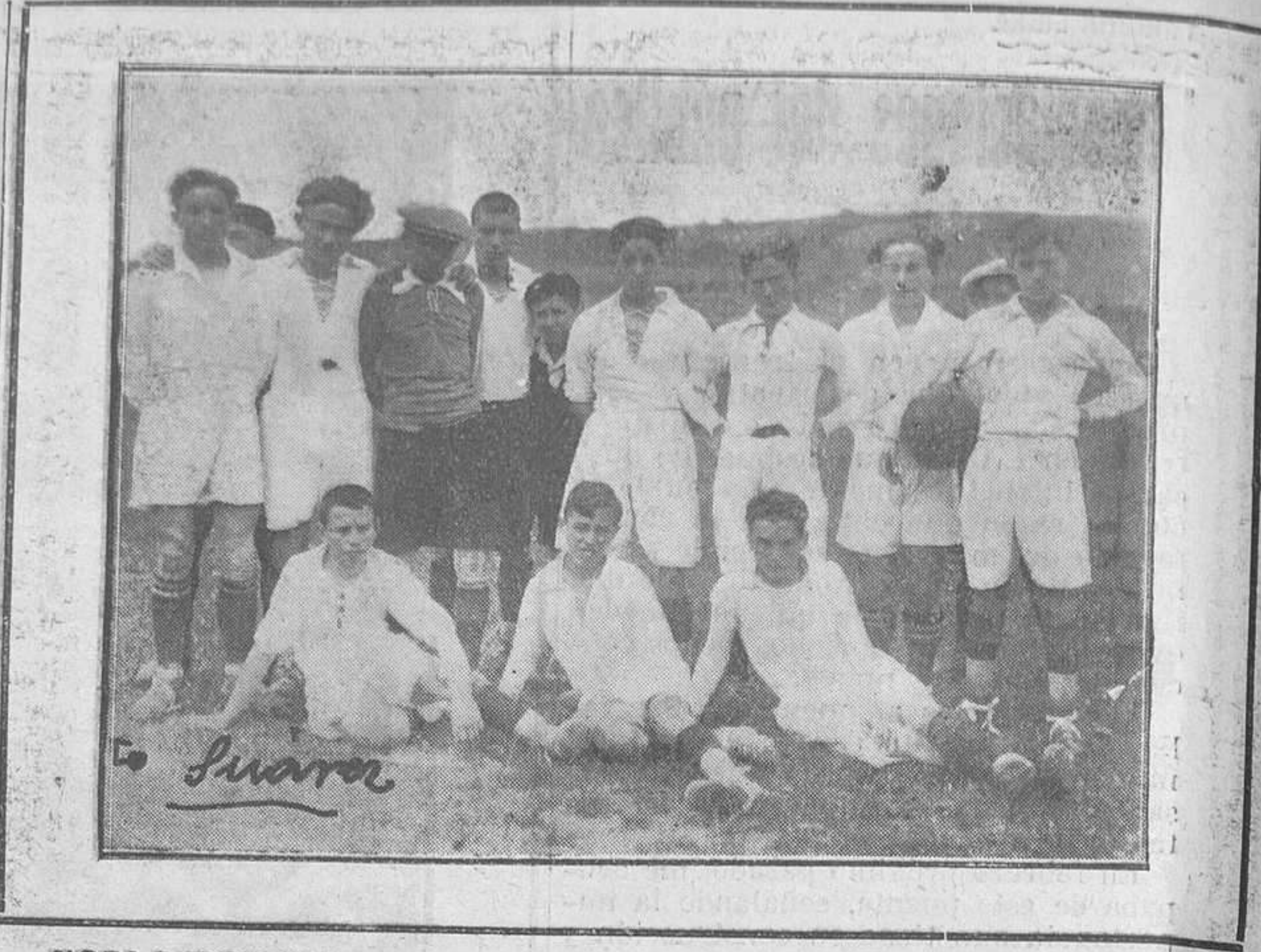
NOTA DEPORTIVA.—Equipo del Infantil Deportivo, de Oviedo, que resultó vencido por el Infantil Sporting, de Gijón.

Oviedo va a construir un Matadero (Matadero que, según el señor Ladreda, debe ser industrial y construirse en la estación del Norte). Y las aguas residuales de ese Matadero no pueden lanzarse por las alcantarillas tal y como se producen; primero porque arrastran despojos, que pueden acumularse y obstruir las alcantarillas, y