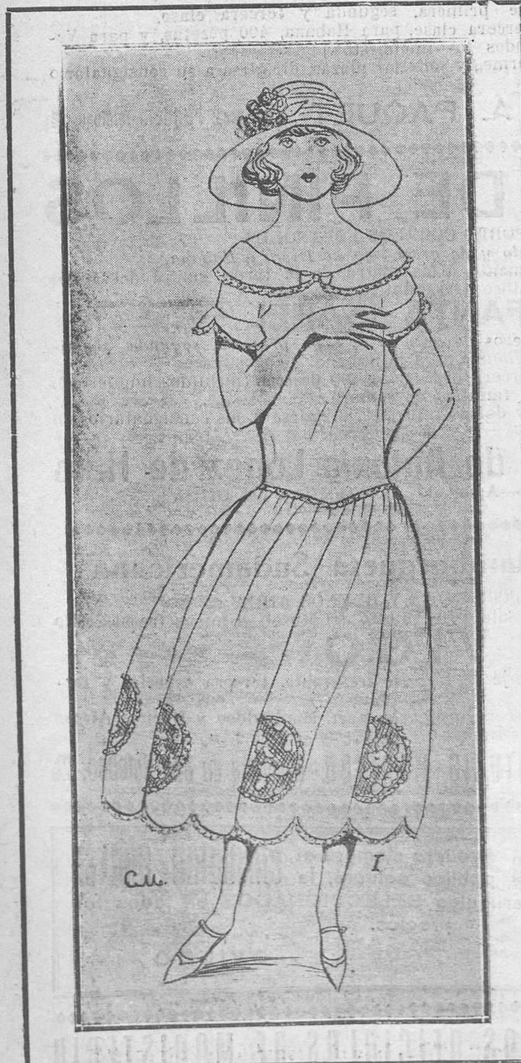
Núm. I.—Elegante vestido de organdi, color paja, adornado con incrustaciones de encaje de malla color crudo; una puntilla estrechita bordea el cuello, mangas y borde del vestido, recortado en ondas.