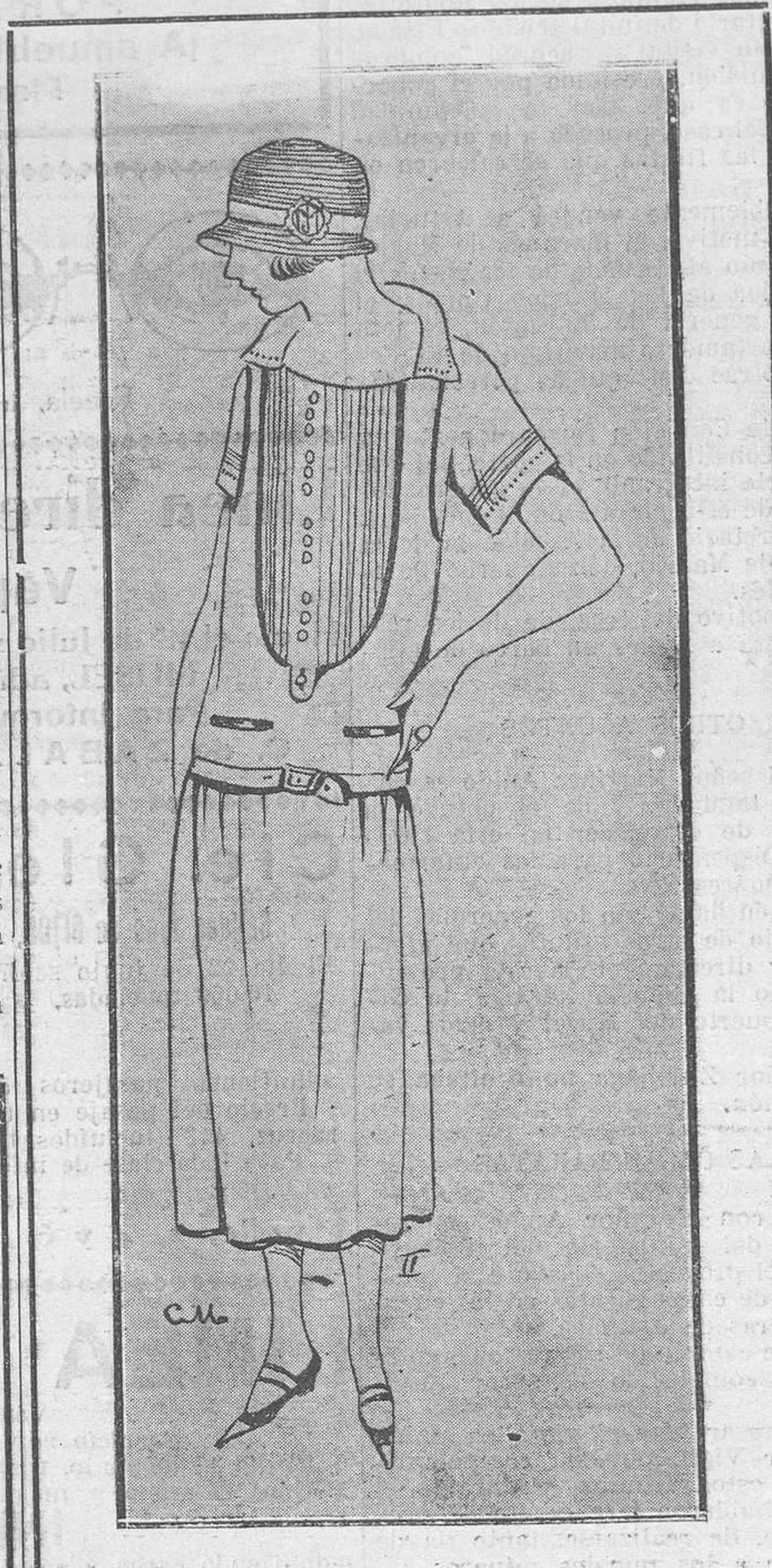
Núm. II.—Sencillo y juvenil trajecito de gabardina o punto de lana azul marino o marrón, que se lleva con una blusa de seda blanca o de color vivo.

Ahora se admite que no solamente una muchacha