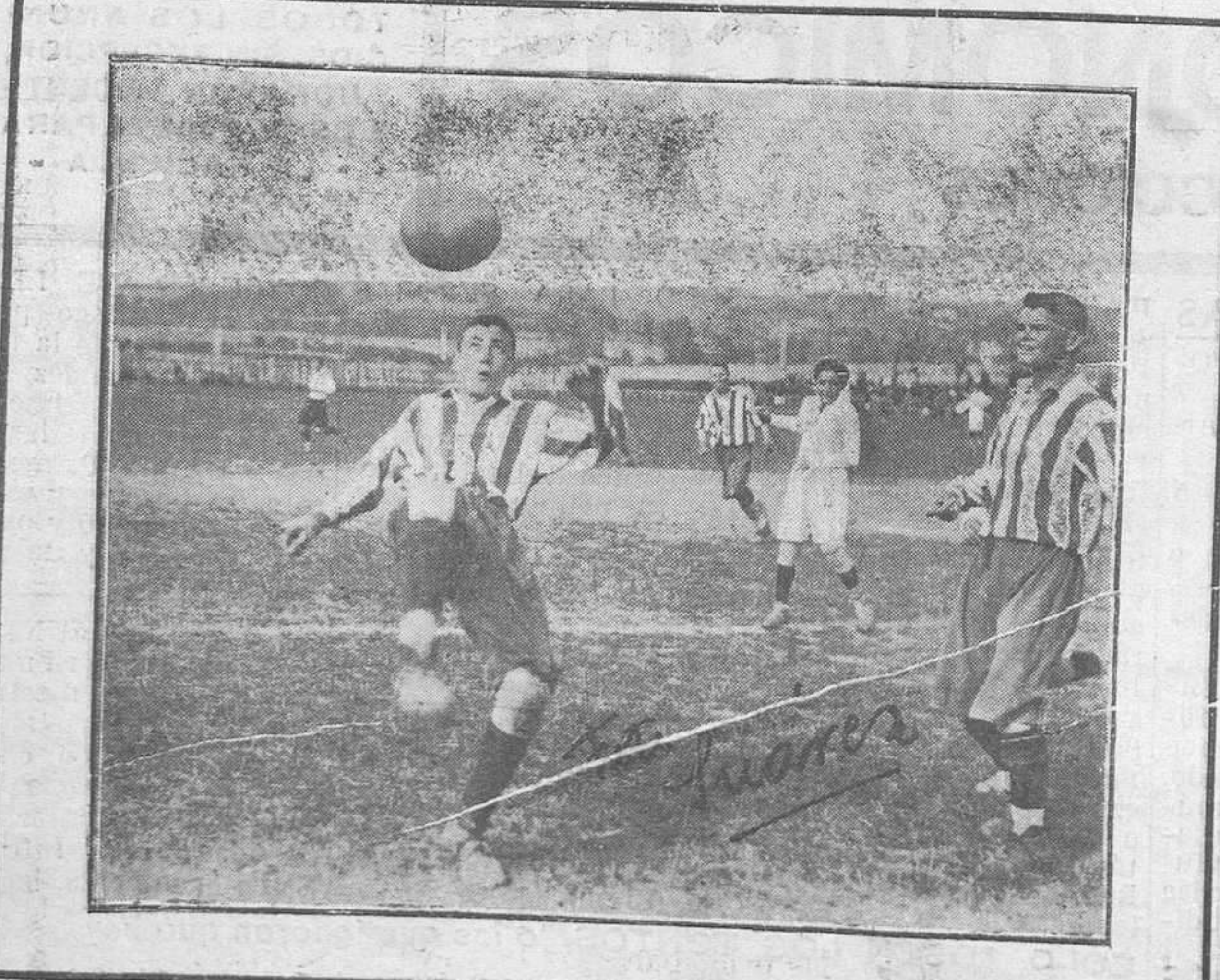
NOTA DEPORTIVA.—Una jugada del Infantil Sporting, de Gijón.

En Pesetas o Moneda Extranjera, a la vista y a plazos, con abono de intereses a tipos muy favorables.