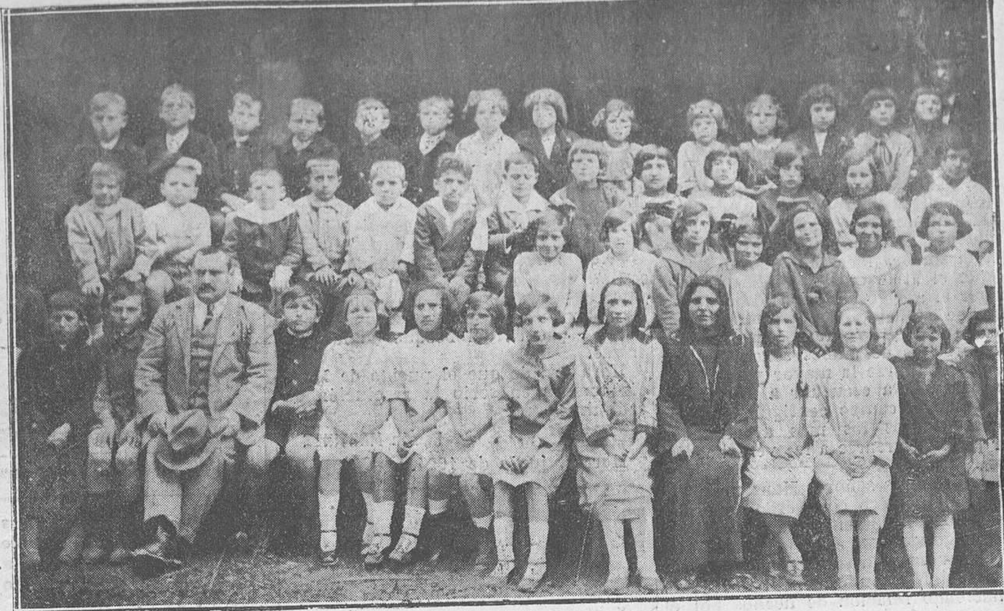
RIOSECO.--Grupo de niños de la parroquia, que el pasado jueves recibieron la primera comunión. El acto resultó edificante y solemne en extremo.