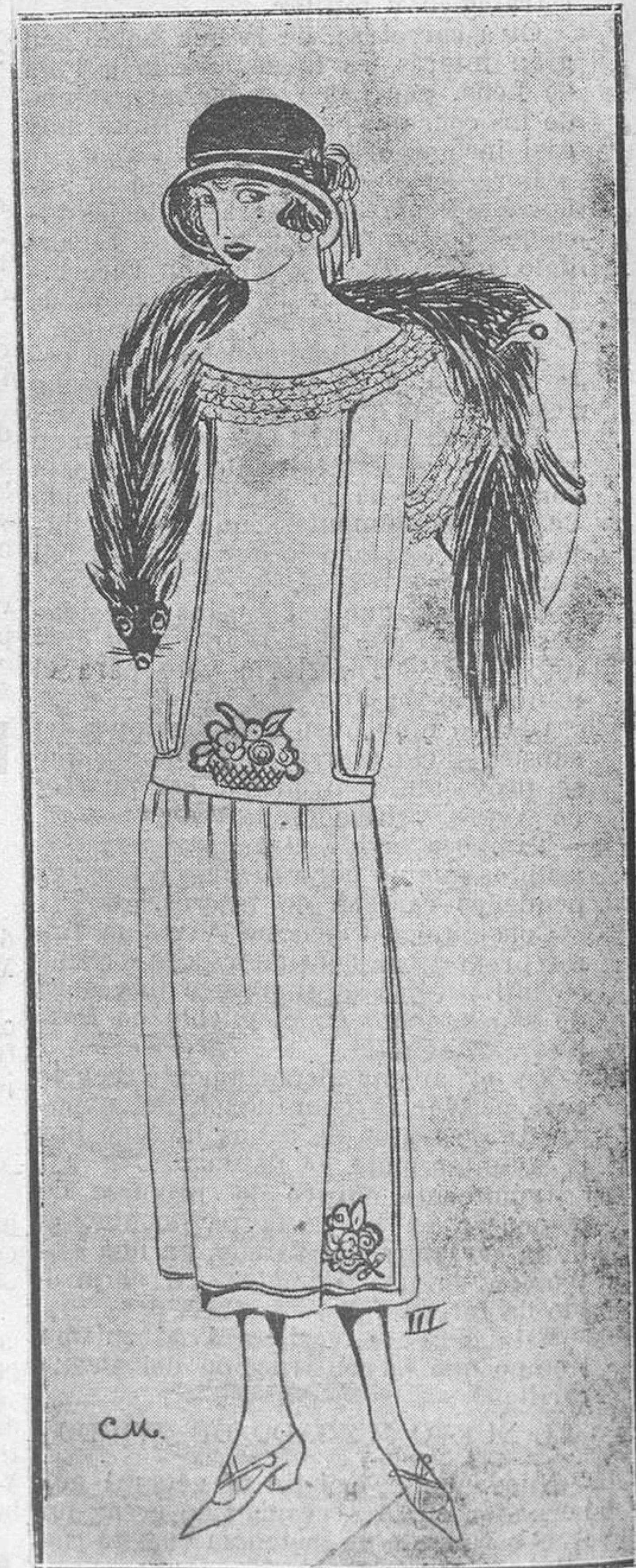
Núm. III.—Este modelito es de crespón de China verde pálido; delante lleva un delantal con peto, adornado con incrustaciones en colores de cretona de hilo. En el escote y mangas la nota juvenil de unos encajes.