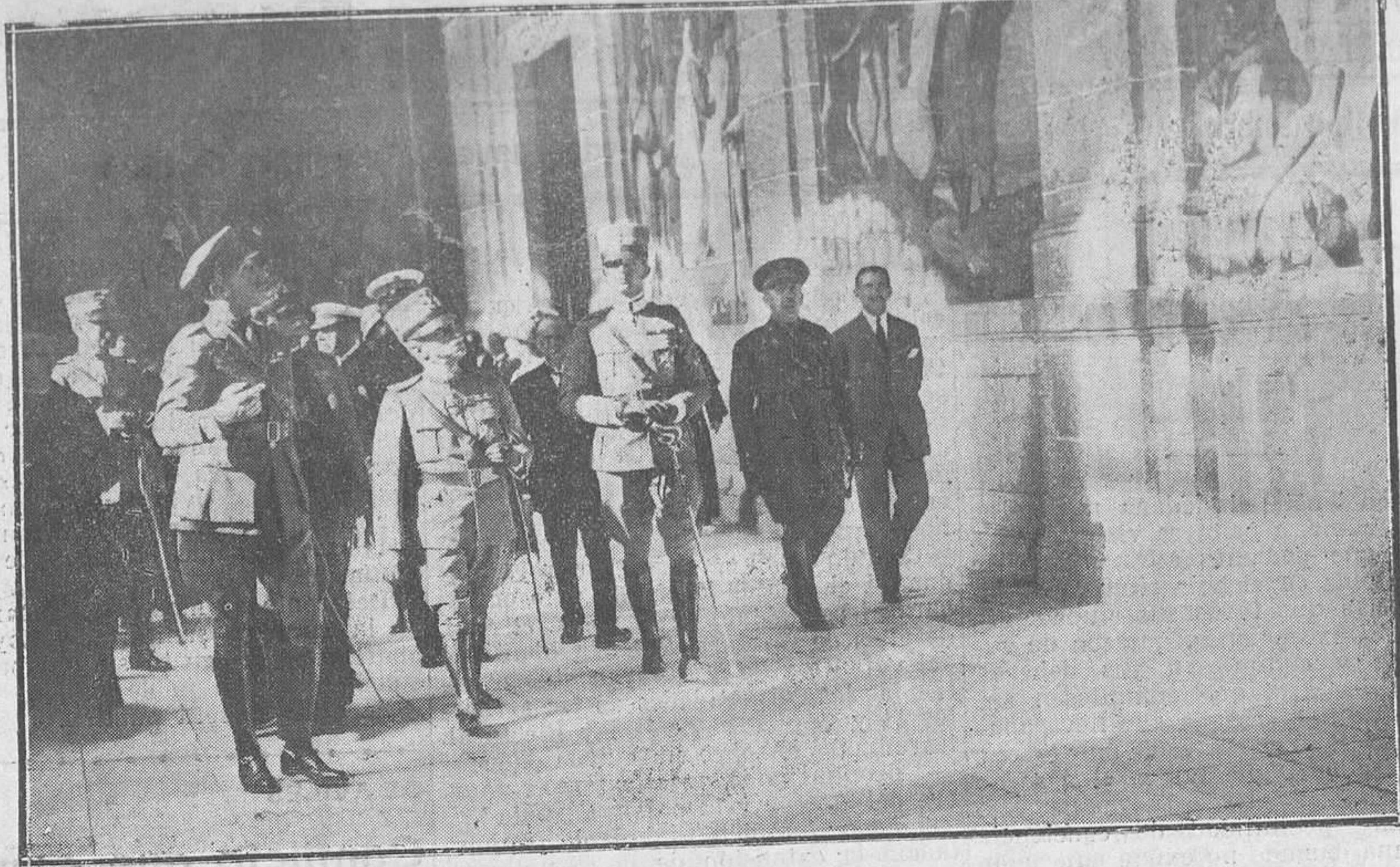
EL ESCORIAL.--SS. MM. los Reyes de España e Italia visitando los claustros del Real Monasterio de San Lorenzo.