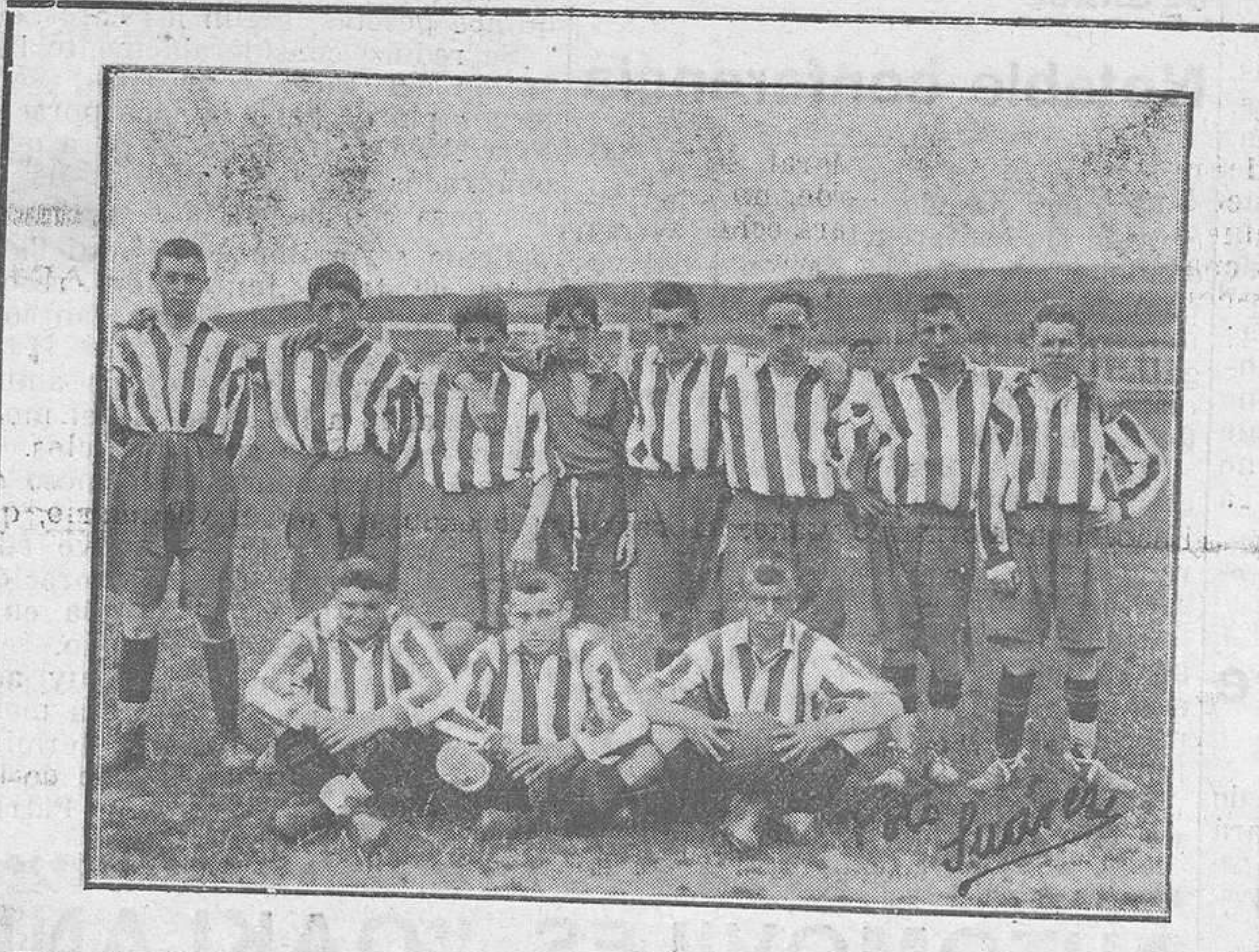
NOTA DEPORTIVA.—Equipo del Infantil Sporting, de Gijón, que salió vencedor del Infantil Deportivo, de Oviedo, por 4 a 2.

Lo que hasta la fecha no venía ocurriendo.