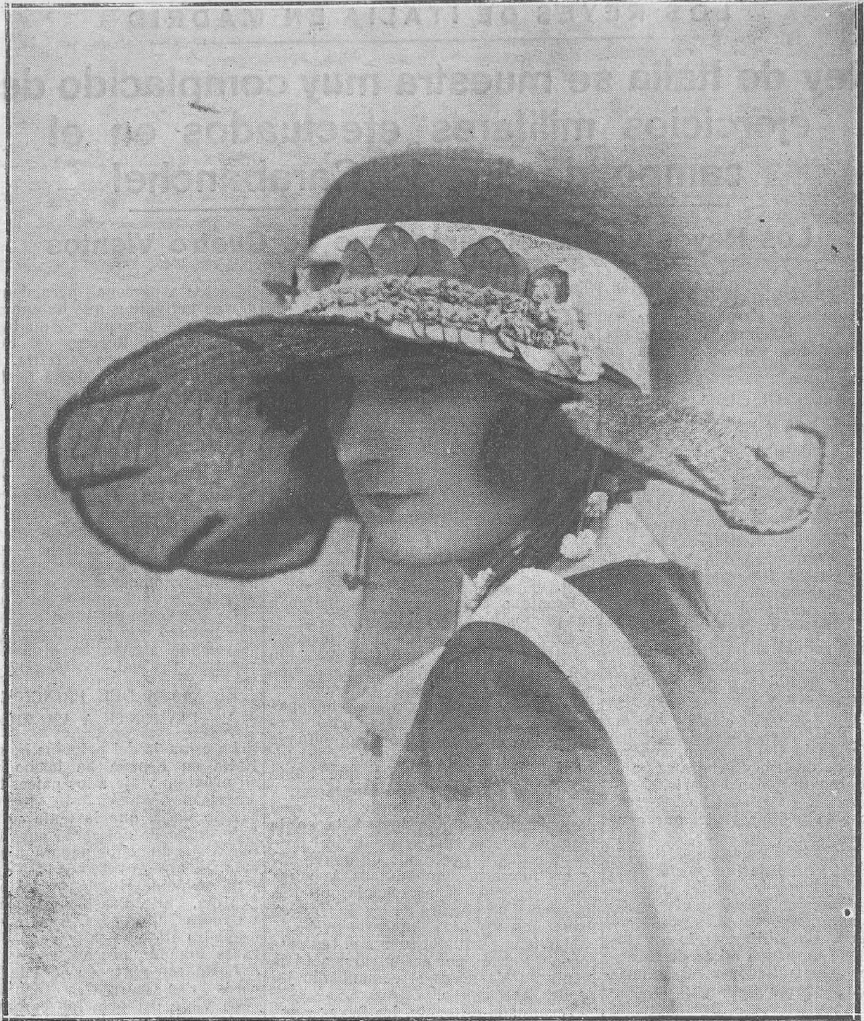
LA MODA EN PARIS.--Hermosa capellina de crin negra, guarnecida de cinta azul y de pequeñas rosas.