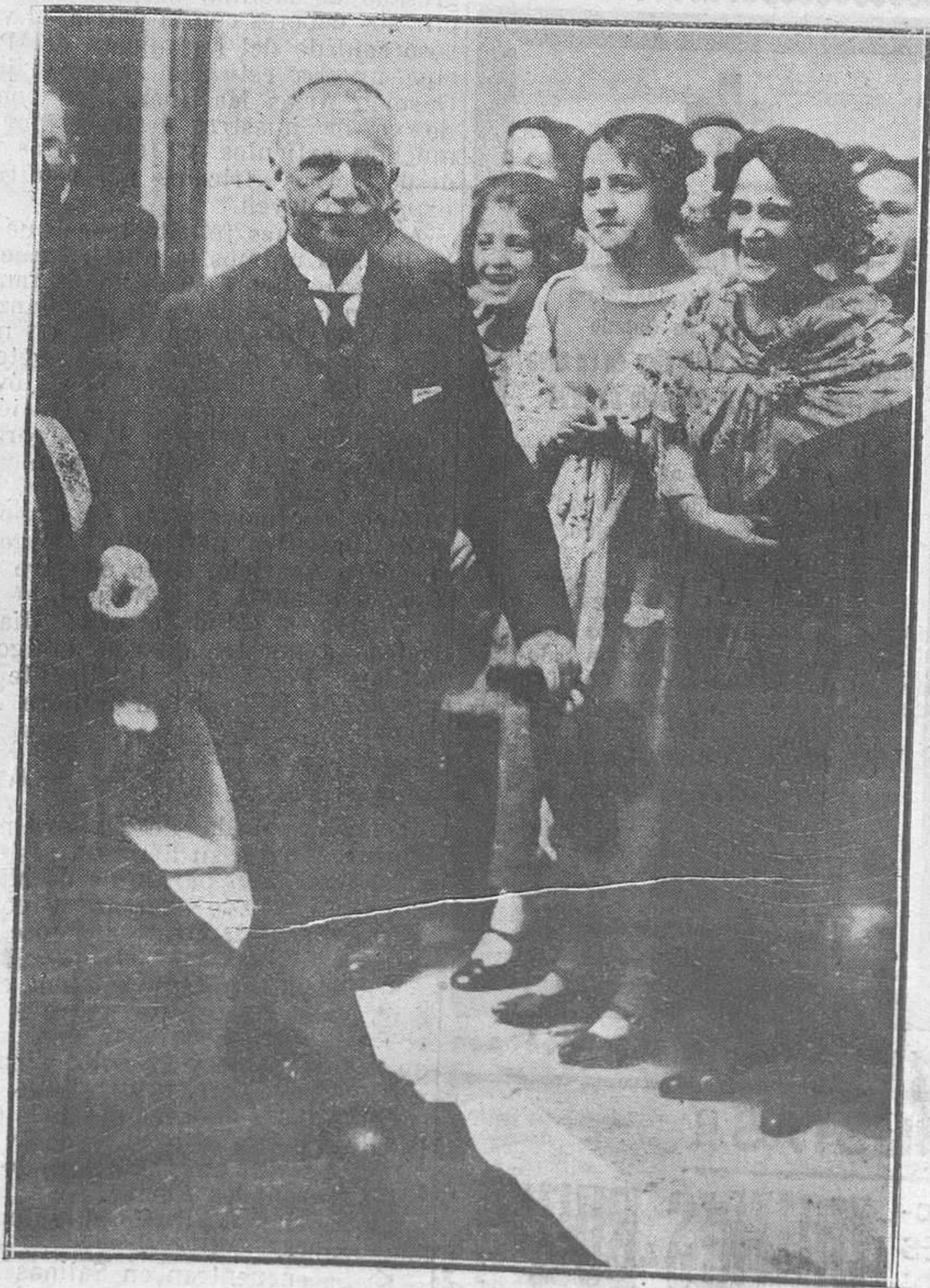
LOS REYES DE ITALIA EN MADRID.—S. M. el Rey de Italia al salir de la fábrica de tapices.

Muchos amigos son como el cuadrante solar: sólo marcan las horas en que el sol brilla.