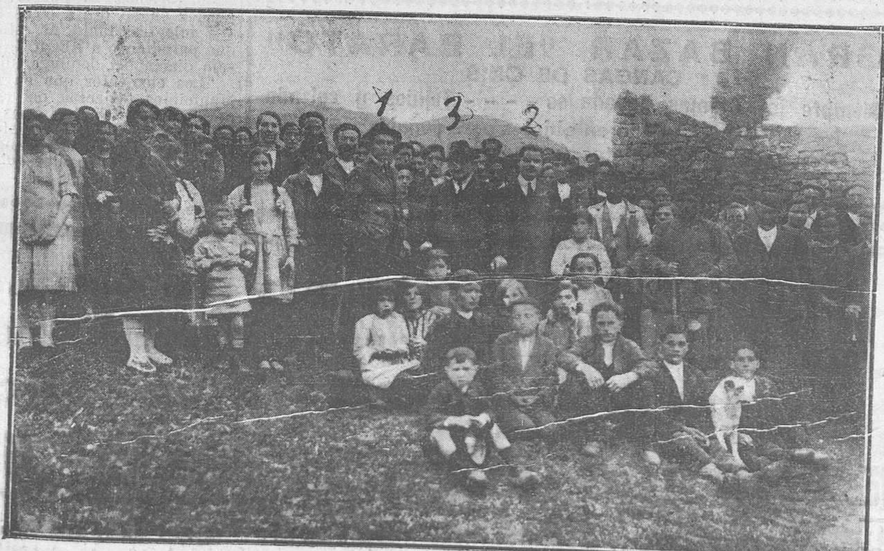
MORCÍN: ASAMBLEA AGRARIA.--(1) Señor Fidalgo, (2) señor Manzano, (3) señor maestro de la Piñera.