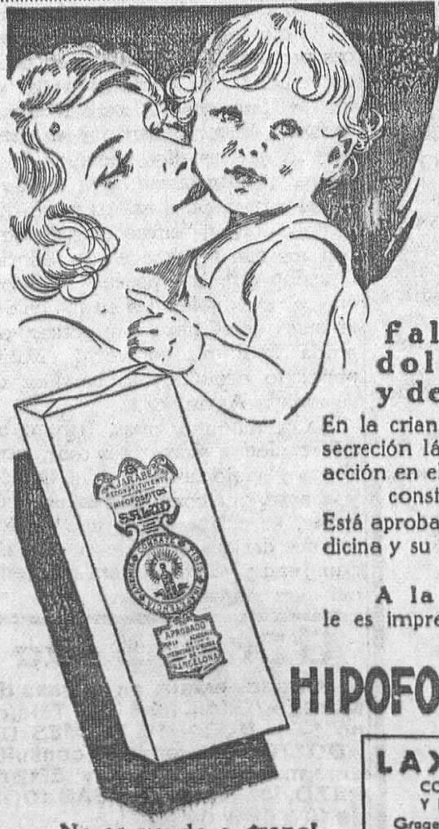
No se vende a granel