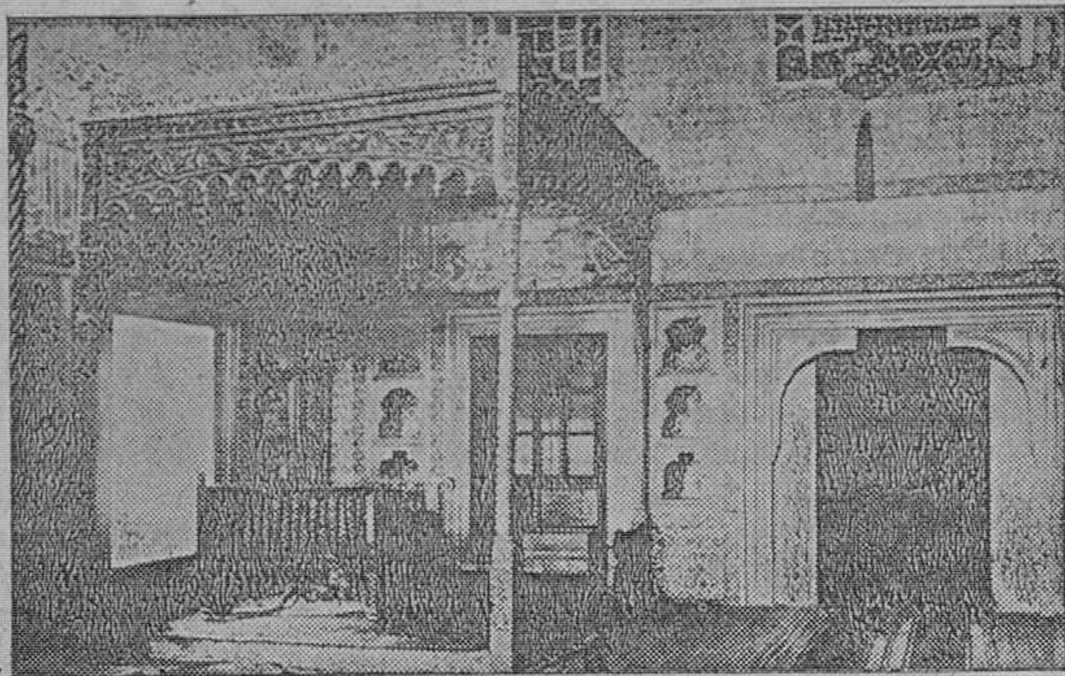
DORMITORIO DE MURAD III (SIGLO XVI)

recaudo para que a su lado no se formasen camarillas que cualquier día diesen un disgusto al Sultán.