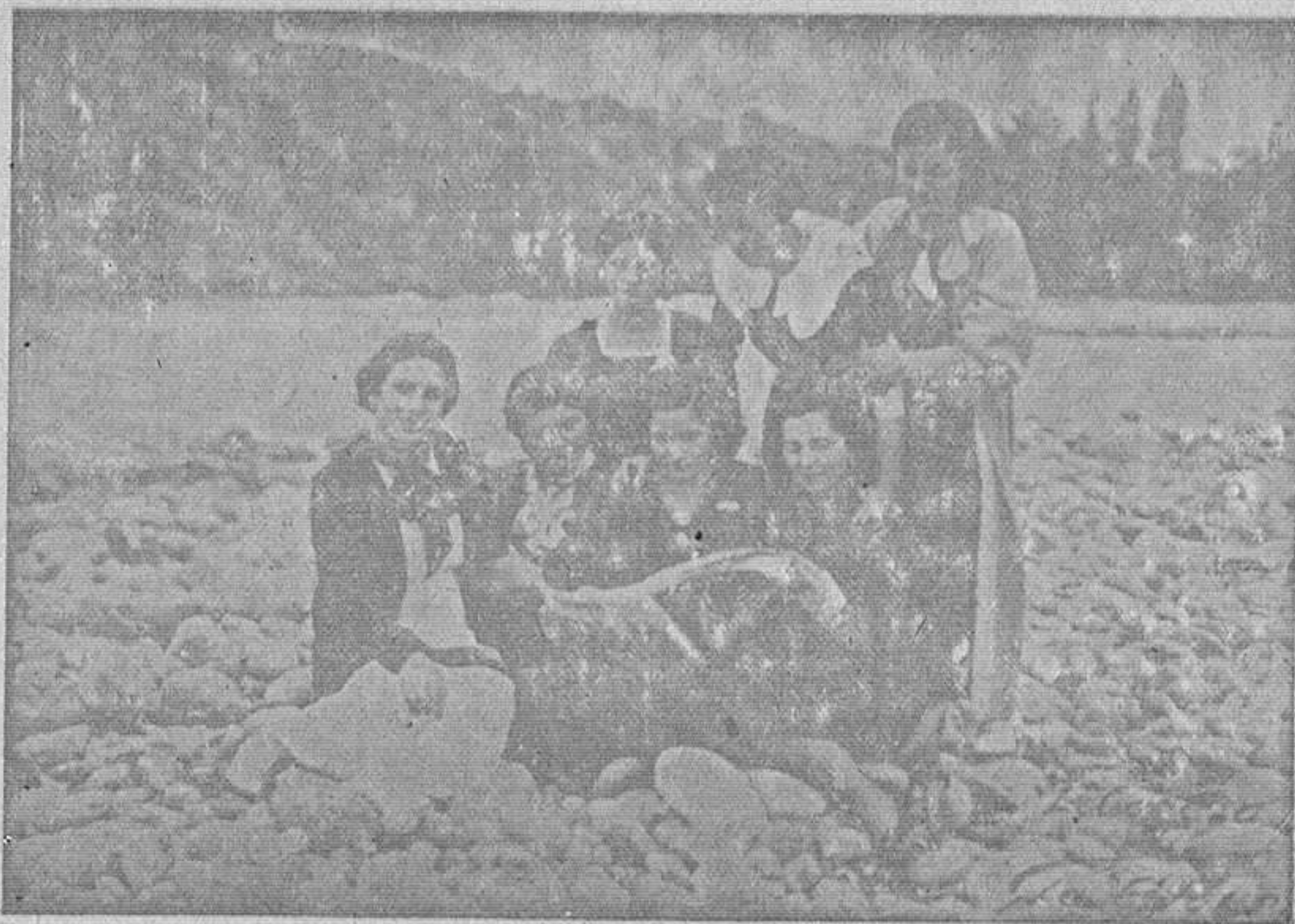
Grupo de bellas felguerinas, que en estos días recibirán el homenaje de muchos millares de asturianos a sus virtudes y a su gentileza, de lo que puede enorgullecerse el pueblo.