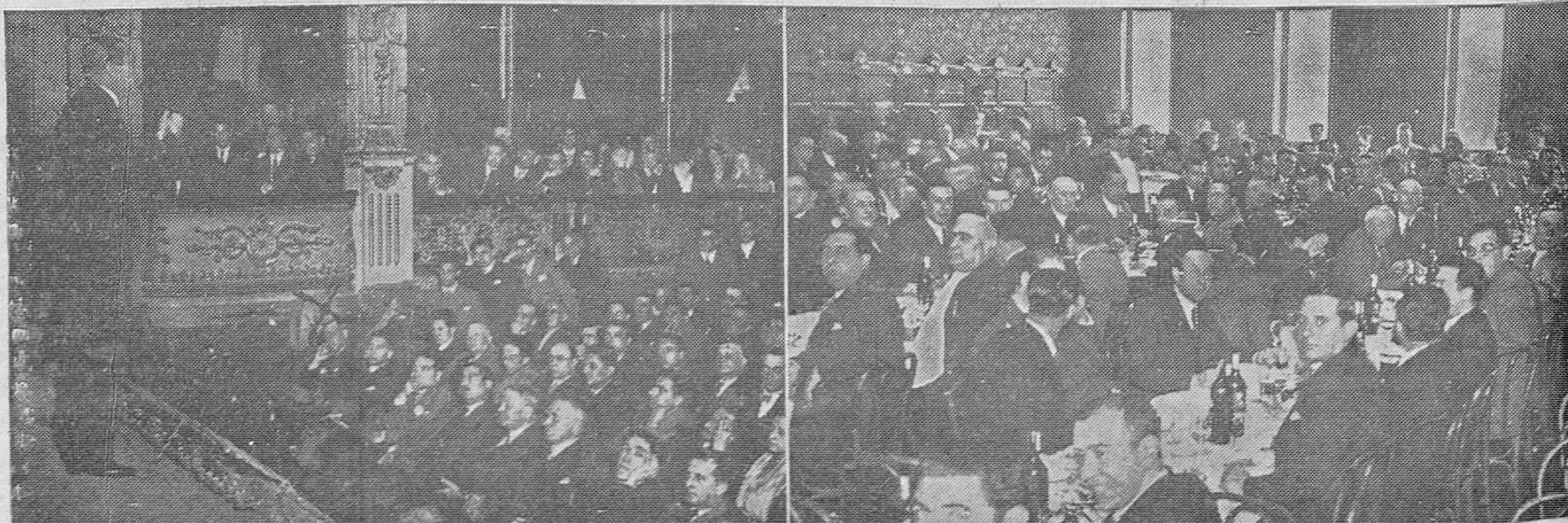
LOS ACTOS DEL DOMINGO.—Un aspecto del teatro Campoamor durante el mitin en el que pronunció su discurso político don Miguel Maura.—En relación con el mismo acto, tuvo lugar más tarde el banquete en honor del citado ex-ministro, concurriendo numerosos comensales.