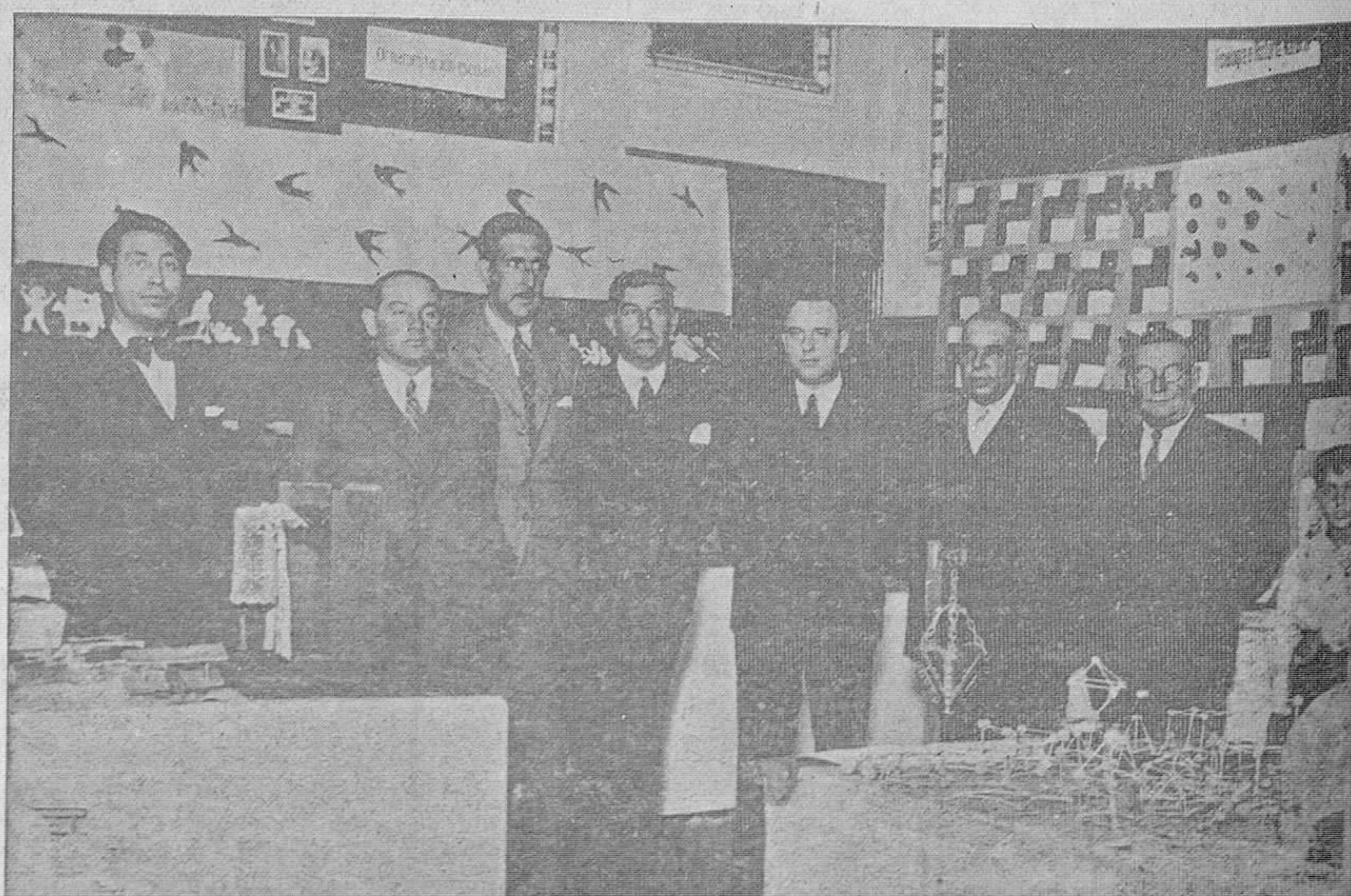
EN LA UNIVERSIDAD.—Las autoridades académicas, provinciales y locales, durante la inauguración de la interesante exposición escolar organizada por el Magisterio local y dirigida por el Inspector Jefe de Primera enseñanza