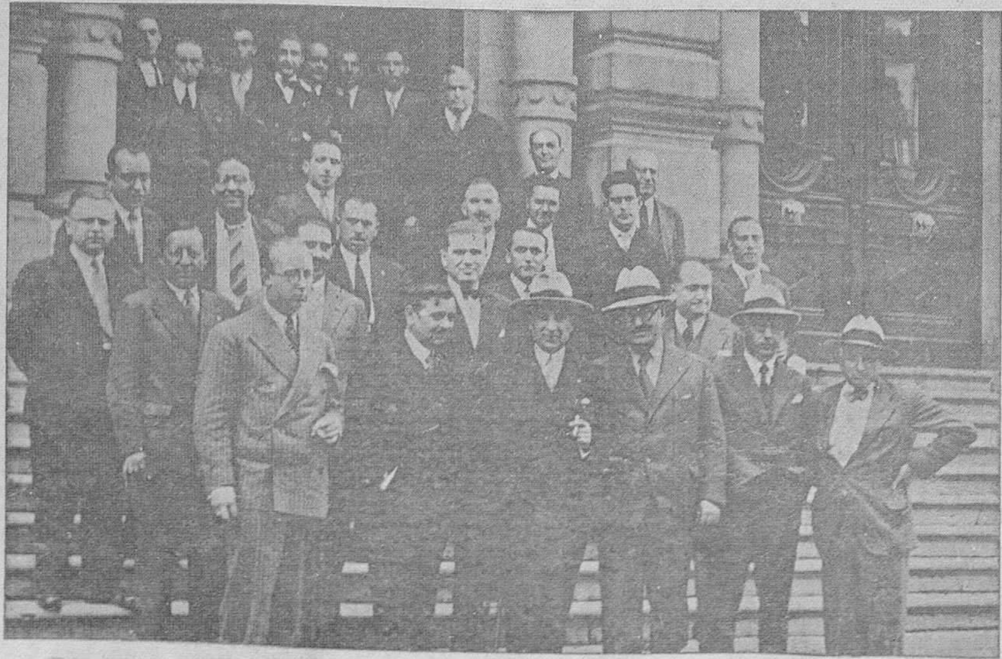
EN LA DIPUTACION.—El ministro de Justicia a la salida de la Asamblea de funcionarios municipales celebrada ayer, acompañado de las autoridades y asambleístas que le tributaron una afectuosa despedida

El señor Albornoz recibió en la Diputación a una comisión de Castrillón que le interrogó sobre el uso de la secularización de cementerios parroquiales, diciendo el ministro que ya tiene preparada una disposición, que aparecerá en 1.º de Octubre, aclarando esa cuestión.