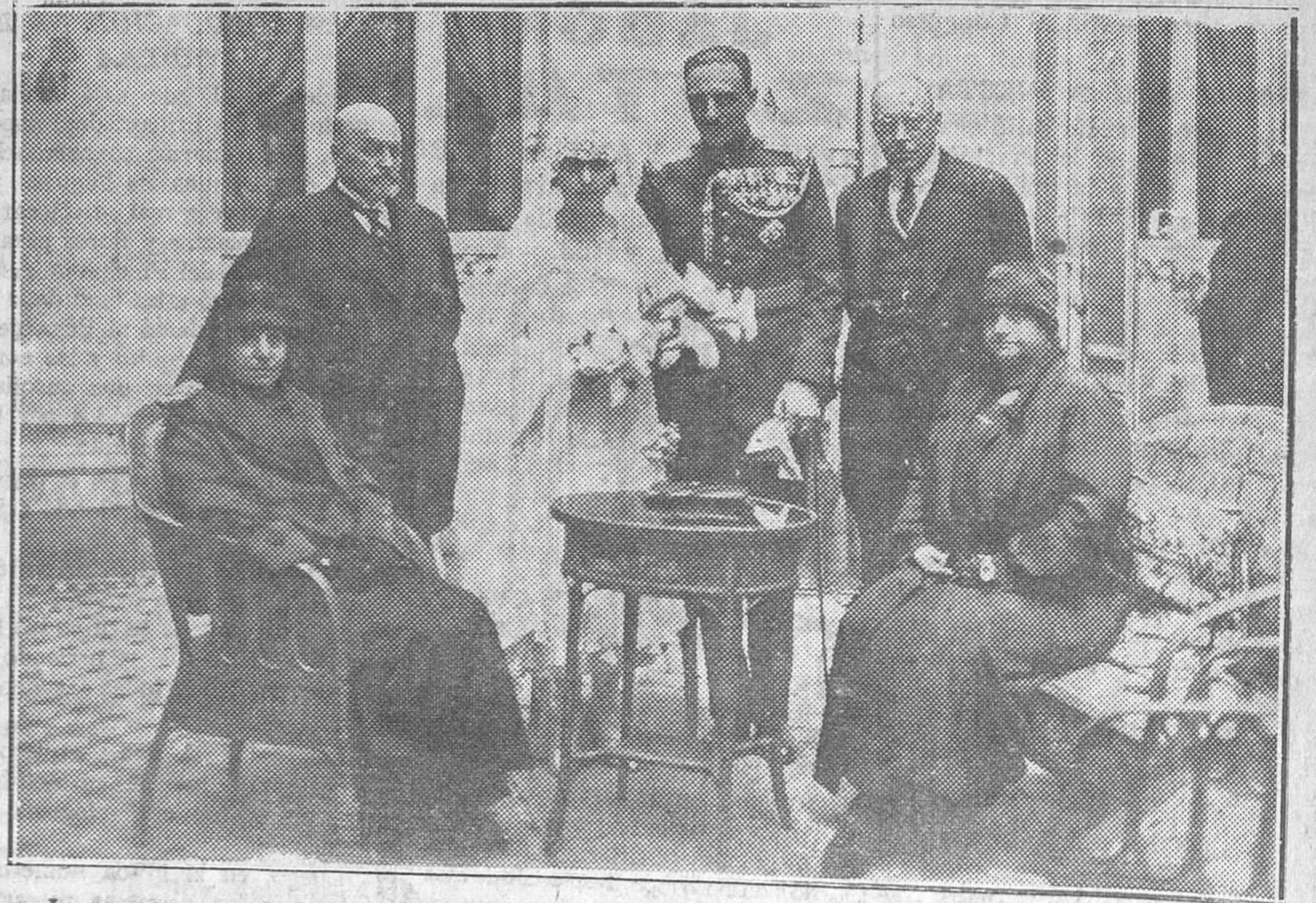
Los novios reunidos con sus padres después de la solemne ceremonia nupcial