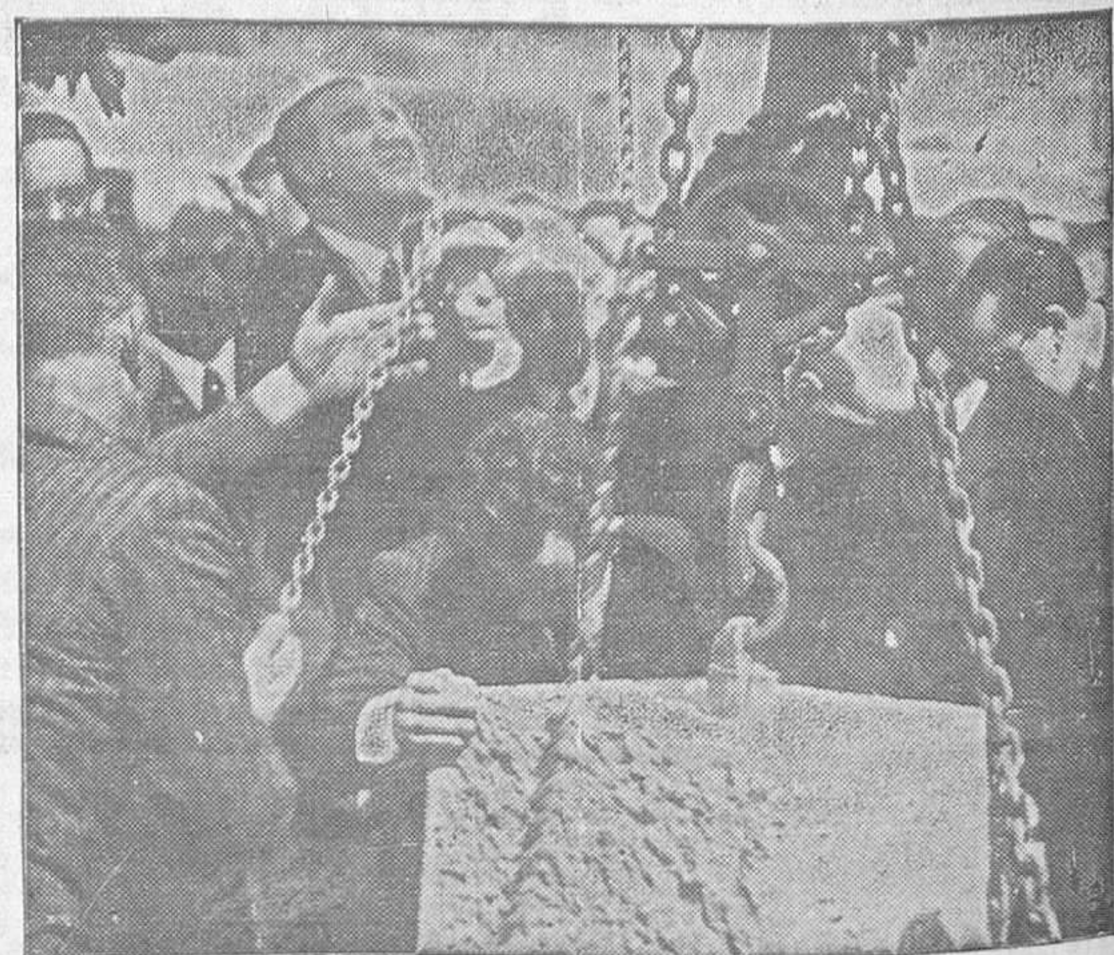
LOS ACTOS DEL DOMINGO EN AVILES. —Momento de ser colocada la primera piedra para las obras del Instituto de Segunda Enseñanza.