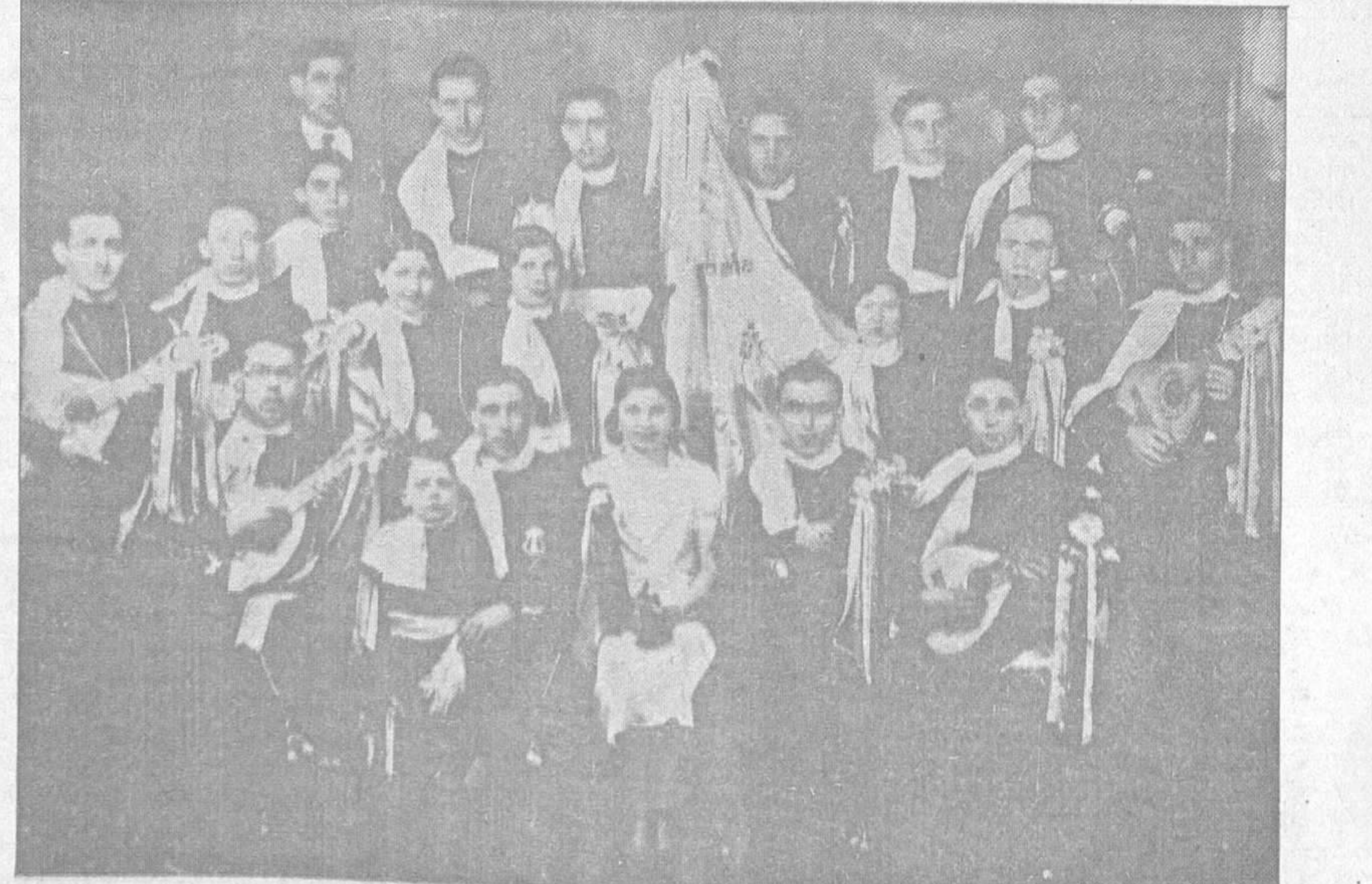
DE LOS CARNAVALES.-La Agrupación artística ovetense, "Rondalla Ilusión", formada por varios jóvenes obreros y que constituye una de las notas más destacadas del Carnaval.