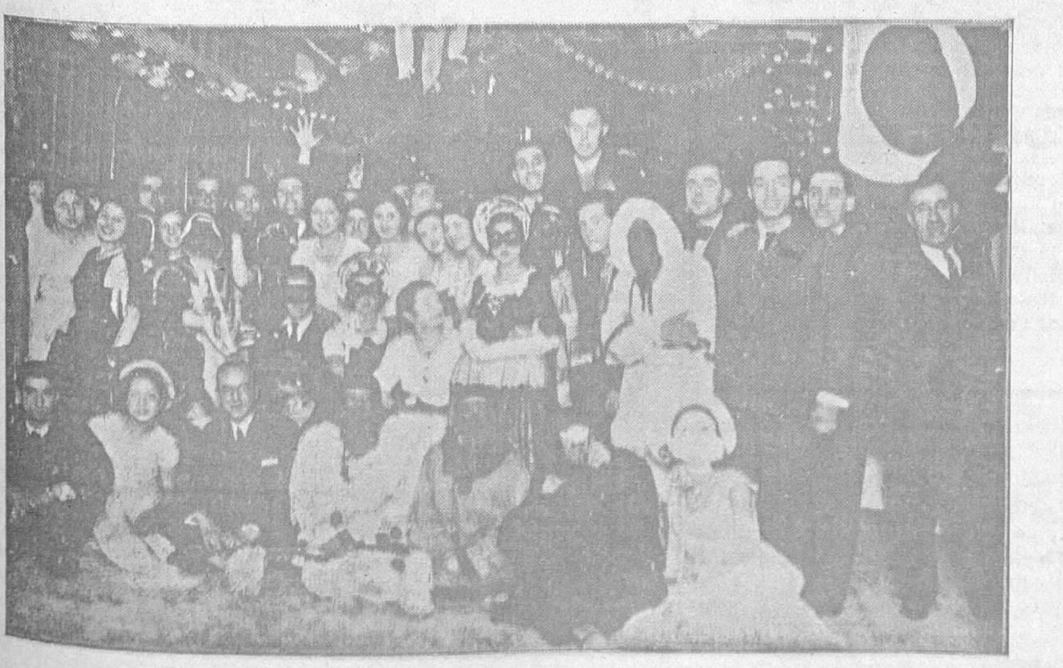
LOS CARNAVALES.-Como en años anteriores, es en las Sociedades donde se celebra el Carnaval.-La foto es de un grupo formado en los Salones de la Delegación del Centro Asturiano de la Habana

Los salones de baile estuvieron animadísimos, siendo de todo punto impo-