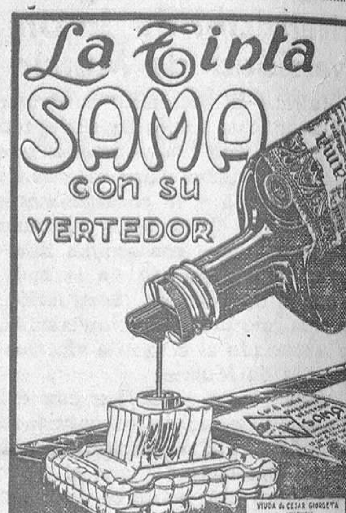
La mejor para Estilográficas DE VENTA EN LAS BUENAS PAPELERIA

Esta reunión, oficiosa, tendrá, sin embargo, repercusiones oficiales, puesto que, si hubiera unanimidad en los acuerdos, no sería difícil que los delegados se entrevistaran con la Nacional para hacerla partícipe de los acuerdos.