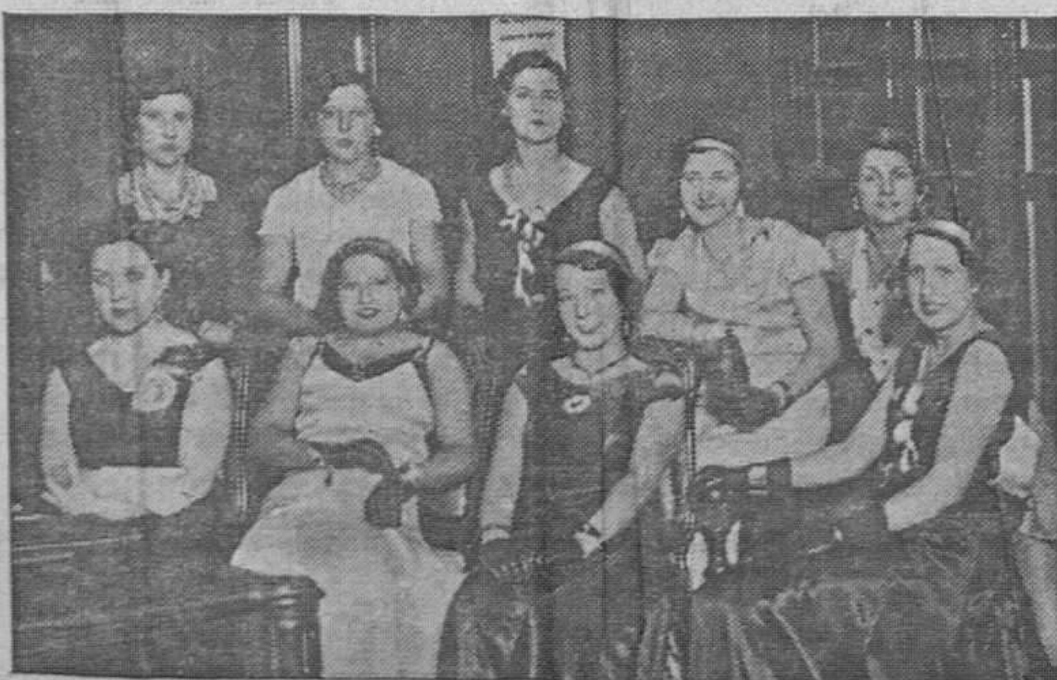
EN EL ORFEON OVETENSE.—Grupo de bellas señoritas de las muchas que han asistido a las recientes fiestas