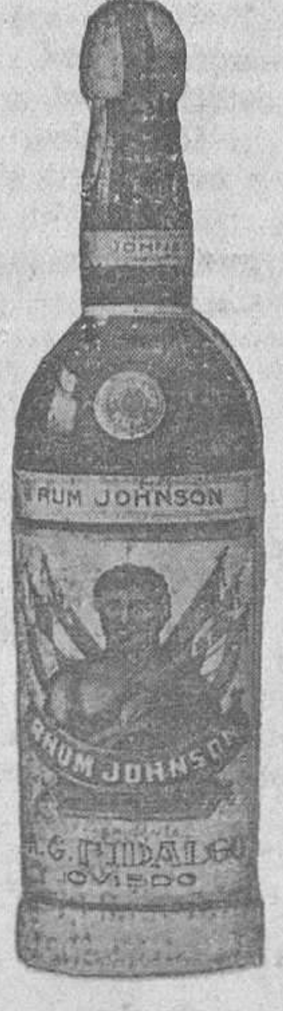
Fabricante: A. G. HIDALGO-OVIEDO

A las personas comprensivas, de verdadera solvencia moral y económica nos permitimos recordarles que se acerca la Fiesta de los niños, fiesta de dulces ensueños y emociones que las familias procuran conservar. En la Casa grande también se sienten estas mismas inquietudes y es deber nuestro contribuir a satisfacerlas supliendo en lo posible los efectos paternales de que están privados estos niños. No quiere esto decir que la Diputación se inhiba de tales obligaciones, antes bien las cumple muy gustosa por cuantos medios están a su alcance, pero queremos asociar a nuestro noble empeño la acción popular, no por la cuantía del apoyo material que aquella puede ofrecernos, sino por la influencia que ejerce indudablemente en el orden social y educativo. Aquí tenemos 800 niños que algún día habrán de incorporarse a la vida social y quisiéramos que al hacerlo llevaran un grato recuerdo de todos por los beneficios recibidos. A los que puedan favorecerles con el envío de algunos juguetes, se lo agradecerán en nombre propio y de los agraciados el diputado visitador y el director de la Residencia Provincial de Niños.