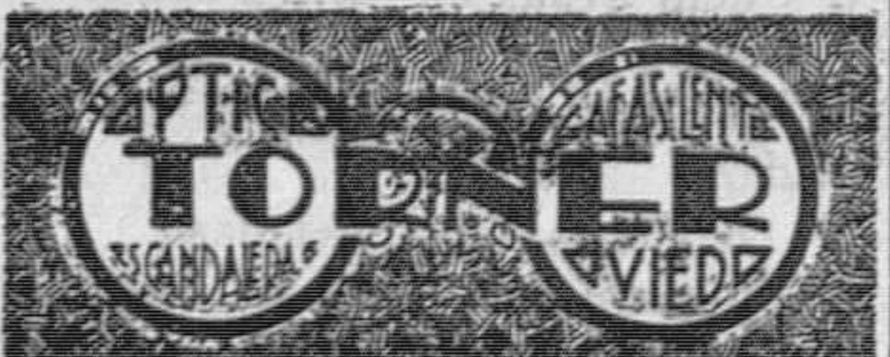
Despacho recetas de Sres. oculistas.

Trapos lavados grandes se compran en este periódico