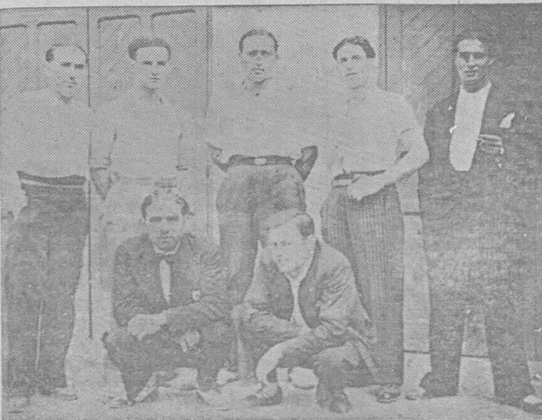
TURON.-La directiva de las fiestas que se celebraron este año con la mayor brillantez en honor de Nuestra Señora del Carmen, está recibiendo muchas felicitaciones. He aquí a los jóvenes componentes de la misma.

Medicinal y de tocador. Hermosa el cutis.