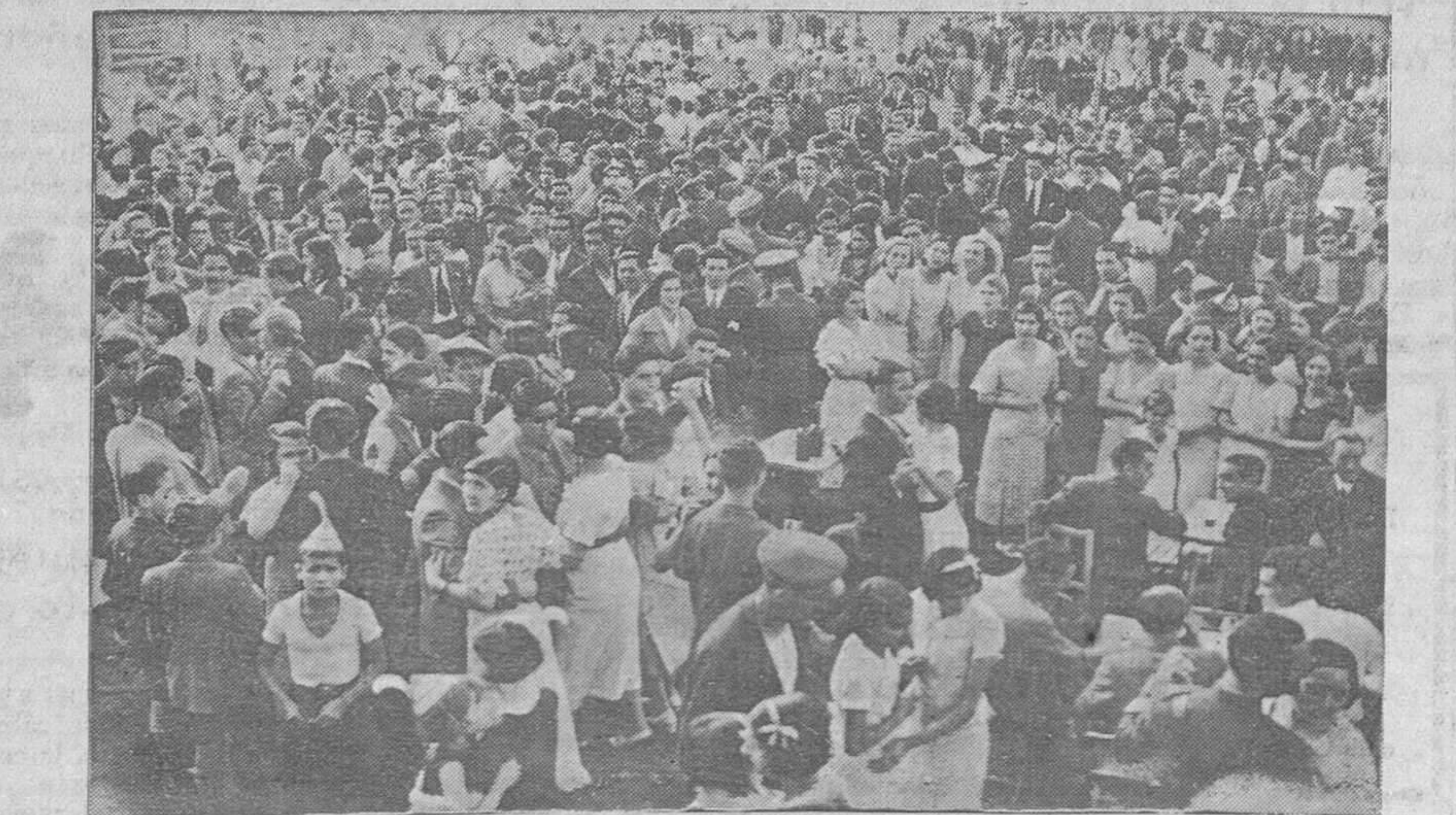
EN EL PARK OVETENSE.—Un aspecto del lugar donde se efectuó la romería con motivo de la fiesta organizada por la Colonia gallega

Todos los heridos ingresaron en el Hospital de Santa Coloma de Queralt.