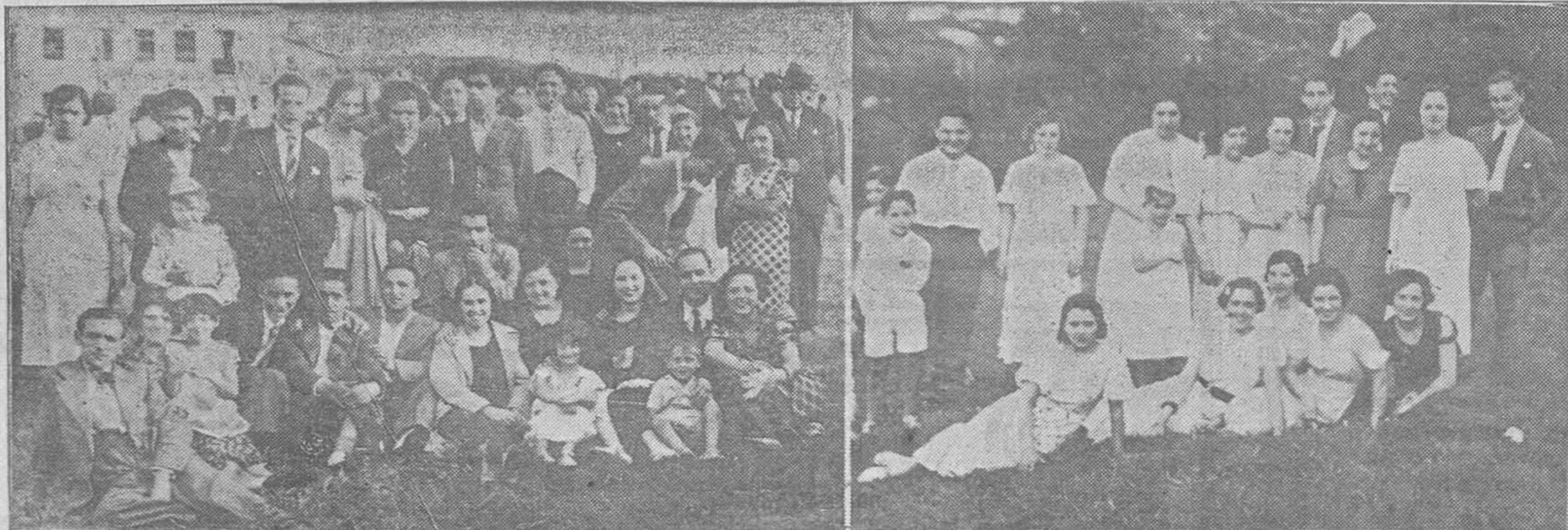
DE LA FIESTA DE AYER.—Grupos de asistentes a la romería que, organizada por el Centro Gallego de esta capital, se celebró con extraordinario éxito en el Park Ovetense

Cada duro que ahorra un empleado o un obrero le coloca en nivel superior a los ojos de sus jefes; acorta la distancia que de ellos le separa, aumentando su independencia, haciéndole menos esclavo de las circunstancias y poniéndole en el camino de llegar a establecerse por sí mismo.