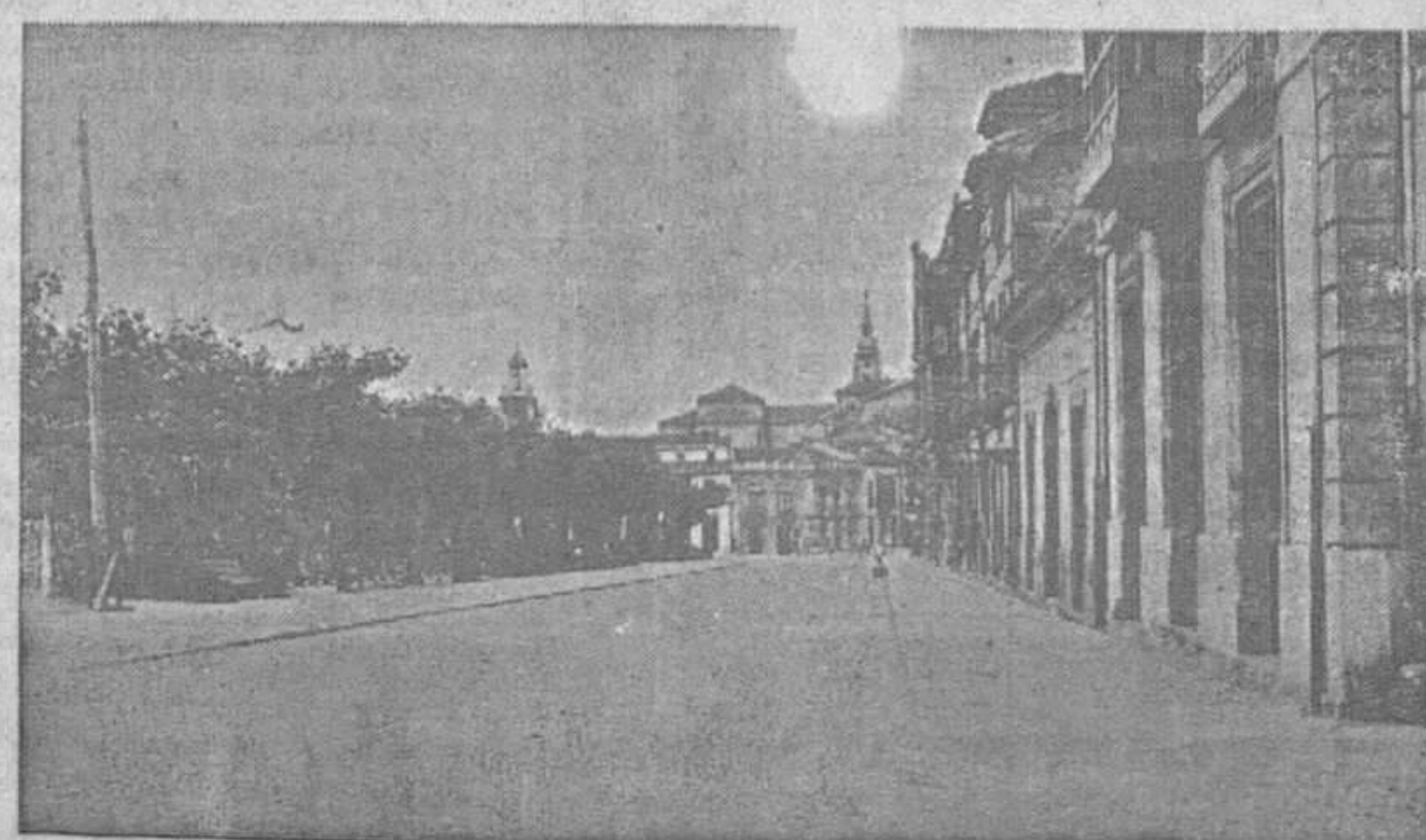
POLA DE SIERO.- Calle de Florencio Rodríguez

SALON DE BELLEZA FLORENTINA SUAREZ Ondulación Permanente Ondas al agua Corte de pelo Manicura Plaza del Cabo Noval POLA DE SIERO