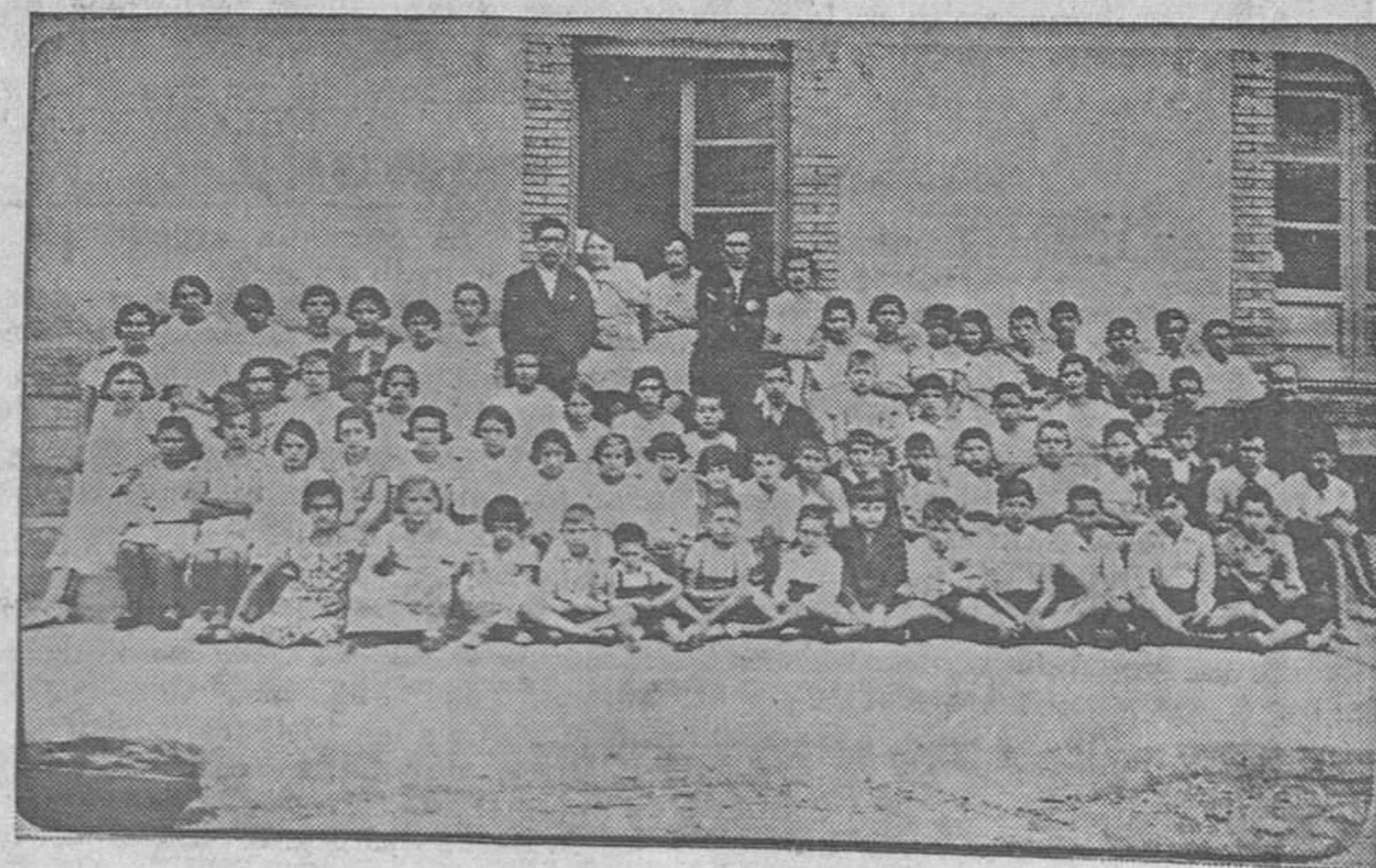
Primer grupo de la colonia escolar de altura de los Ayuntamientos de Langreo y San Martín del Rey Aurelio, que veranea en Vegacervera (León).

Persisten en su actitud en el interior de los mismos unos cincuenta obreros.