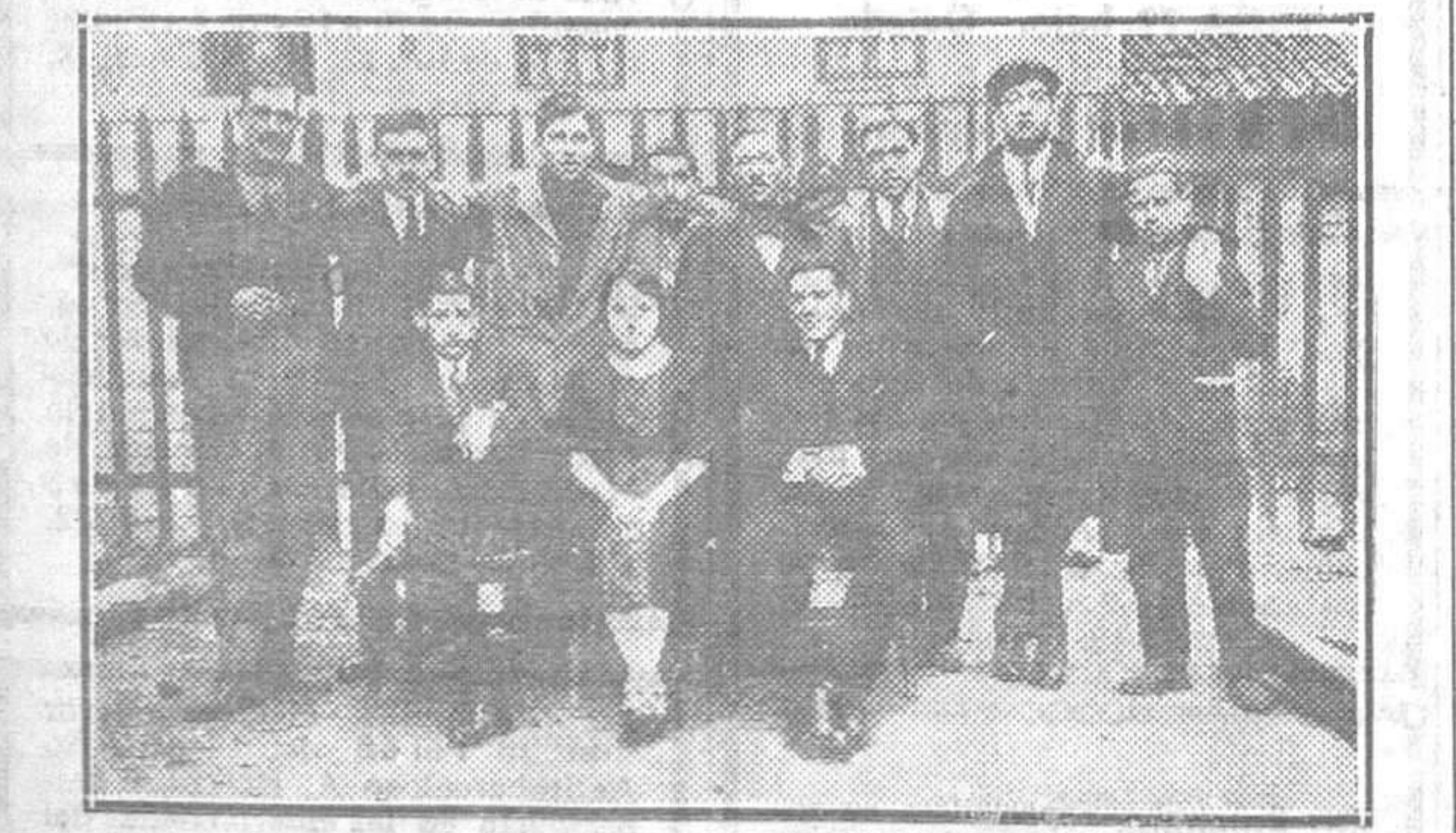
MIERES.—Cuadro artístico integrado por jóvenes ferroviarios que en la velada teatral organizada a beneficio del Colegio de niños huérfanos y Montepío ferroviario, han obtenido un gran éxito