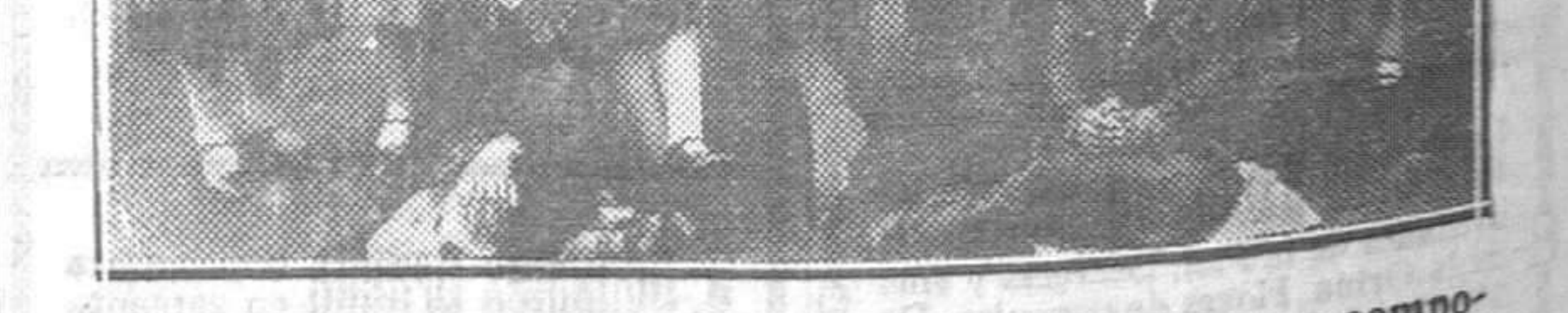
MIERES.—Grupo de bellas y distinguidas señoritas que componen el cuadro artístico de "Las Imeldas", y que el próximo día 18 darán en el Colegio de los HH. Dominicos una función benéfica