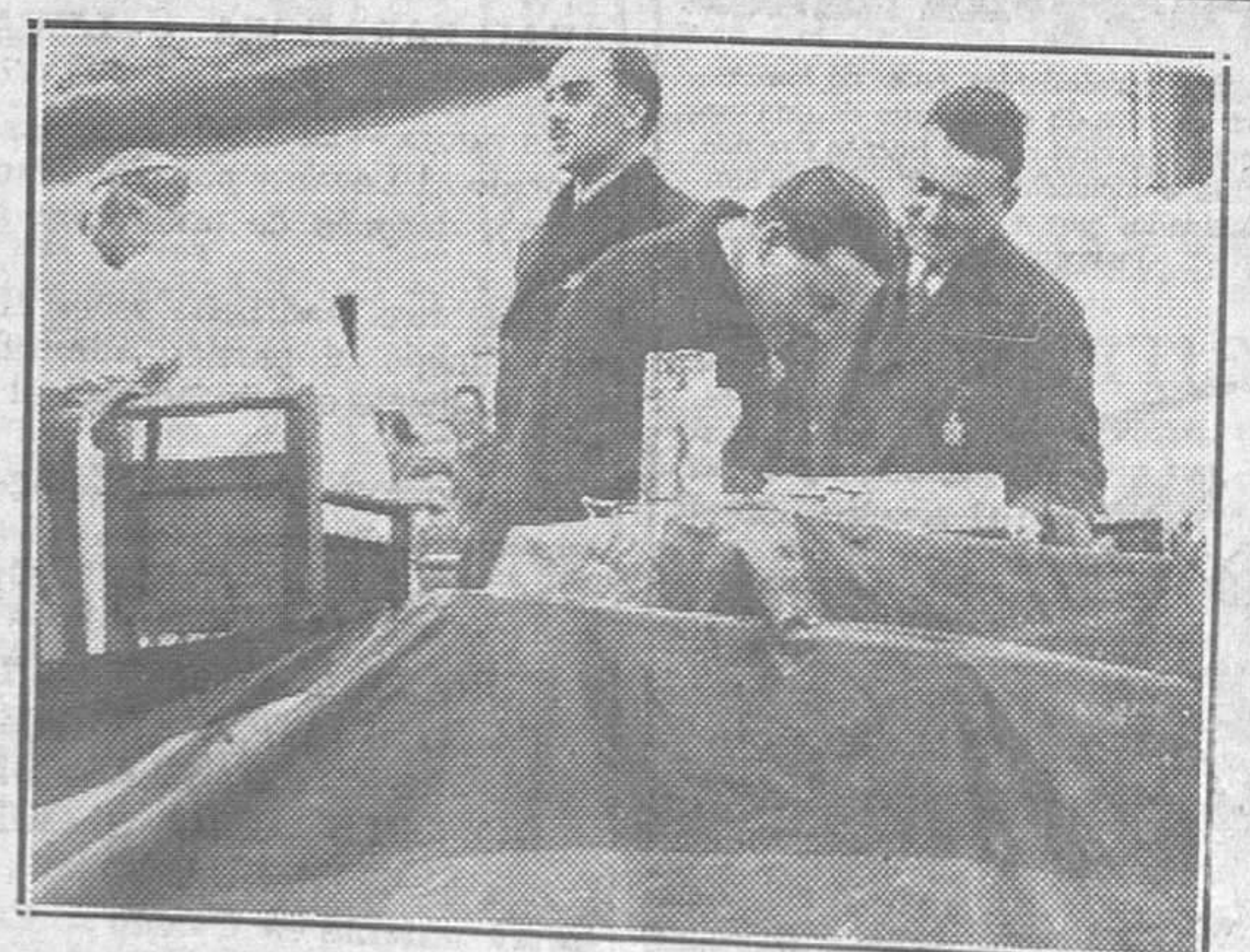
POSADA DE LLANERA.—Los gobernadores civil y militar firman el acta de colocación de la primera piedra de la Plaza Cubierta