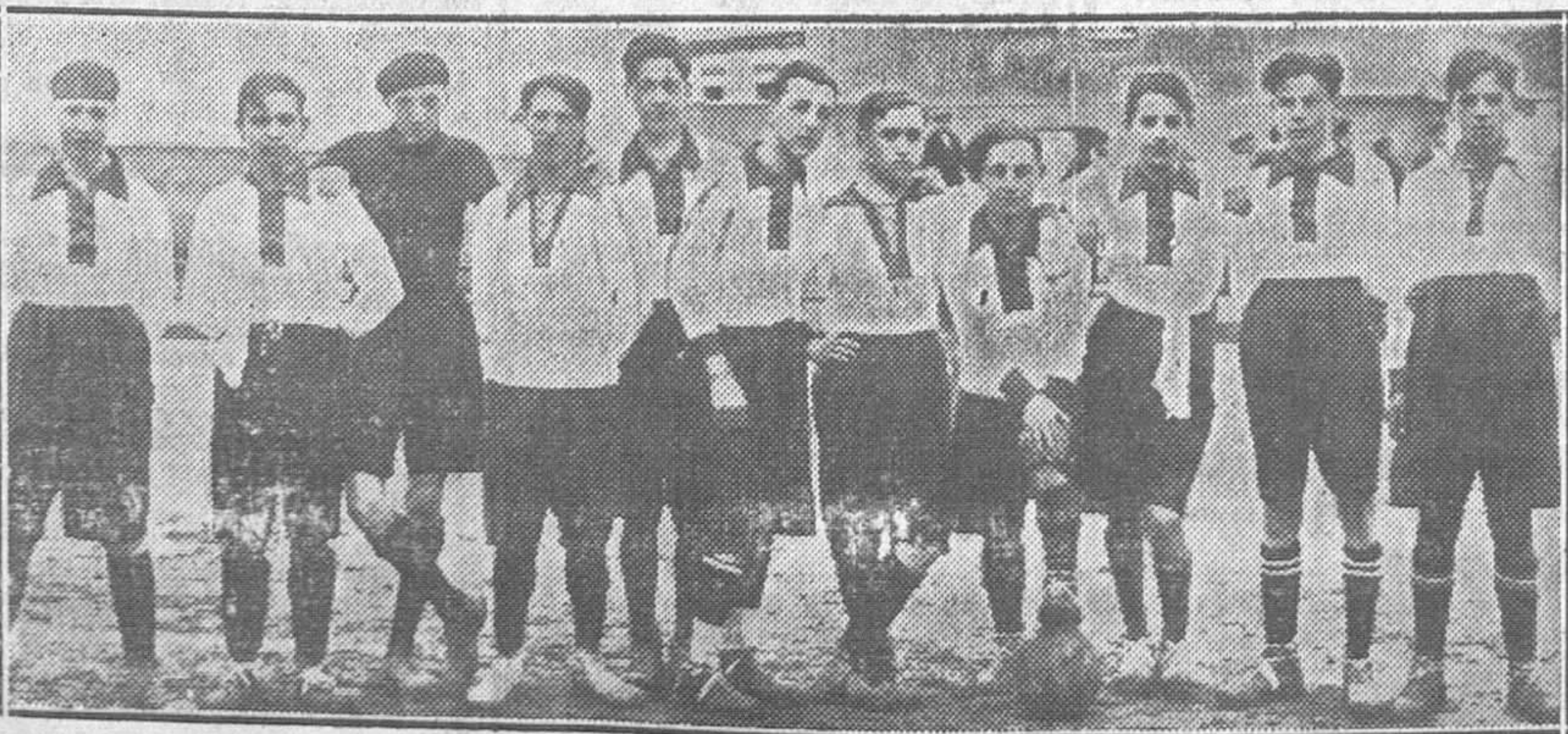
El Príncipe de Asturias, vencido por el Celta

Madrid.—En el orden de la plaza de hoy se dispone se conceda licencia cuatrimestral a los quintos de 1923. El permiso lo disfrutarán desde el lunes próximo.