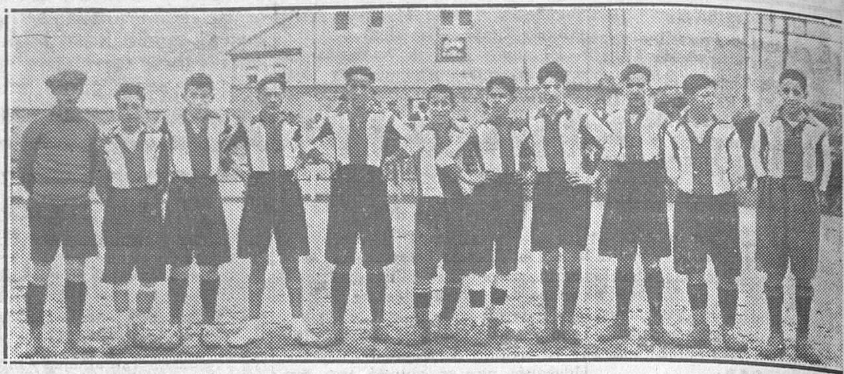
Club Celta Ovetense, vencedor por cuatro a cero