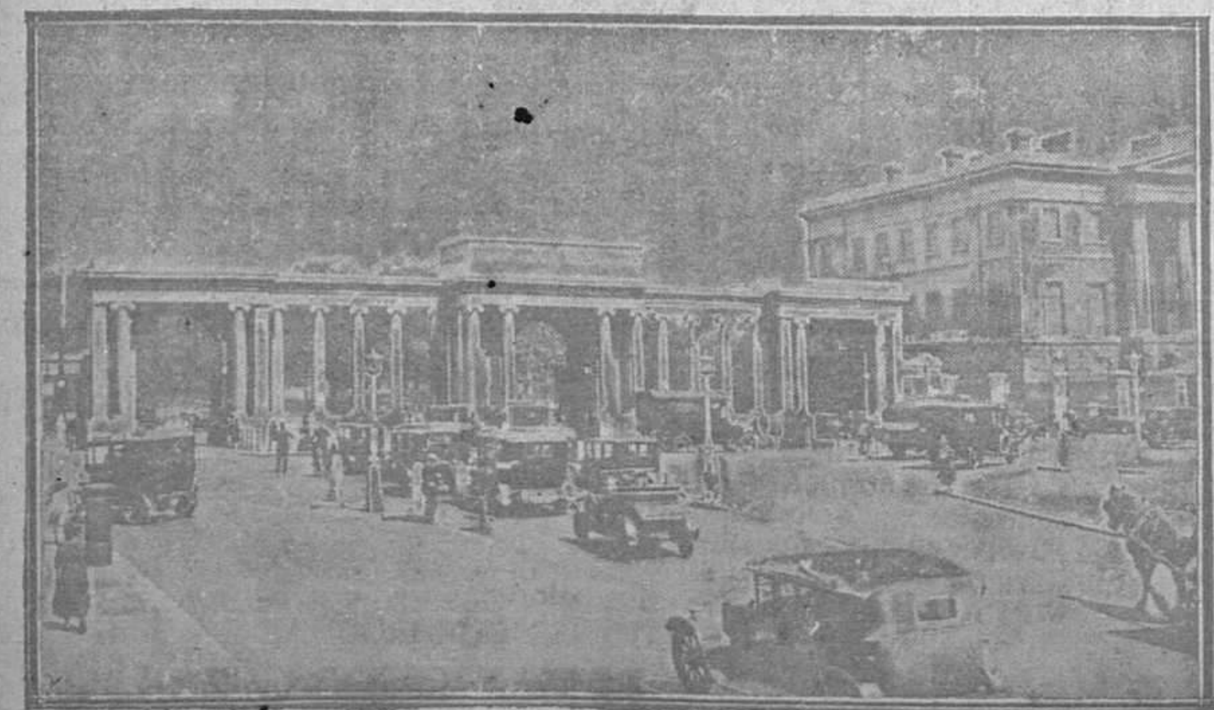
LONDRES.—La entrada de Hyde Park