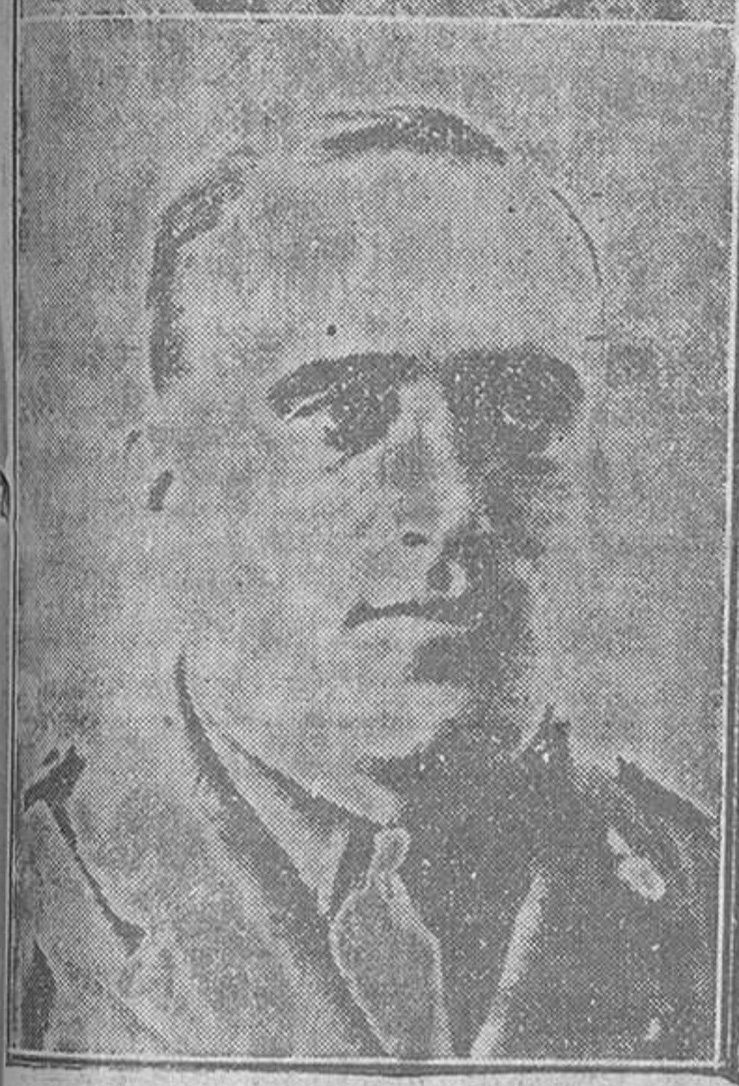
Los comandantes Franco y Ruiz de Alda, un día vencedores del Atlántico en su famoso "Plus Ultra", y por cuya suerte se teme ahora fundamentalmente al intentar el doble vuelo España-Nueva York.