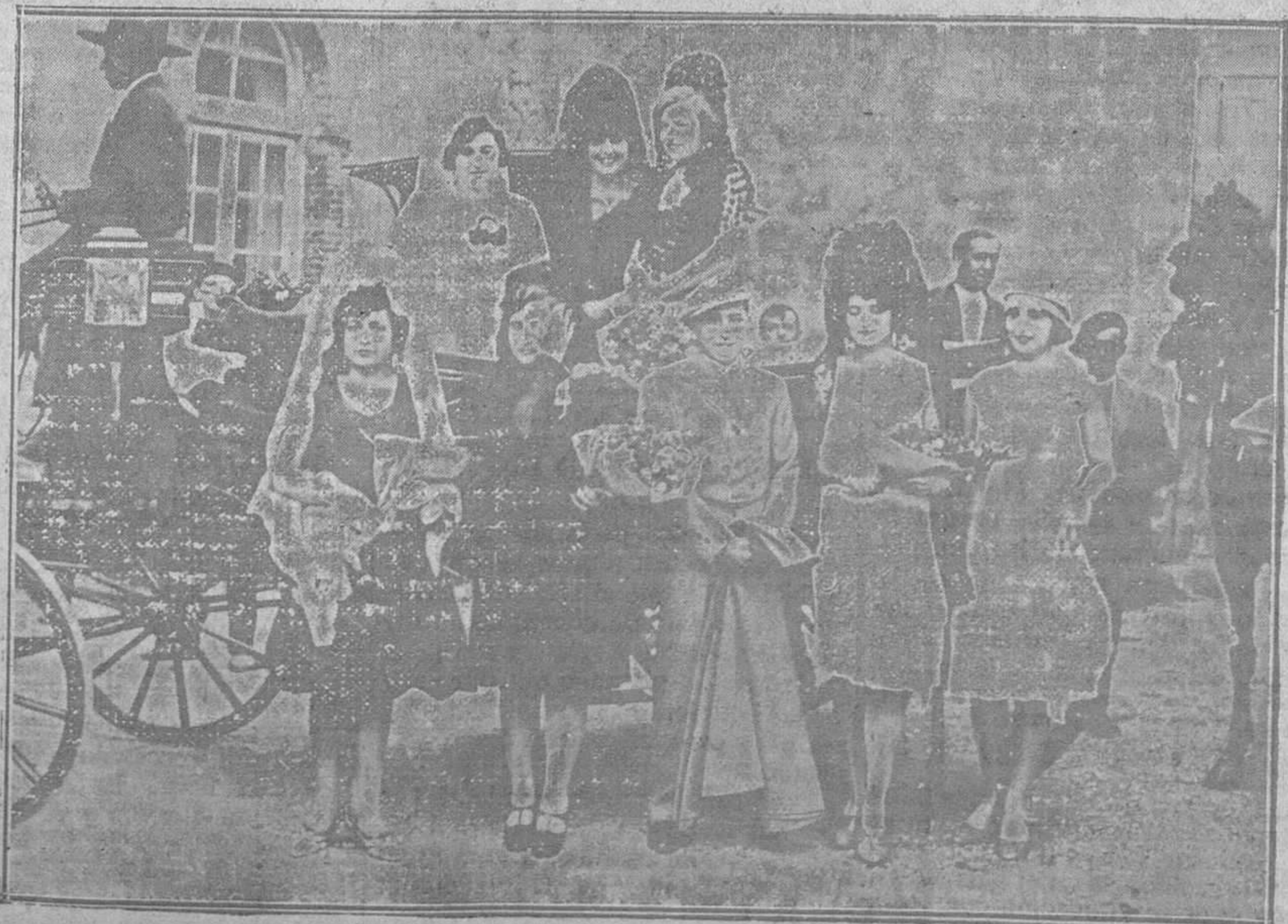
EL DOMINGO EN BUENAVISTA.—El grupo de bellísimas señoritas presidentas del festival taurino de los ferroviarios, que acaparan los aplausos y los piropos del respetable, acompañadas del matador de toros «Clásico»

La denuncia fué cursada al Juzgado correspondiente, que será el encargado de decir a quién pertenece el niño que se disputan sus familiares.