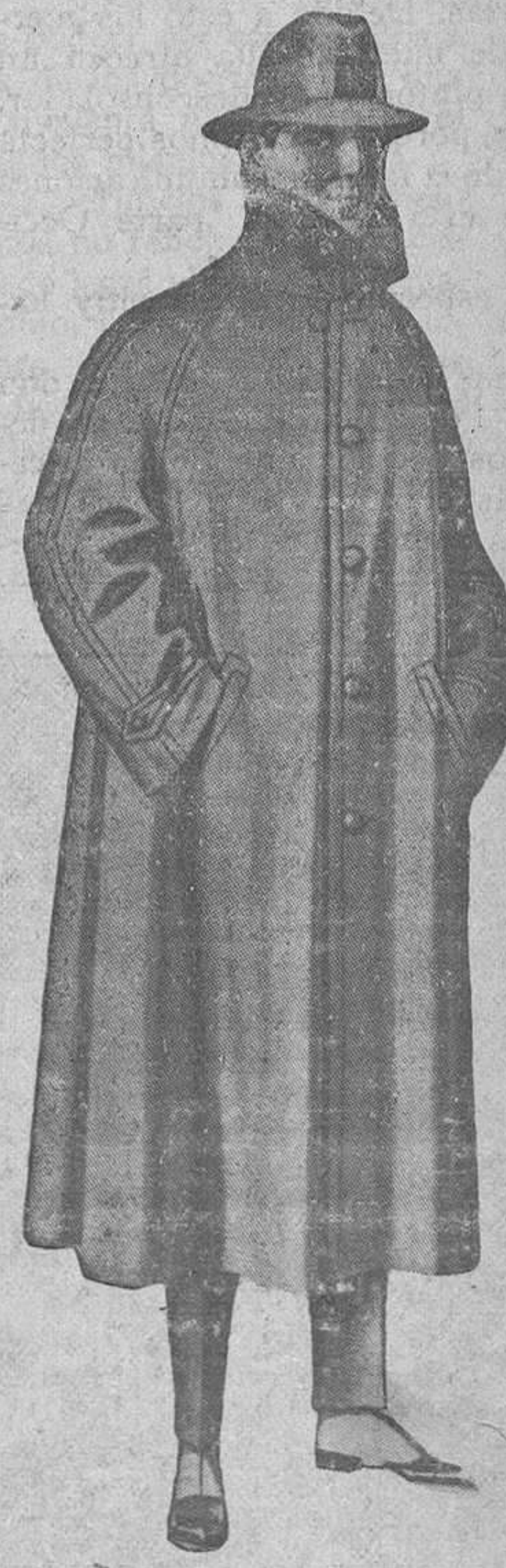
IMPERMEABLE hule negro o color, distintos modelos, muy práctico.