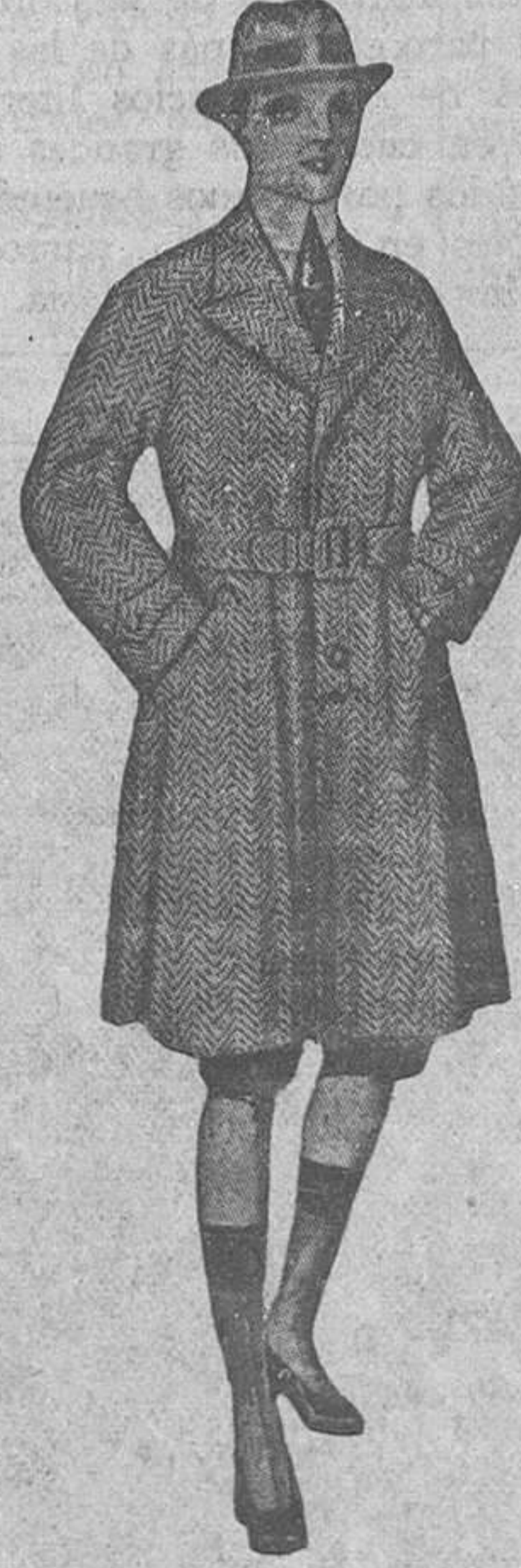
GABANCITO niño, recto, con o sin cinturón, muy sport, en cheviót de lana; para 12 o 14 años.