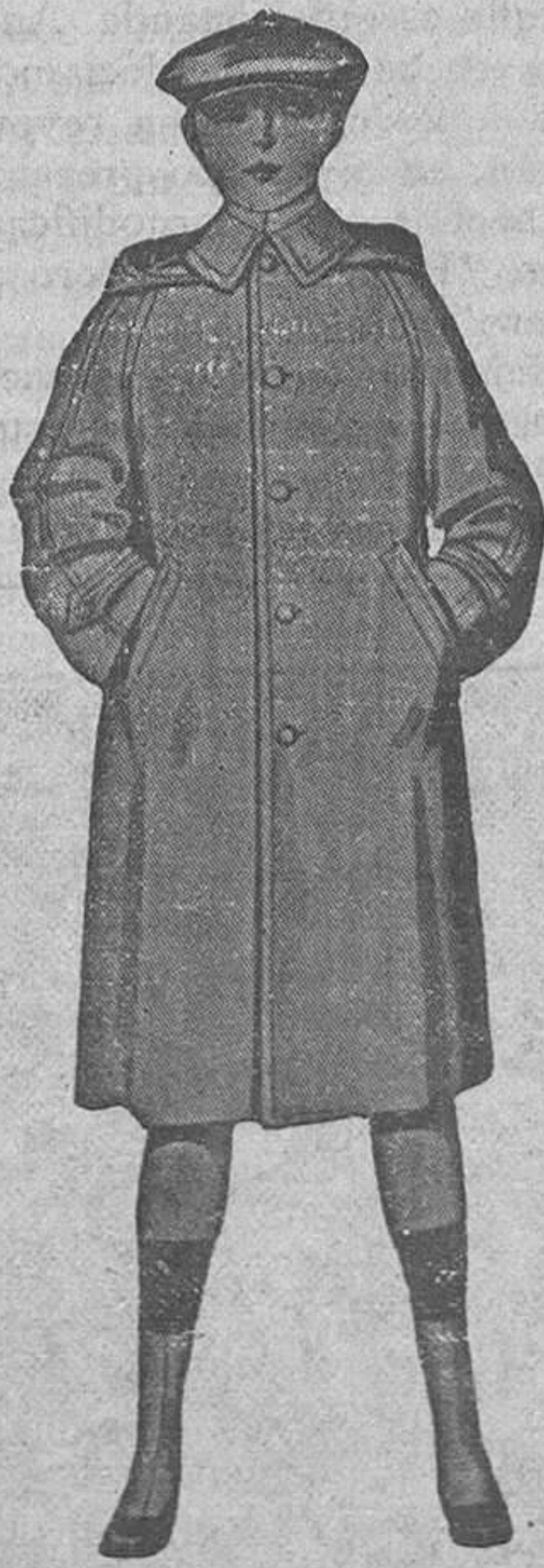
IMPERMEABLE niño, modelo cerrado o abierto, con o sin cinturón y capucha. En hule de primera, negro, gris y café; para 12 o 14 años.