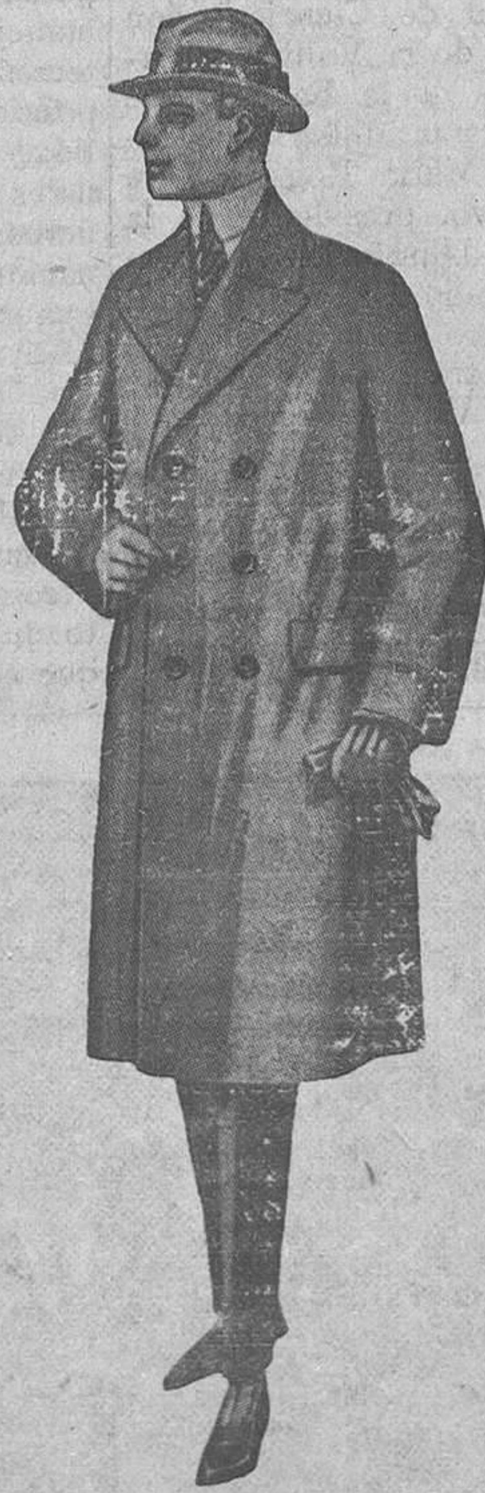
GABÁN cruzado, modelo recto' gamuza o ratina superior, colores oscuros lisos.