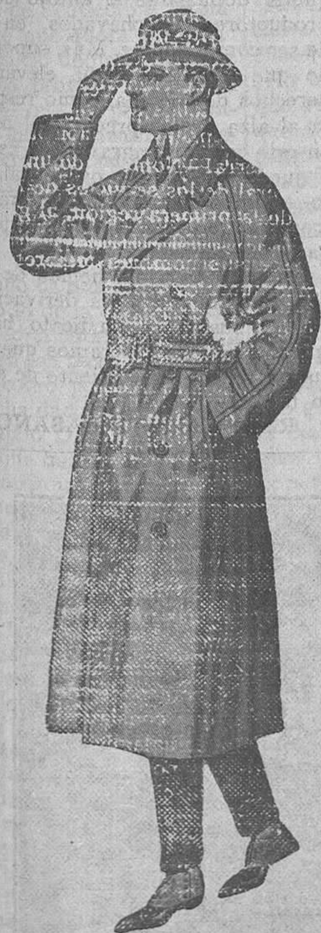
GABARDINA. Impermeable modelo cruzado. Lo más nuevo en puro estambre torzal.

LA CASA QUE MAS SURTIDO PRESENTA EN TODA LA PROVINCIA