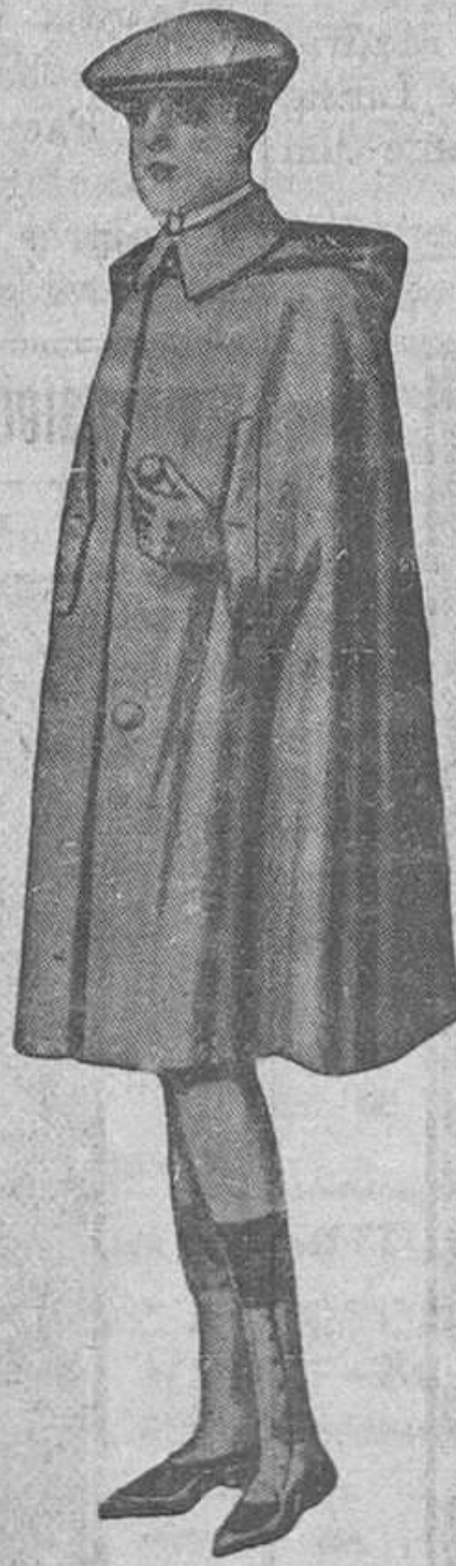
CAPITA impermeable, en negro, gris o café, calidad inmejorable; tamaño 150 centímetros.