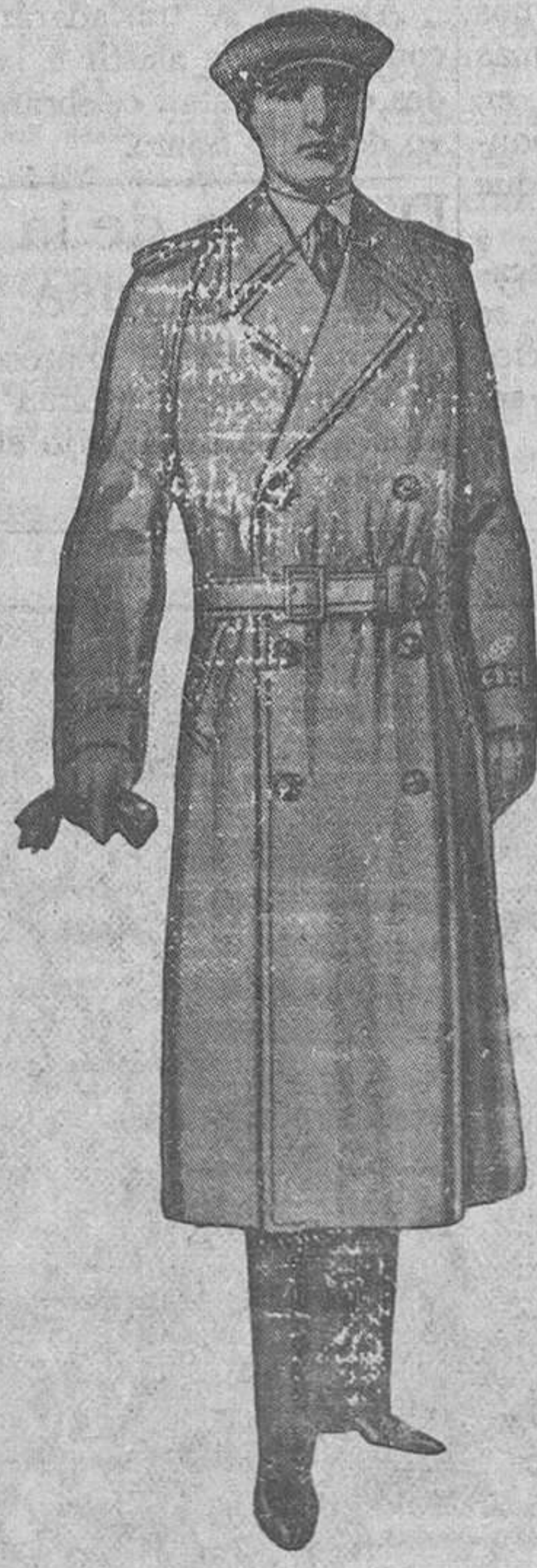
TRINCHERA inglesa, tres telas, botón cuero, distintos colores y modelos, desde