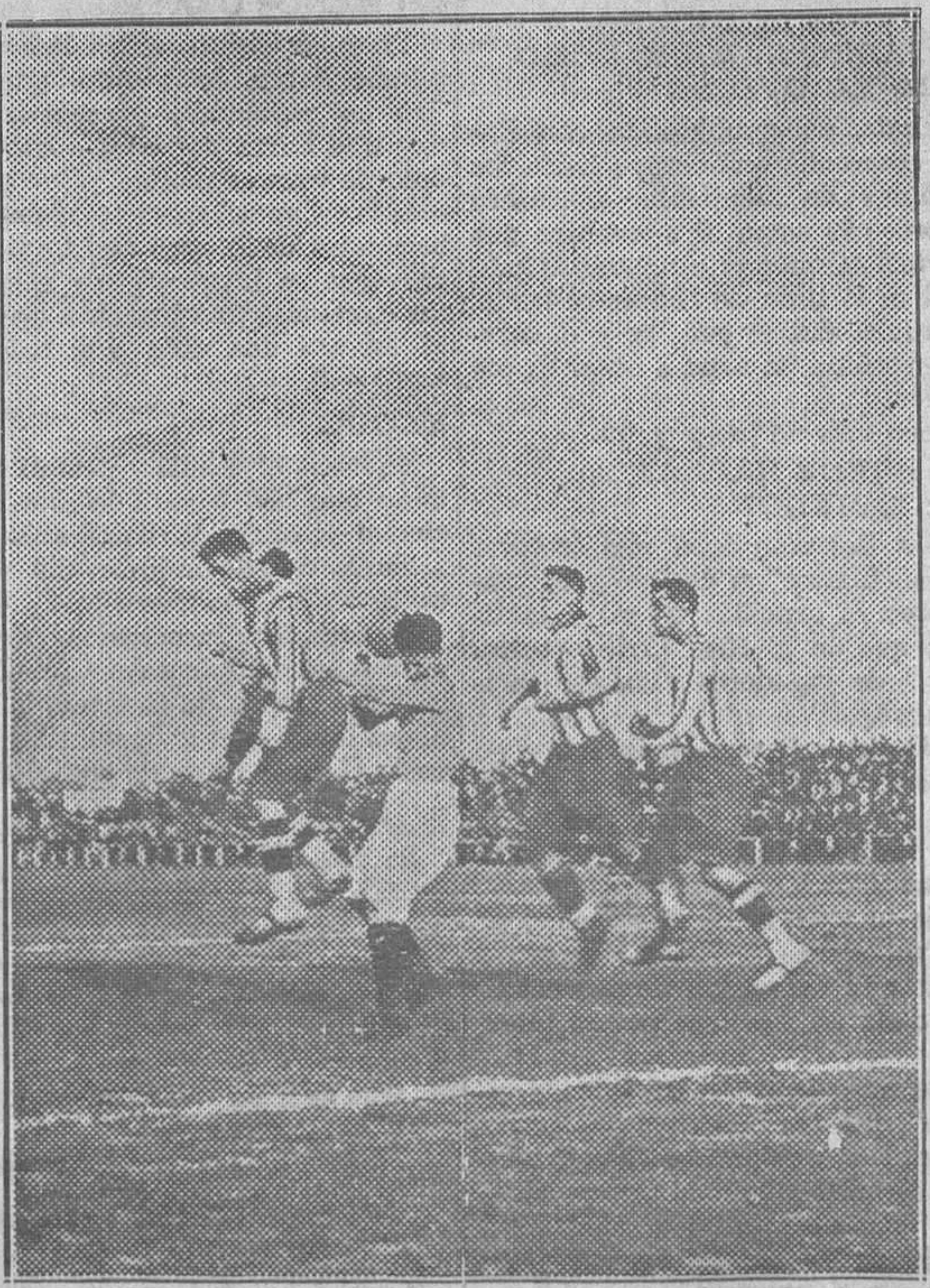
Del peligro que ofreció la delantera ovetense queda patentizado en esta «foto» hecha en el momento de ser «empujados» por tres contrarios