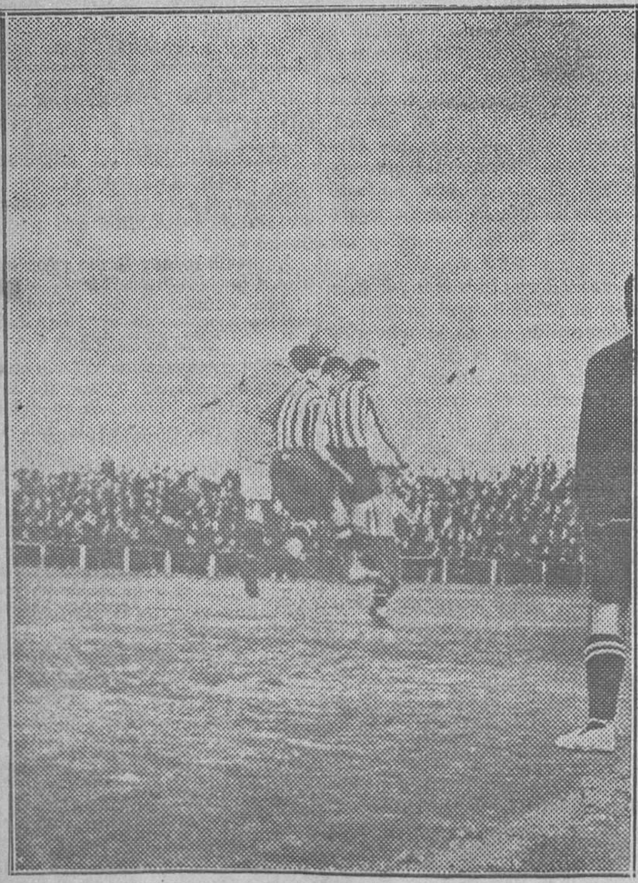
La defensa del Racing disputa a Zabala un centro que viene de corner

El señor Feijoo conferenció ayer largamente con el general gobernador militar de la plaza, empezando seguidamente a cumplir el cometido para que fué enviado a Asturias por el Gobierno.