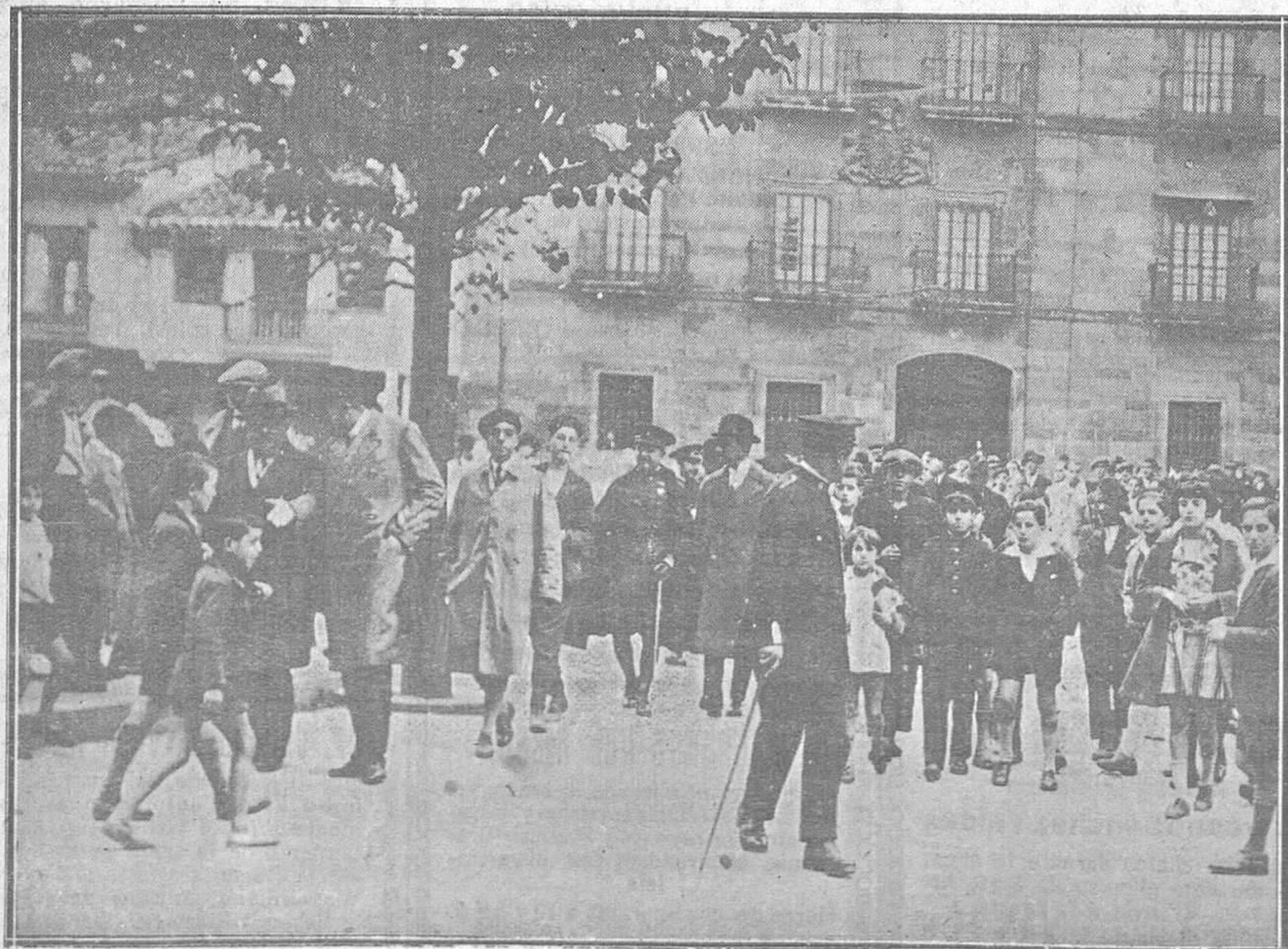
EL INSTITUTO DE AVILES.—Las primeras autoridades de la provincia dirigiéndose, después del acto inaugural del centro de enseñanza, al hotel donde se celebró el banquete conmemorativo

Redacción de «La Voz de Asturias» Apartado núm. 29