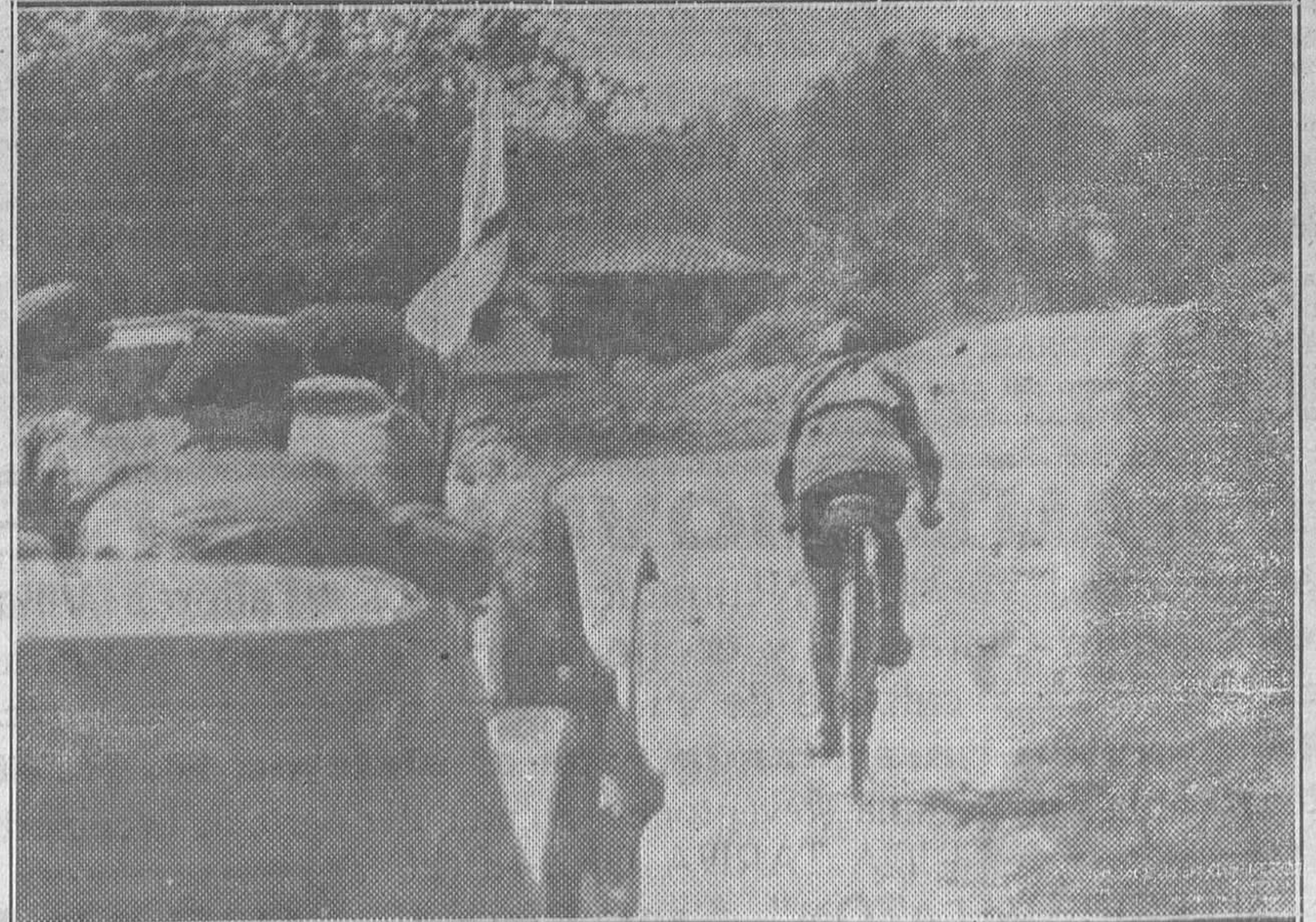
Montero sube y sube cada vez con más brío, asegurando el triunfo