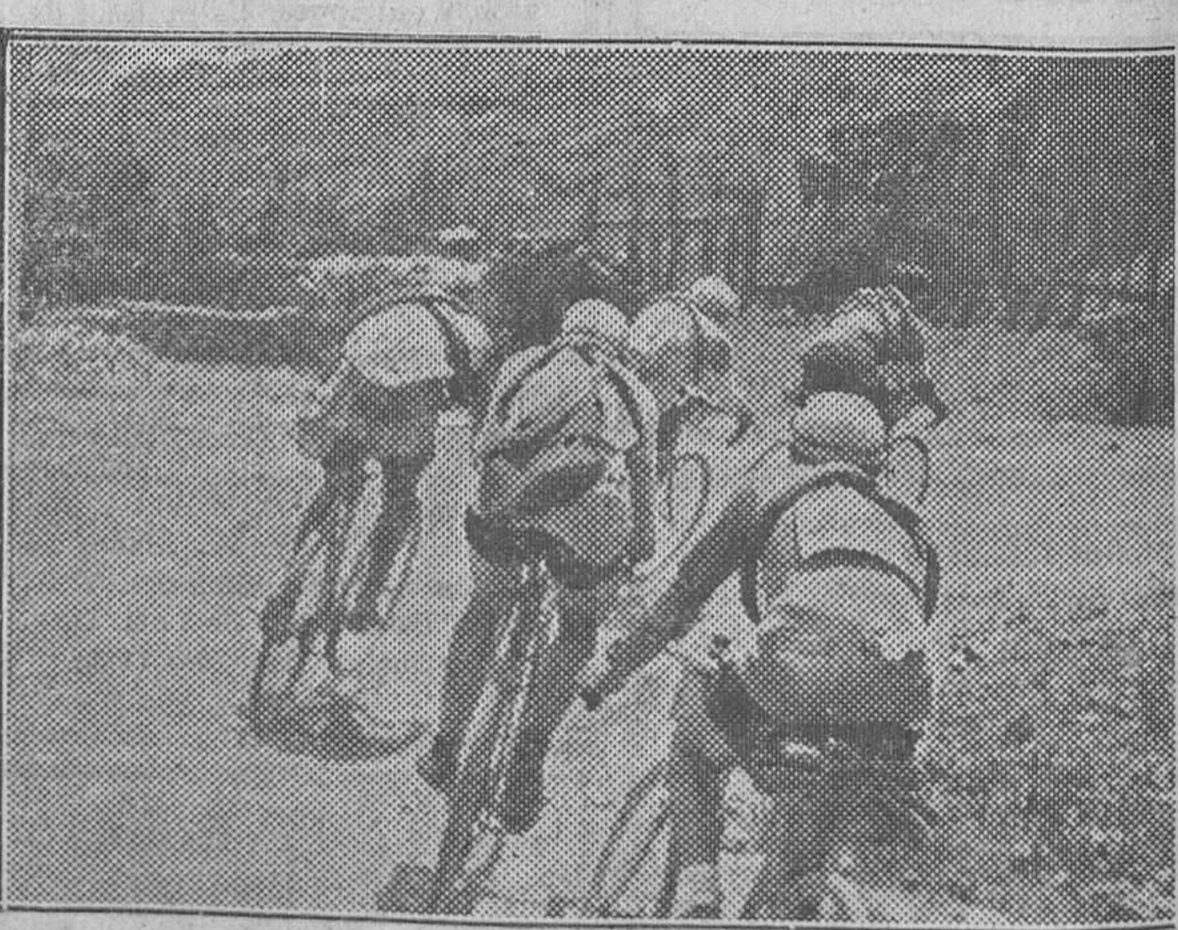
Camino de Tineo el pelotón de cabeza toma un fuerte viraje