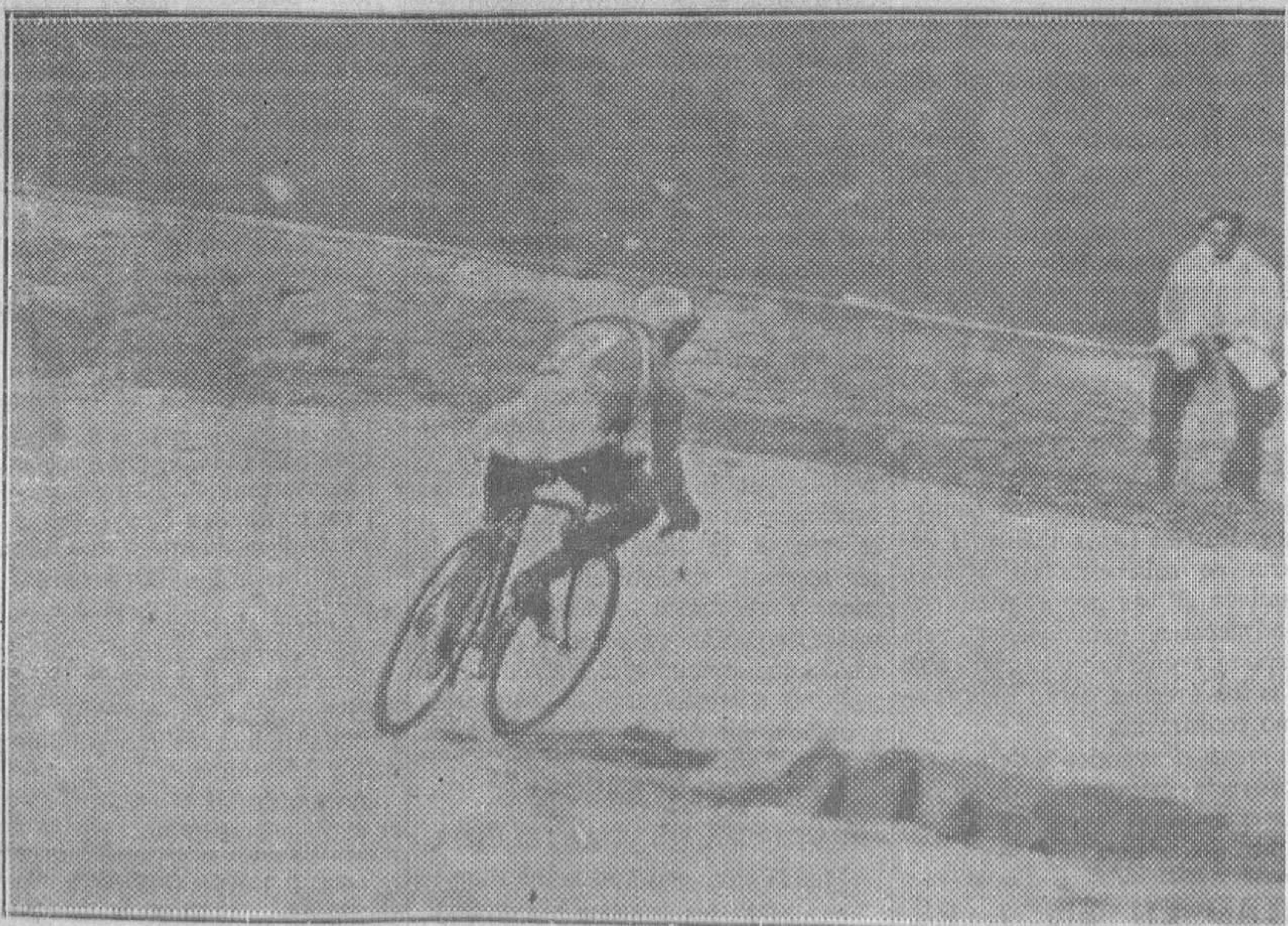
En la bajada a Cornellana, Castro se mete en «La Revoltón» con la velocidad del rayo

Siguen recibiendo adhesiones de los Ayuntamientos de toda España.