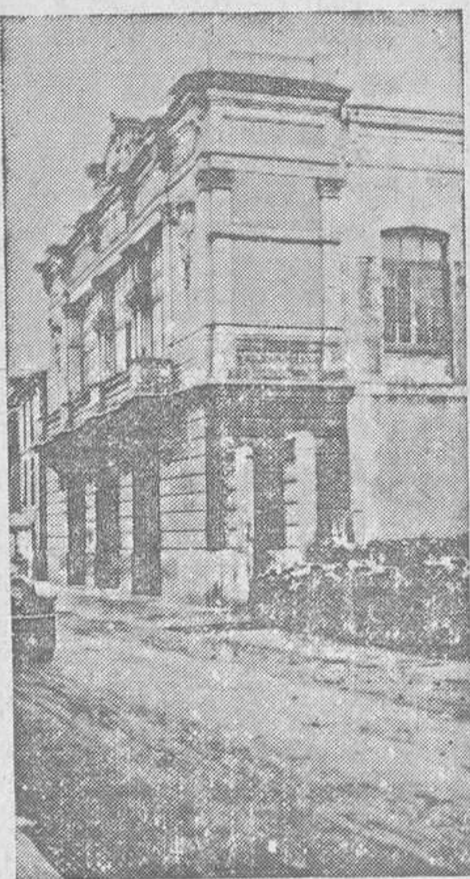
CASA CENTRAL DEL SINDICATO AGRICOLA DE PILOÑA