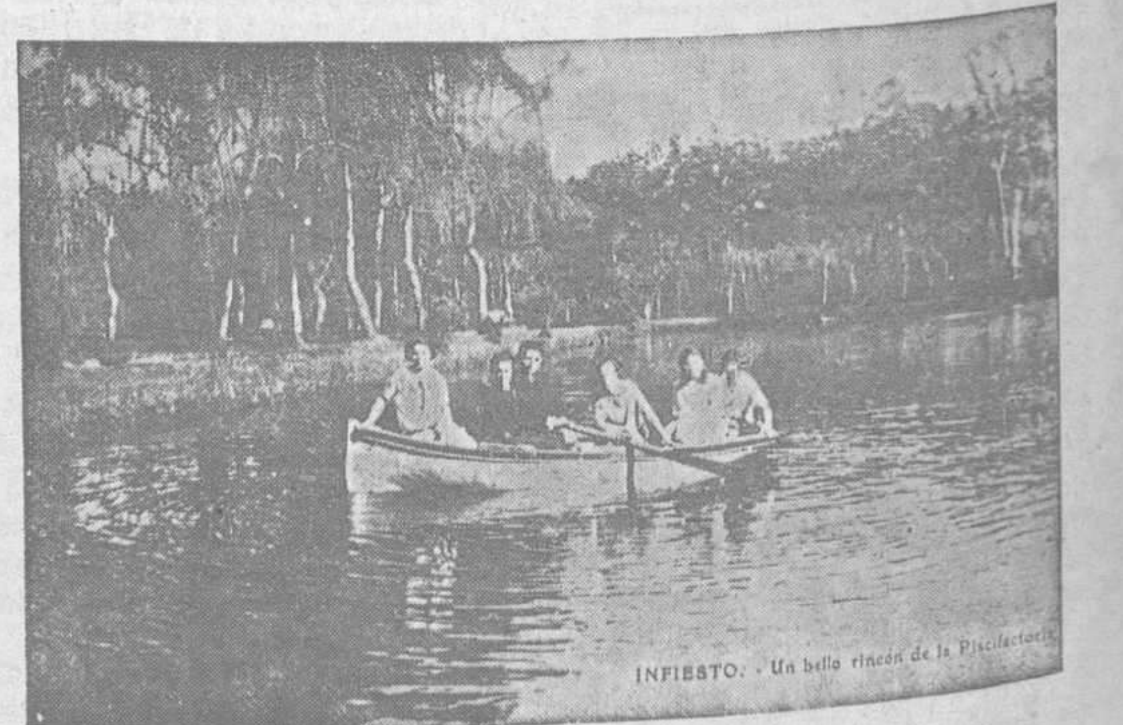
INFIESTO. — Un bello rincón de la Piscifactoría