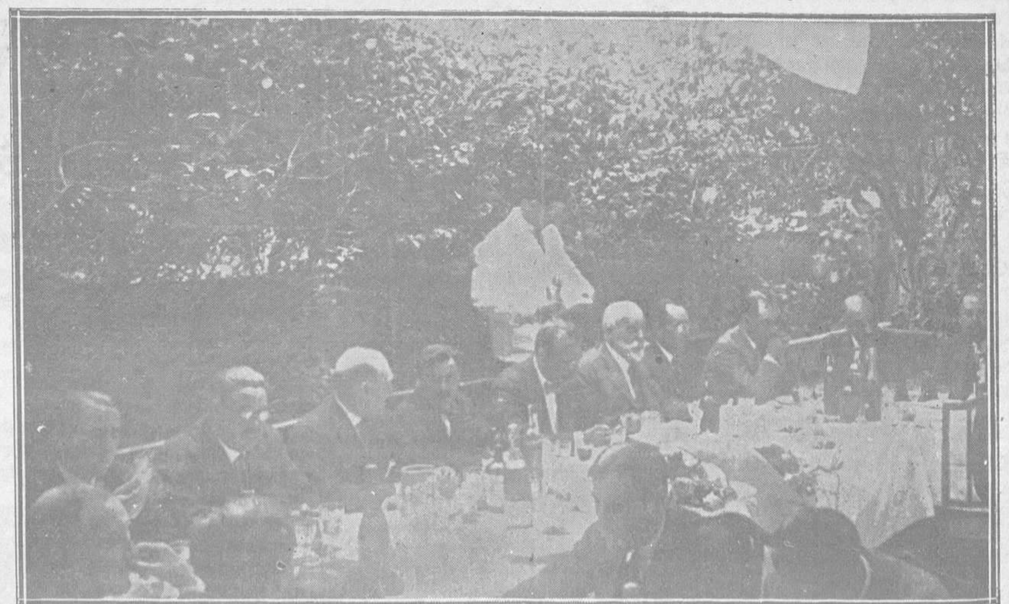
«EL DIA DE LOS EMPLEADOS PROVINCIALES».—Aspecto de la presidencia del banquete celebrado ayer en Veriña, que fué una fiesta de fraternidad y camaradería.