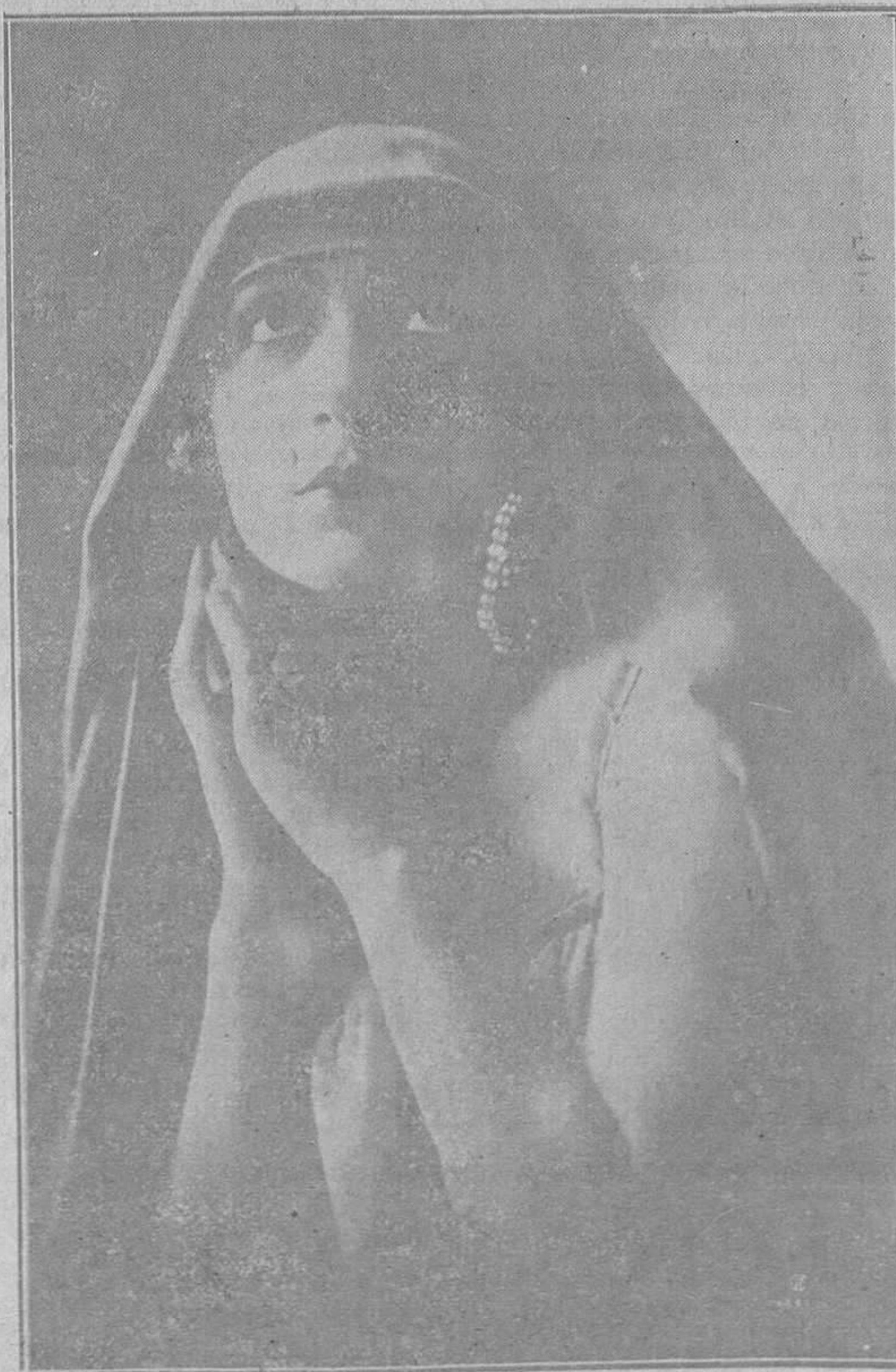
La bellísima y gentil artista Eugenia Zúffoli, que, al frente de su compañía de zarzuela, viene actuando con extraordinario éxito en el Campoamor