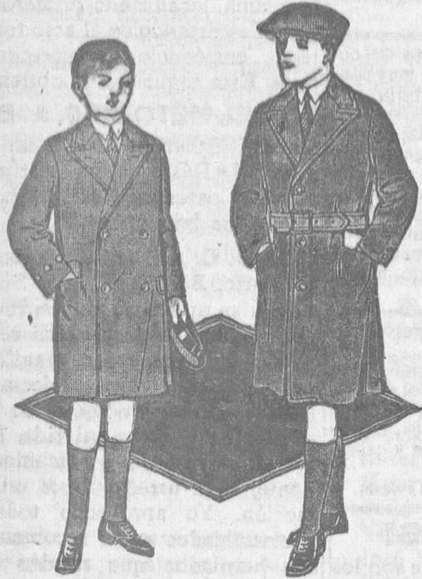
Abrigo niño, en vieta de lana, azul marino, con botones de metal dorado y bordado en lana. Para 8 años. Ptas. 26.