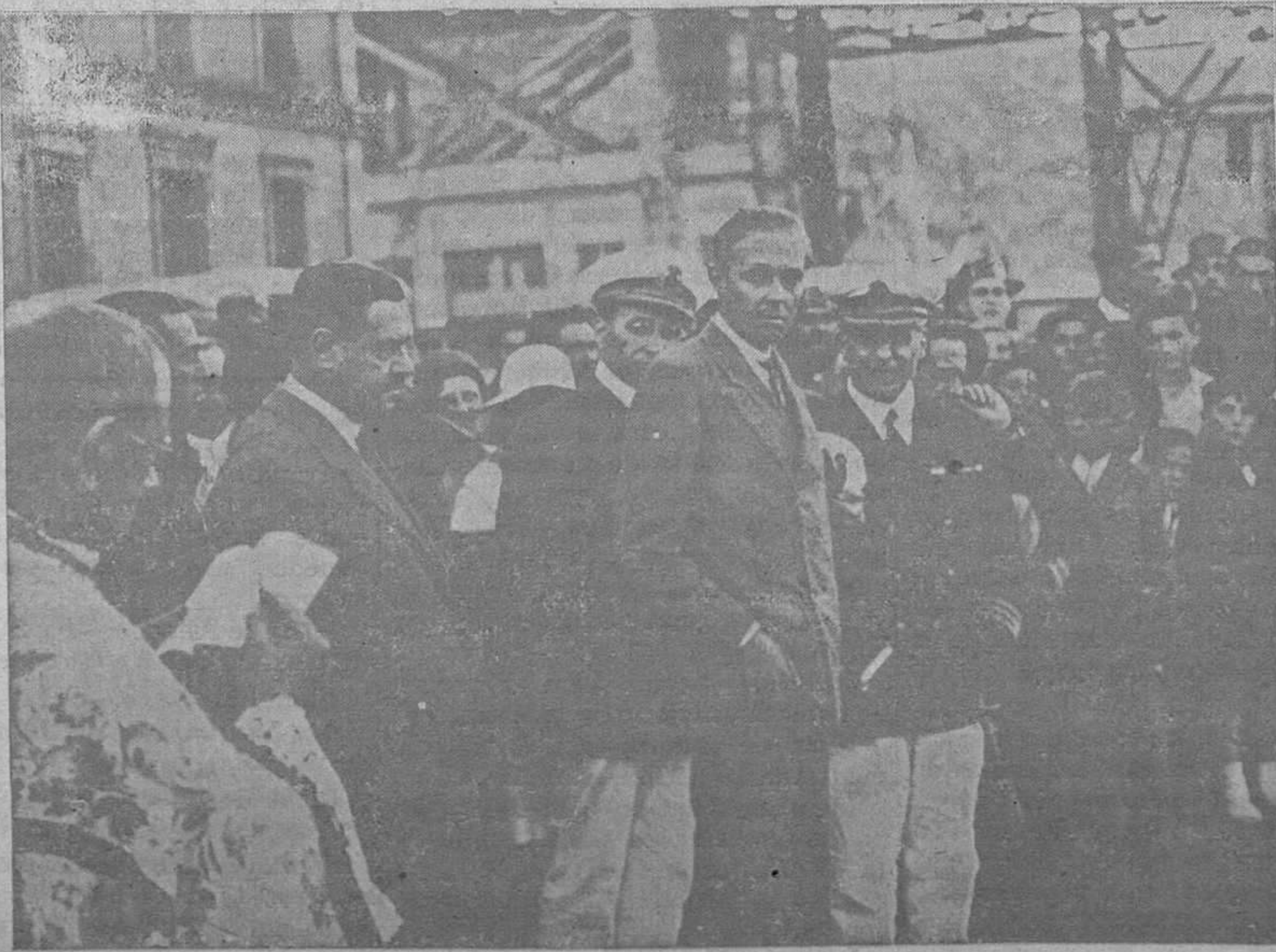
DEL VIAJE DEL PRINCIPE DE ASTURIAS. — El augusto viajero, acompañado de los técnicos y autoridades, durante su visita al puerto del Musel