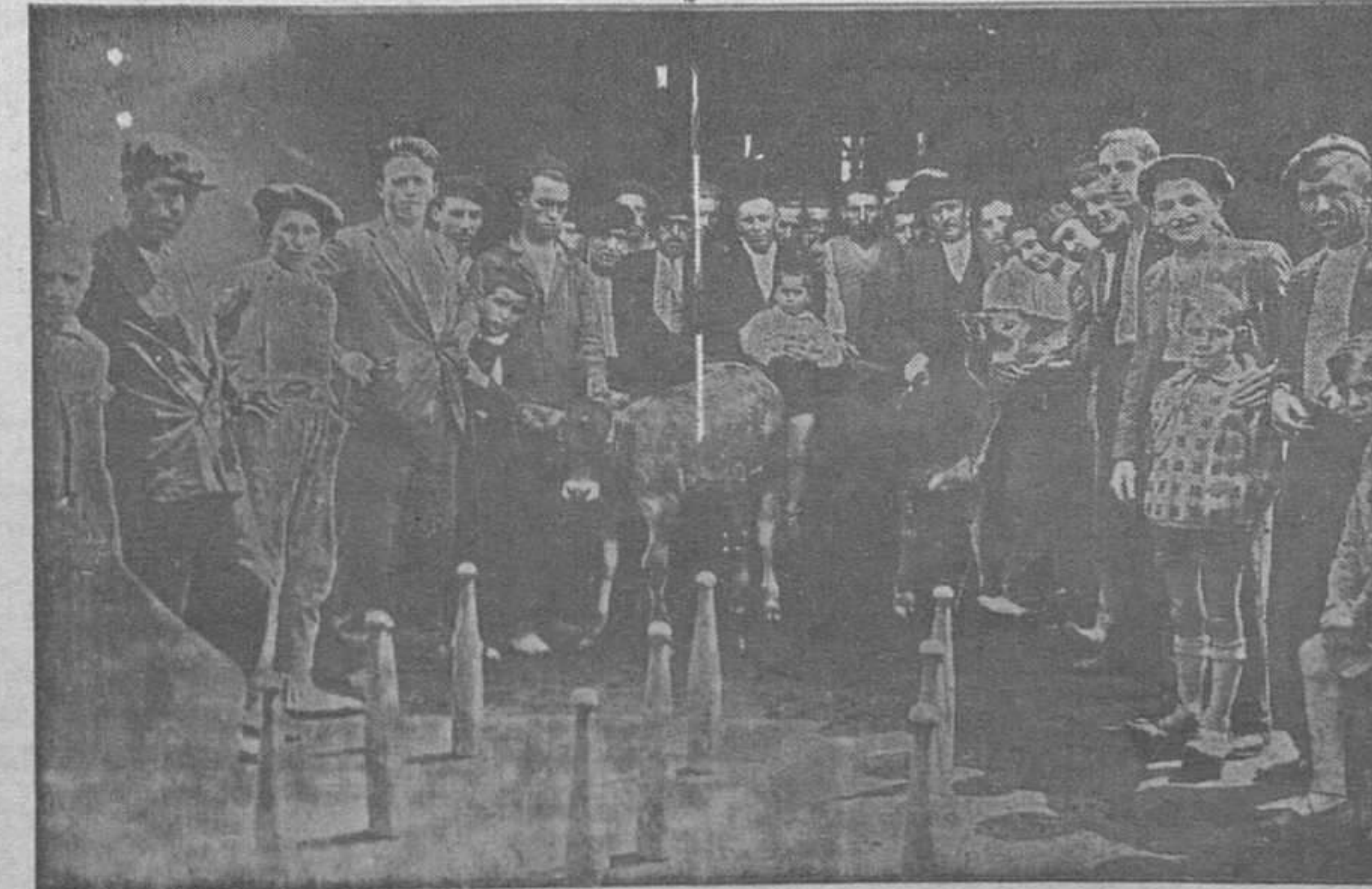
La afición a los bolos crece por momentos y en todos los pueblos de Asturias se cultiva este sencillo y admirable deporte, según puede apreciarse en esta foto que corresponde a la bolera de "Periquín", en Colloto, donde se preparan grandes partidas.