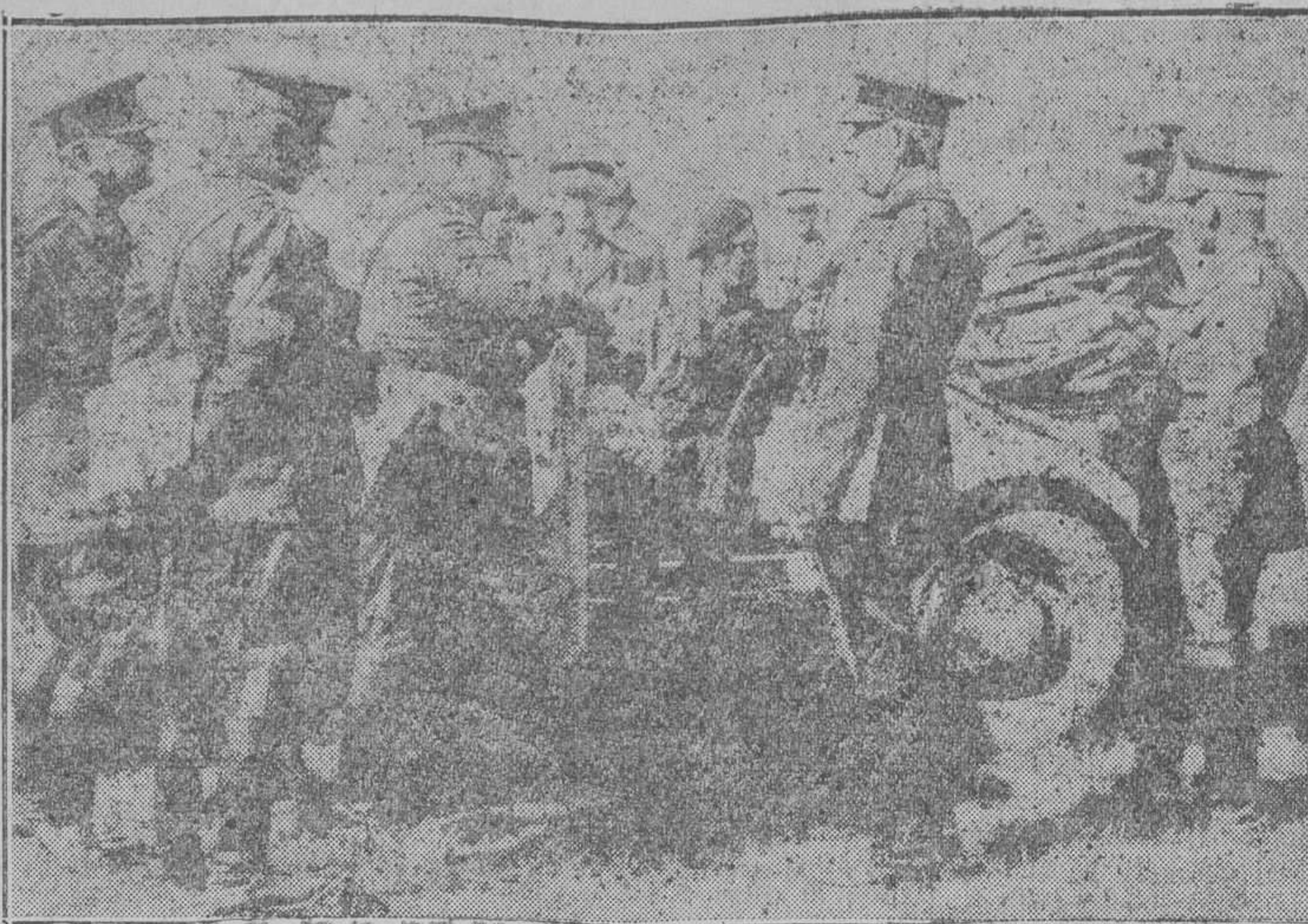
El rey Carol (sentado dentro del automóvil), rodeado de los generales del ejército rumano, presencia las maniobras militares de otoño, en Bucarest. Todo el ejército del pequeño reino tuvo participación en ellas.