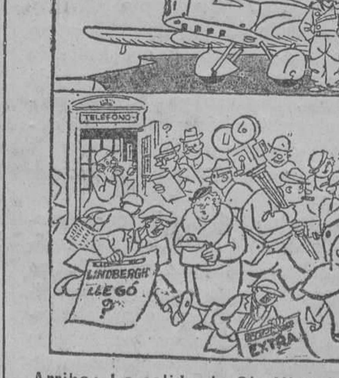
Arriba: La salida de Sir Kingsford Smith en su famoso vuelo de Inglaterra a Australia.—Abajo: El mismo día, Lindbergh llega de América a Inglaterra. (Del «Daily Express», de Londres)