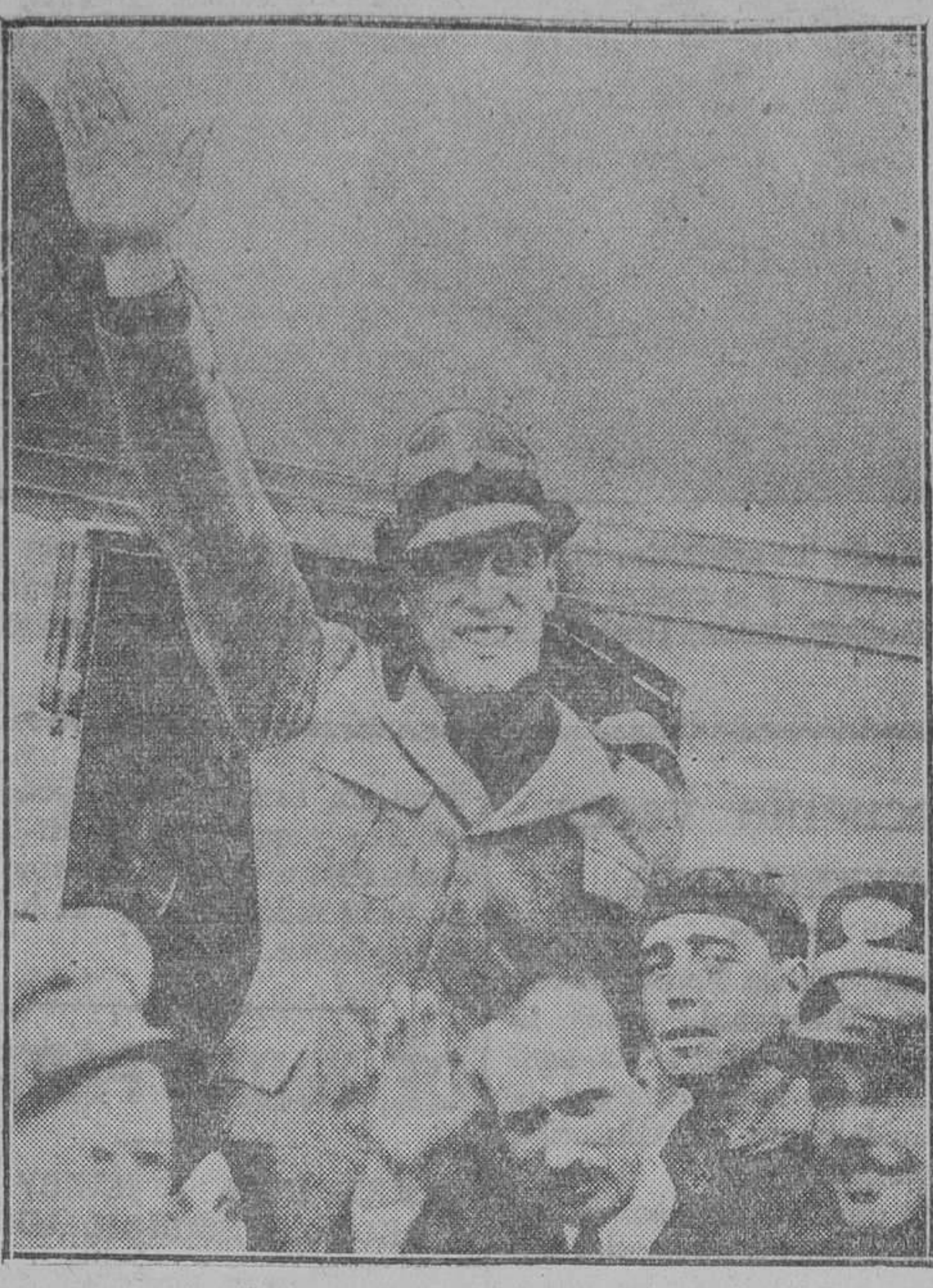
Con uniforme fascista, y tan grande como la «Estatua de la Libertad», Primo Carnera, campeón mundial de boxeo, hace el saludo mussoliniano al aterrizar en Roma...