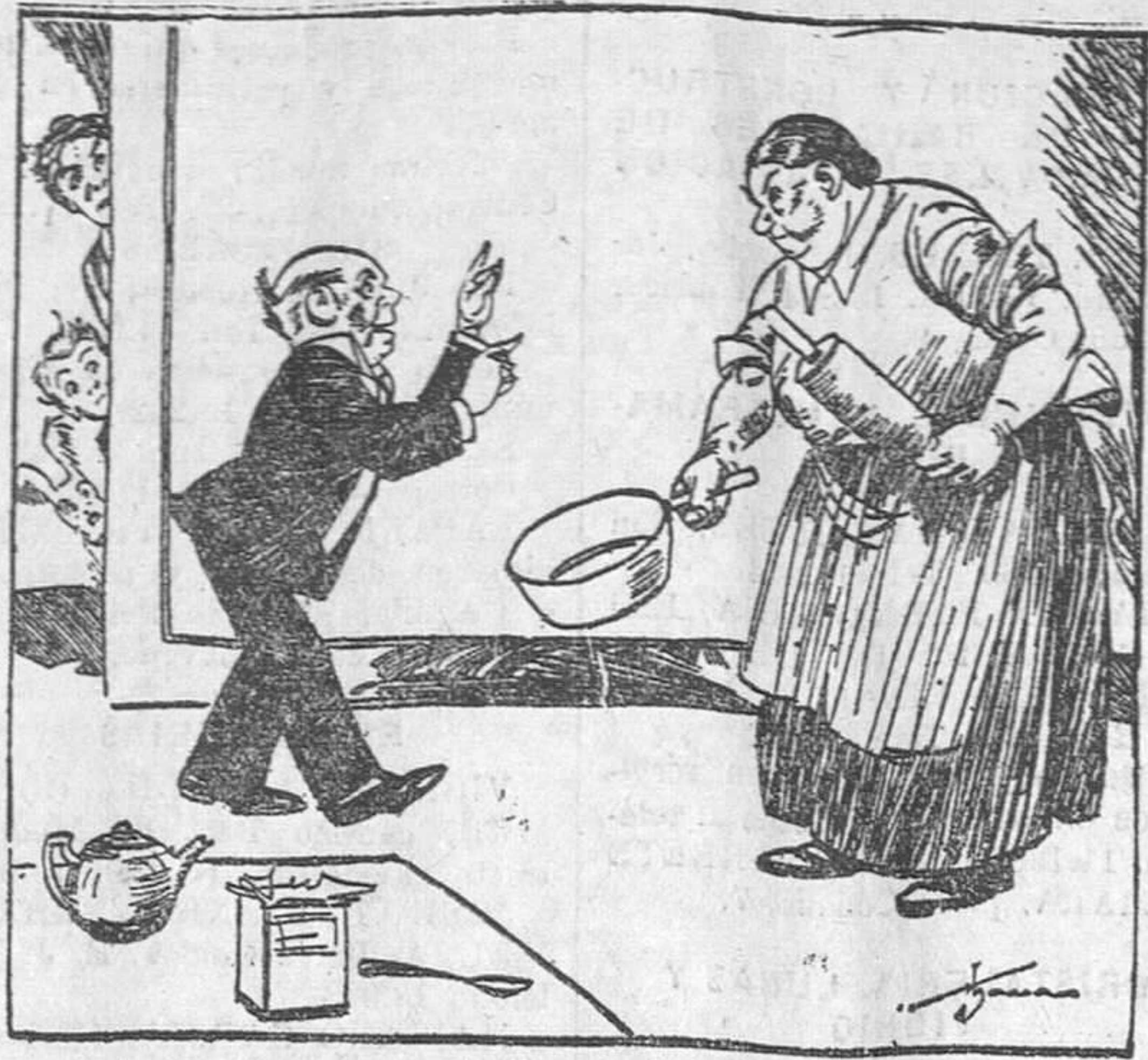
EL.—Tú no eres cocinera, sino una experta mecánica, científica, culinaria, doméstica. ELLA.—¡A mí no me venga a insultar!! (De «Ohio State Journal»)