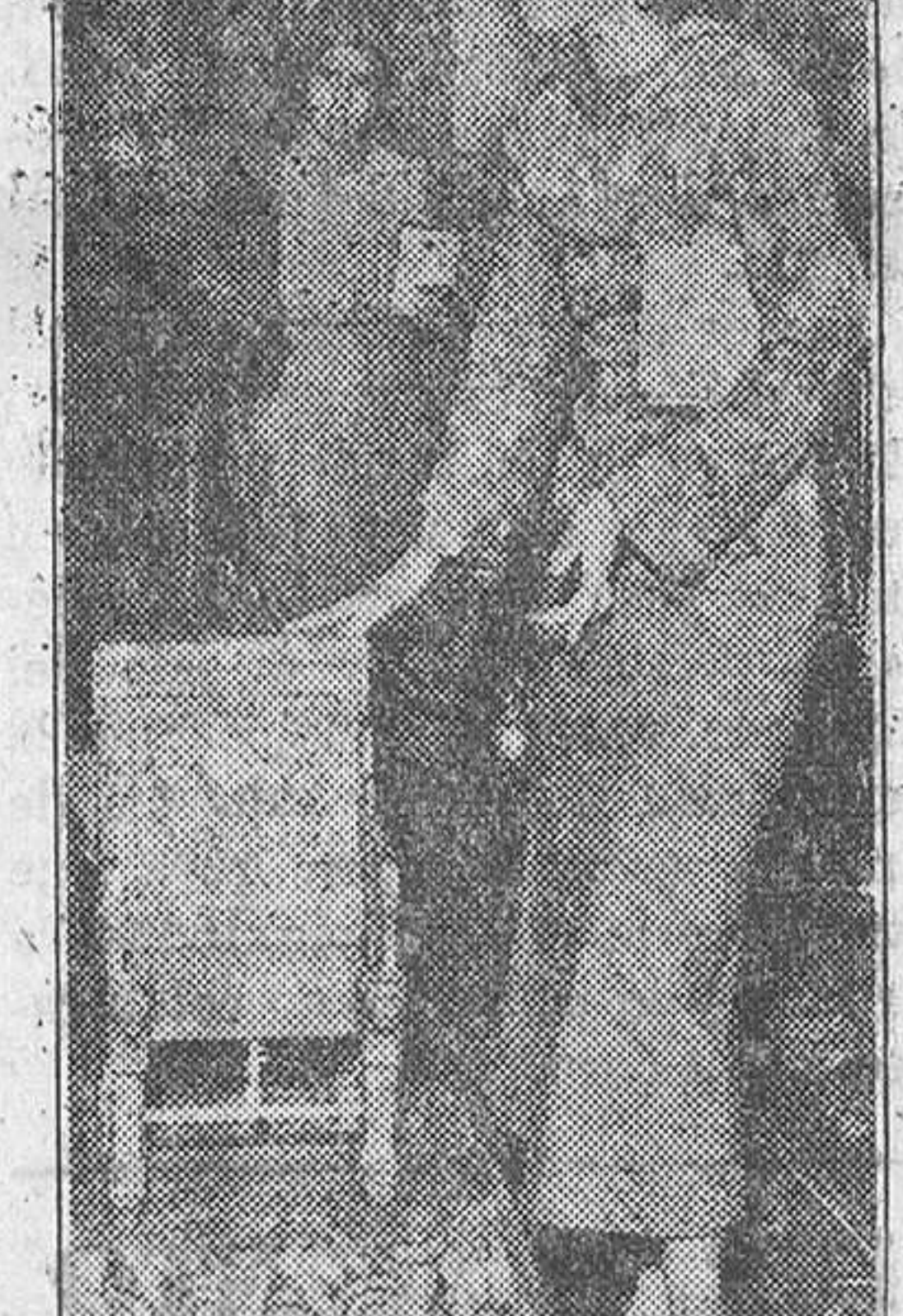
Una bella visitante examina en la Feria una reproducción del trono de oro de Tut-Ank-Amen