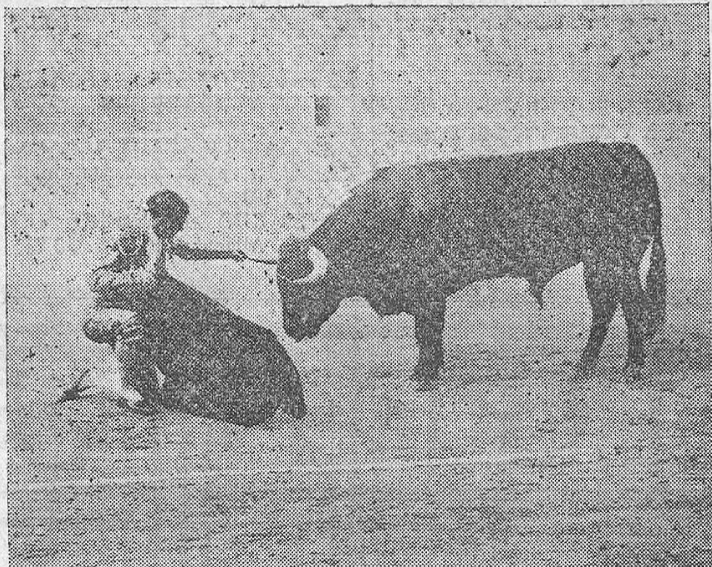
Ortega en un adorno

Esta quinta corrida anunciada como extraordinaria lo fué en efecto, hasta en los más mínimos detalles. Para que lo fuese por completo hubo en ella hasta la manseadumbre del ganado. Y en violento contraste la bravura de los toreros que ayer se lo jugaron todo.