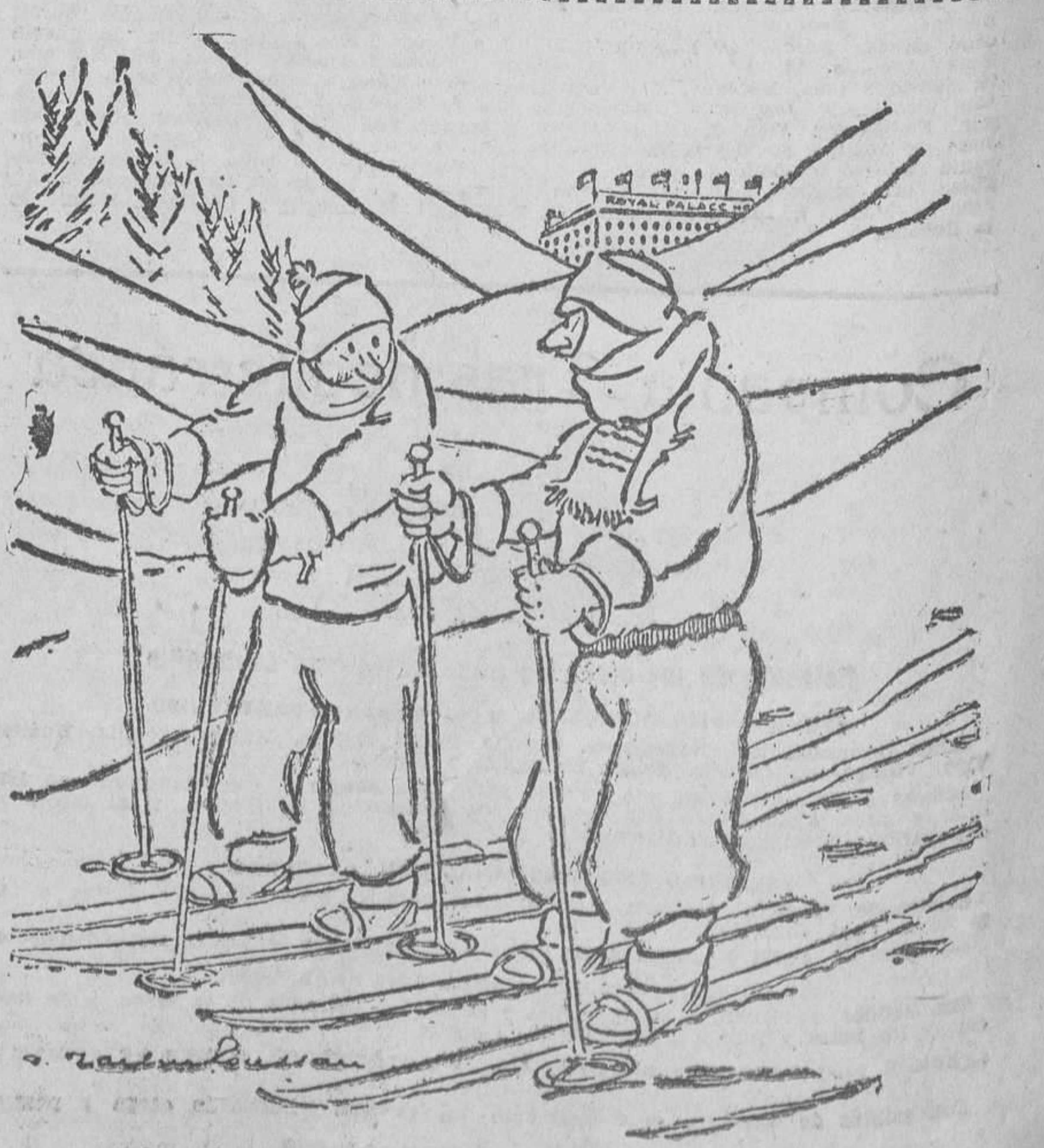
—Cuando un miembro se hiela no hay más que frotarlo con un poco de nieve. —Bueno, pero ¿y en verano?