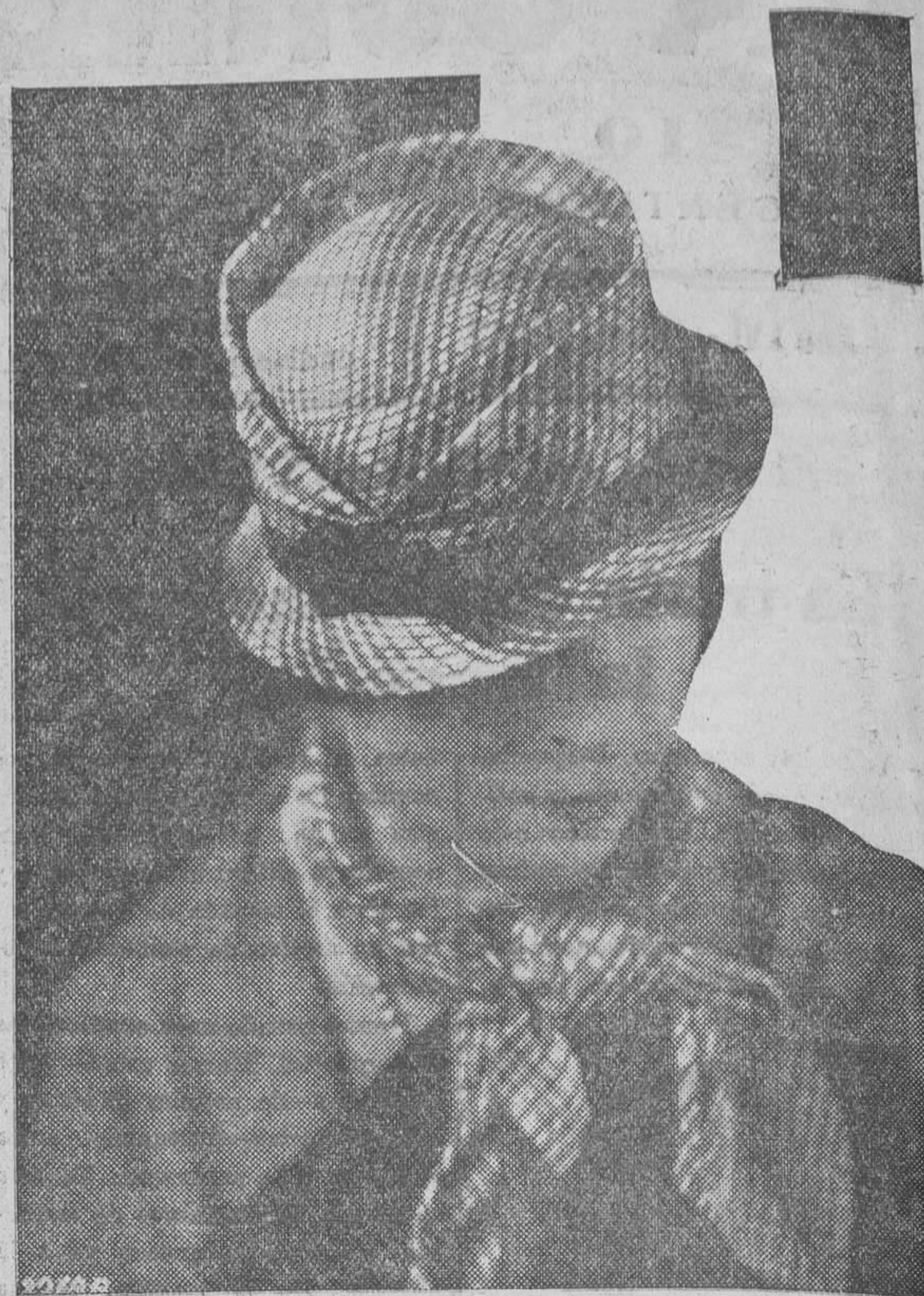
Lindo modelo de sombrero y corbata a juego, según disponen los cánones de la elegancia femenina para la actual temporada