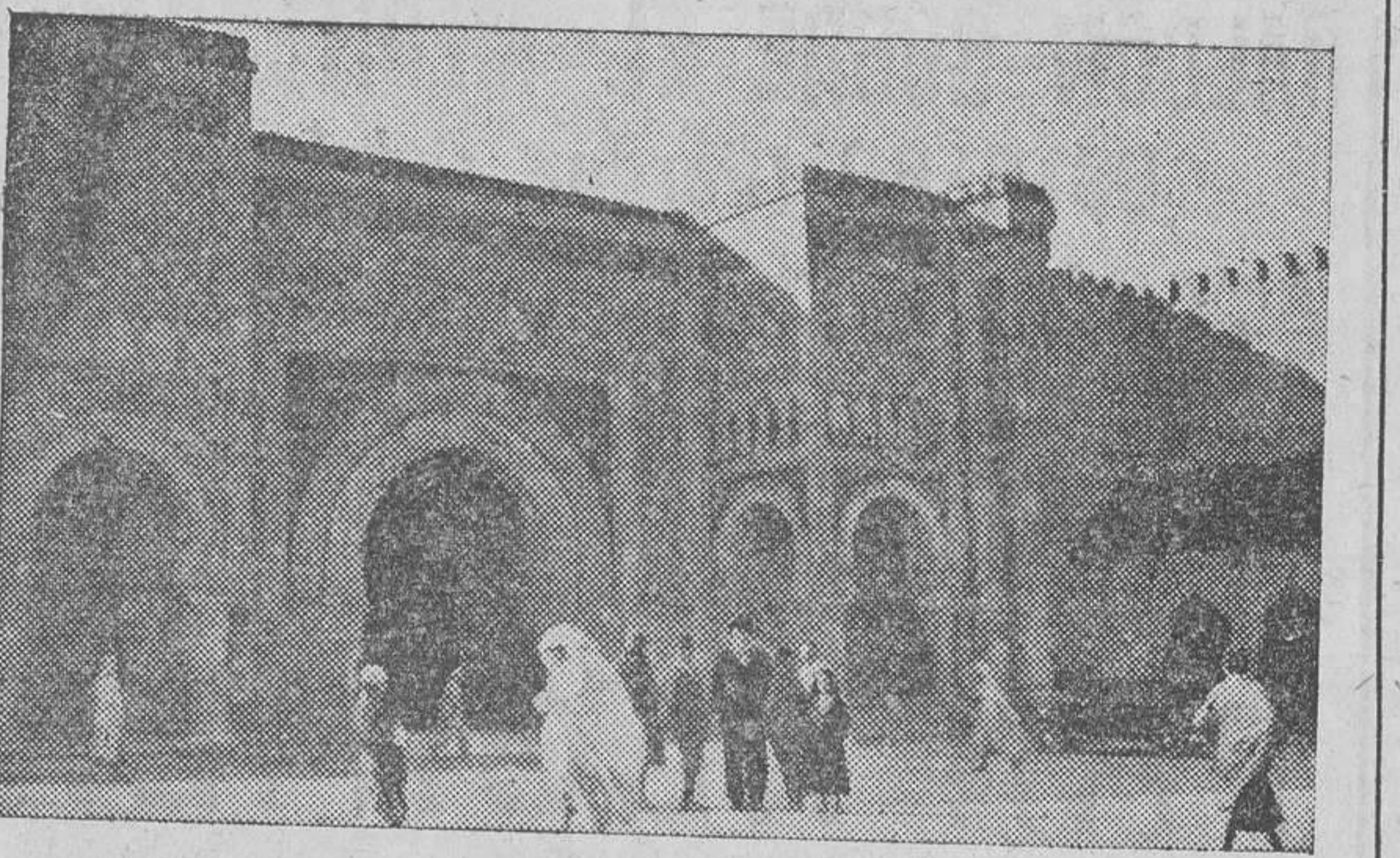
MEQUINEZ.—Puerta de Muley Ismail