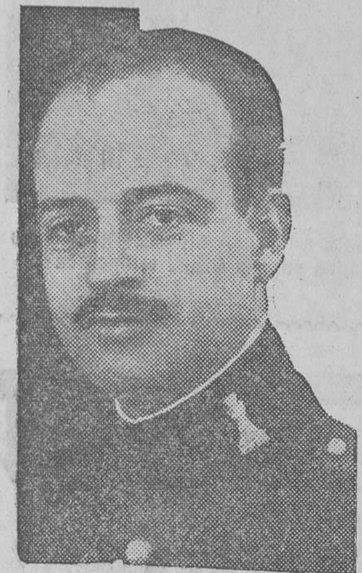
El capitán Barberán cuando ingresó en el arma de Aviación

talidad quiso que rindieran su vida inmediatamente después de alcanzada la gloria.