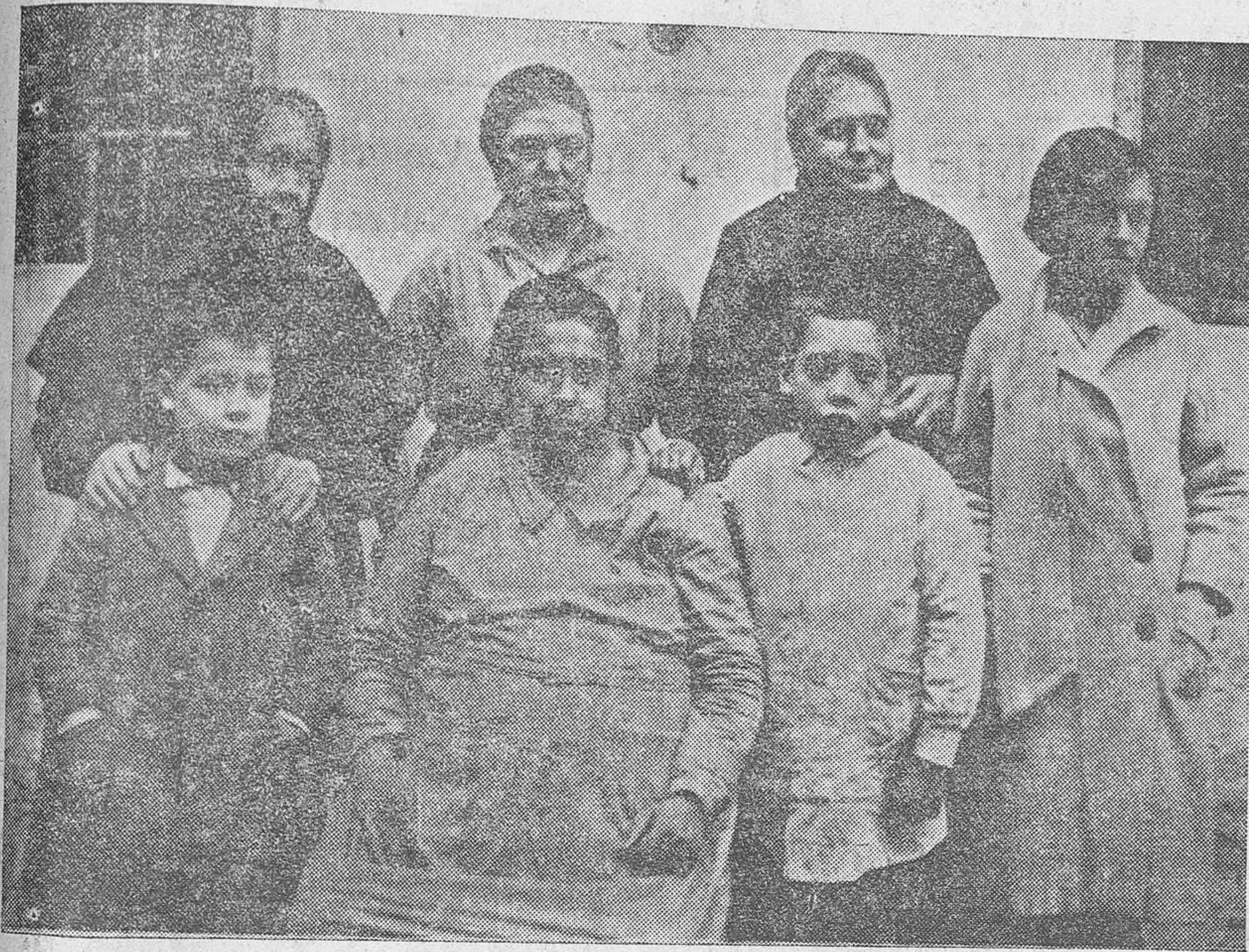
La portera y esposa del chófer del marqués de Villorres con la cocinera y demás agraciados con el «gordo»

En el sorteo de hoy han correspondido ¡36 millones de pesetas!, al salir premiados los números 24.630 y 16.626 con la primera y segunda suerte del sorteo de Navidad