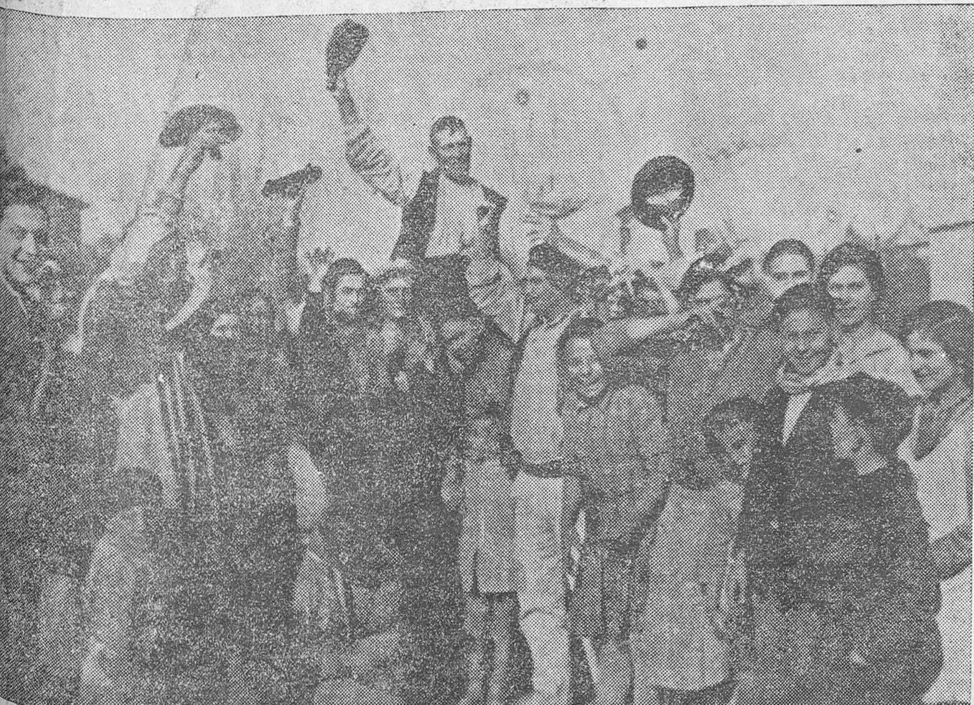
El presidente del Círculo de Labradores de Pinedo es paseado a hombros por los favorecidos

RESISTENCIA, duración, precio sin competencia, son las cualidades que distinguen a las correas de goma para transmisión «MACINLOP». Agencia, Sorní, 22.