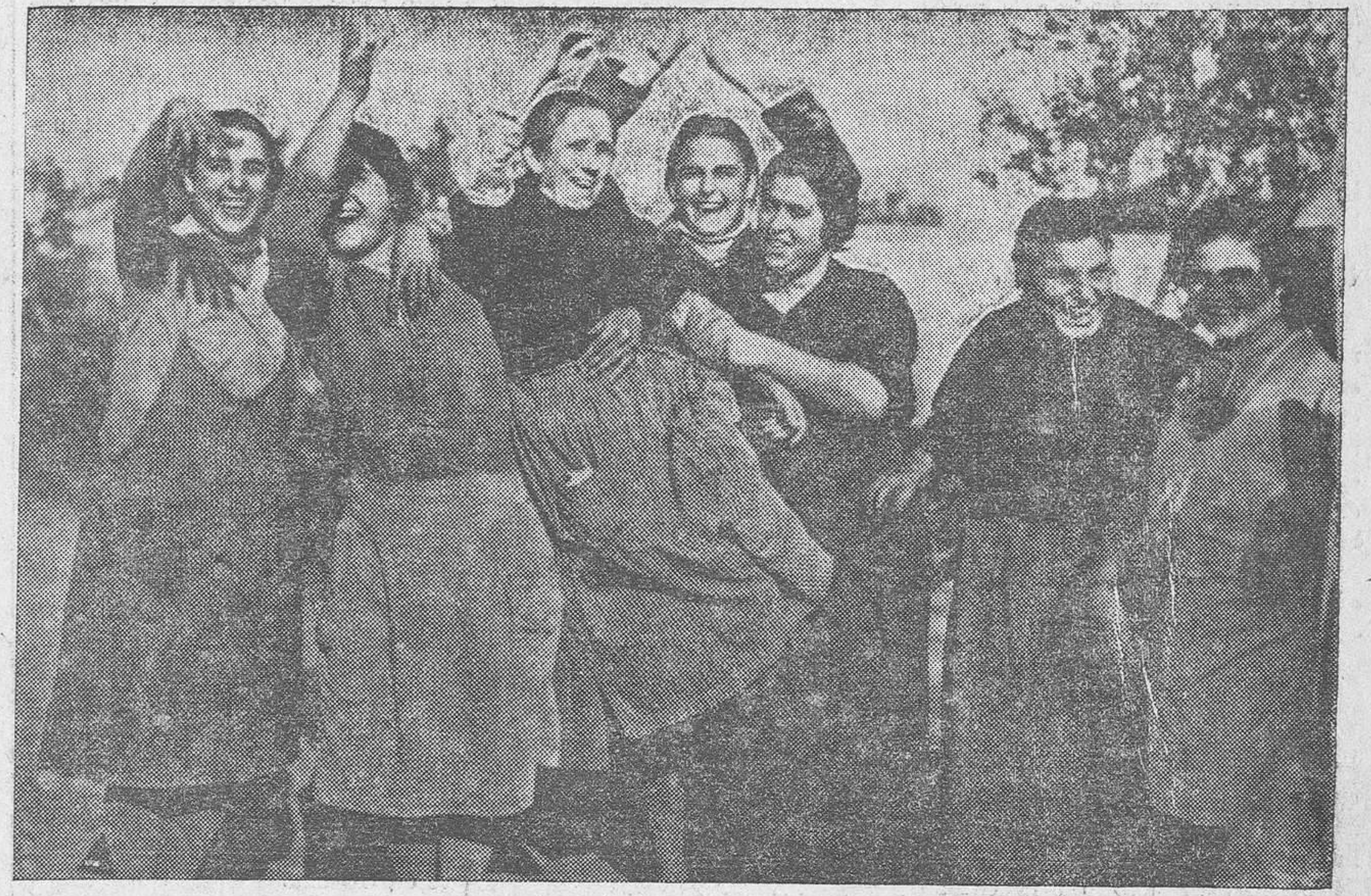
La conserja del Círculo de Labradores de Pinedo, después de la ovación y oreja del «gordo», sale en hombros por aquella barriada