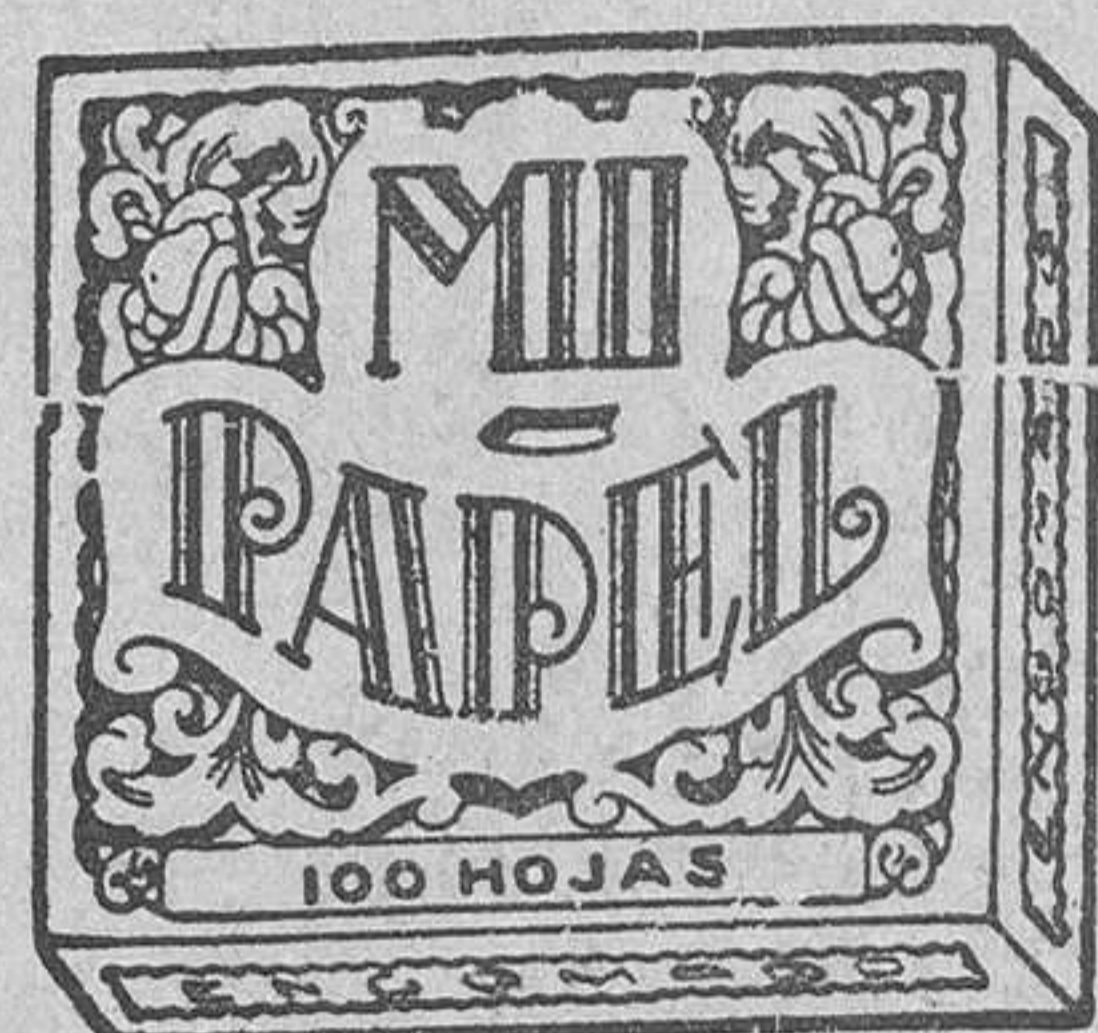
(MARCA DE FABRICA)

CAMAS METALICAS- Visite la Gran Exposición del interior