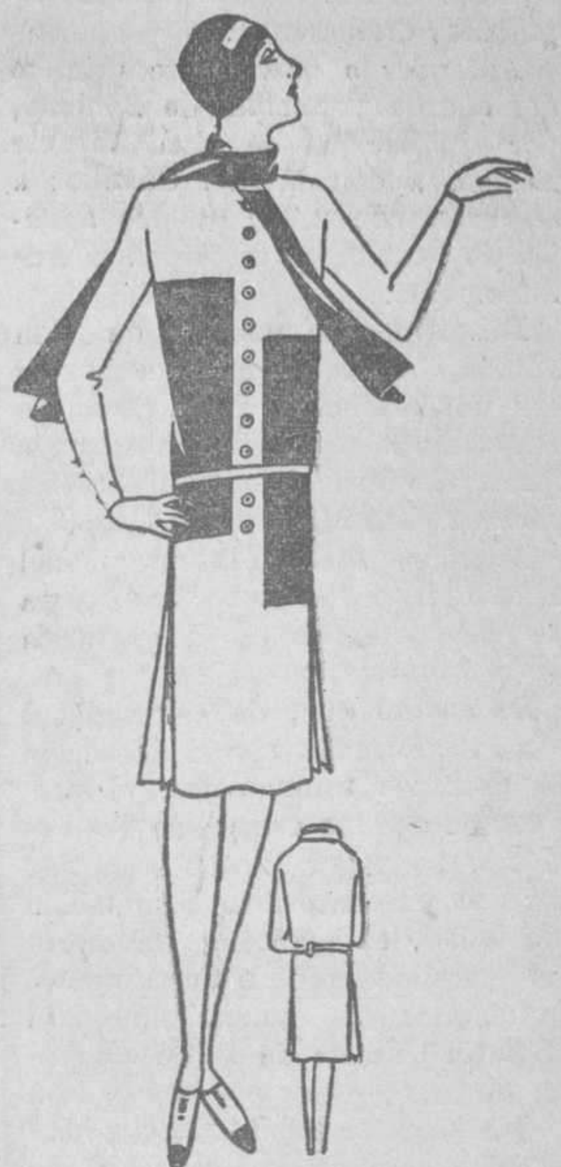
Traje jersey color rosa y marrón con pliegues a los lados

A las tres de la tarde, en el patio del monasterio, dirimirán la palabra a los peregrinos varios oradores seglares, y acto continuo tendrá lugar solemne exposición de Su Divina Majestad y el acto de consagración a la Virgen.