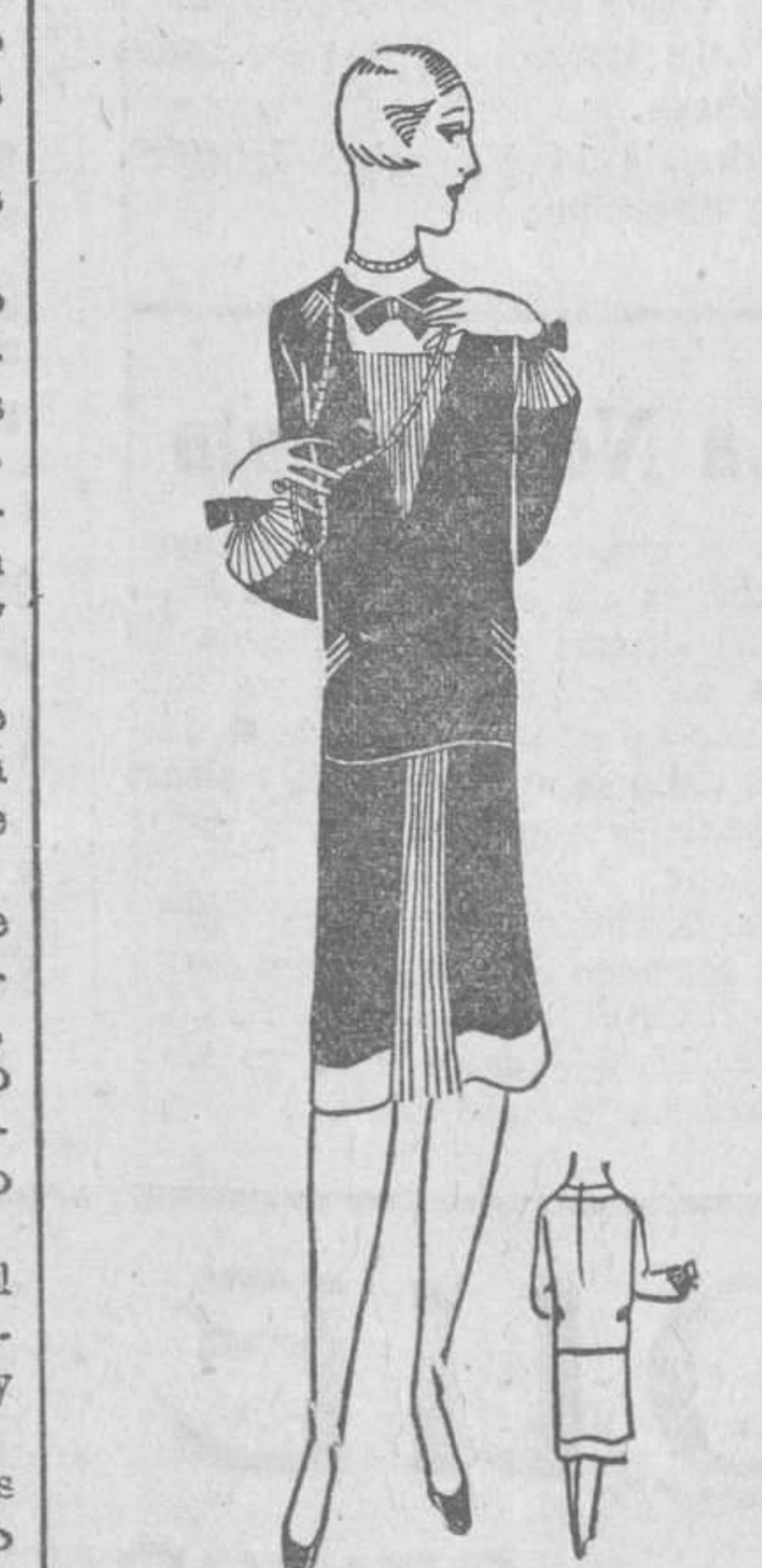
Traje de una pieza de marroquin negro con adornos de color en crepe de China