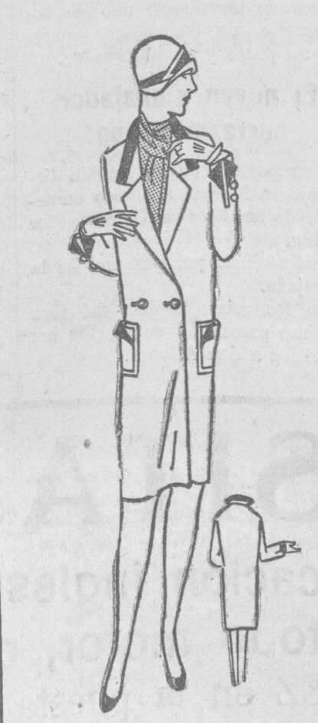
Abrijo en kasha guarnecido de piel marrón

Cafés SUBLIME lo vende SIXTO AYORA (Marca registrada) SAN VICENTE, 160 Teléfono 3 284 - VALENCIA