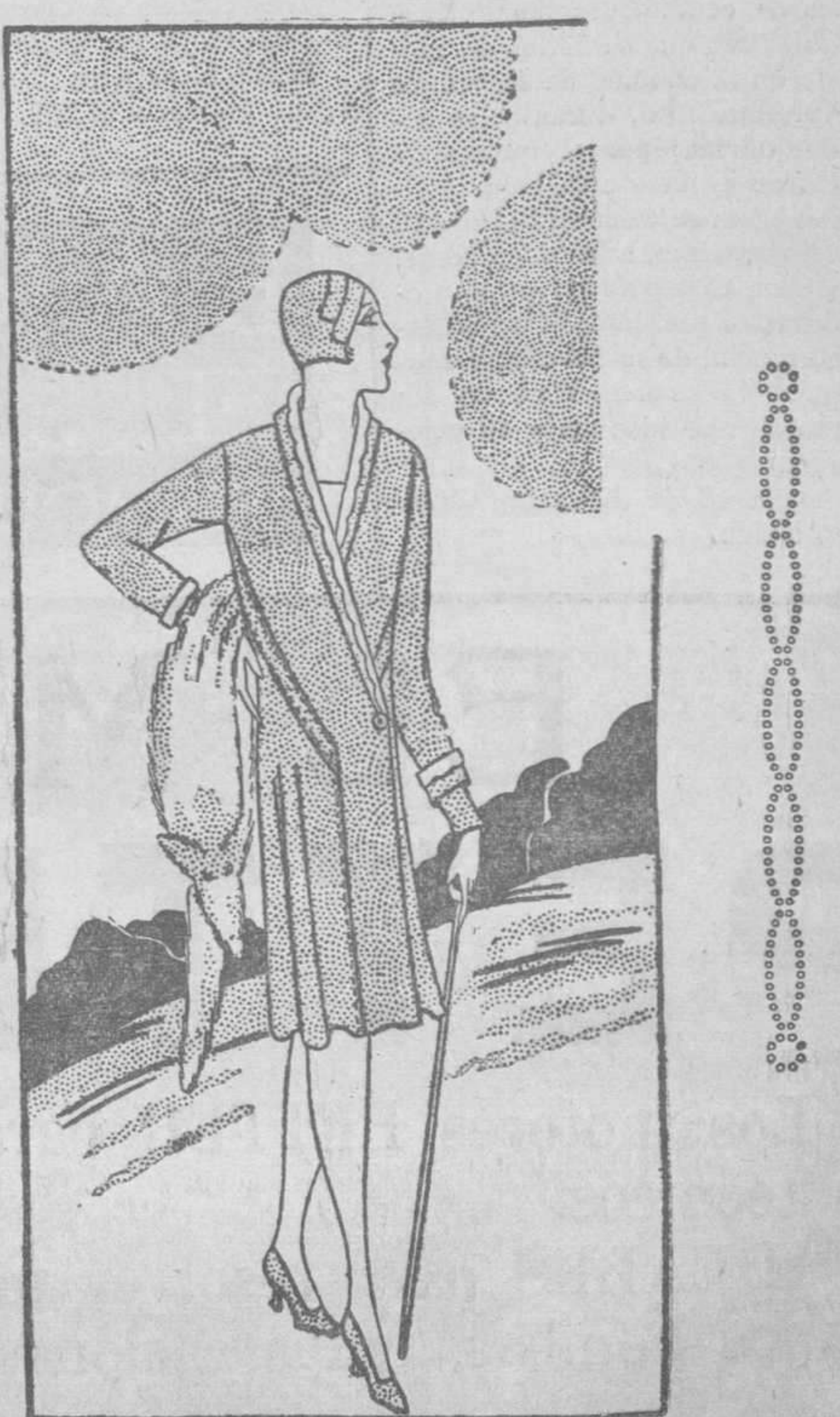
Gabán de tono gris. Las vueltas de cuello y mangas de crepe de China blanco

A las tres de la tarde, en el patio del monasterio, dirimirán la palabra a los peregrinos varios oradores seglares, y acto continuo tendrá lugar solemne exposición de Su Divina Majestad y el acto de consagración a la Virgen.