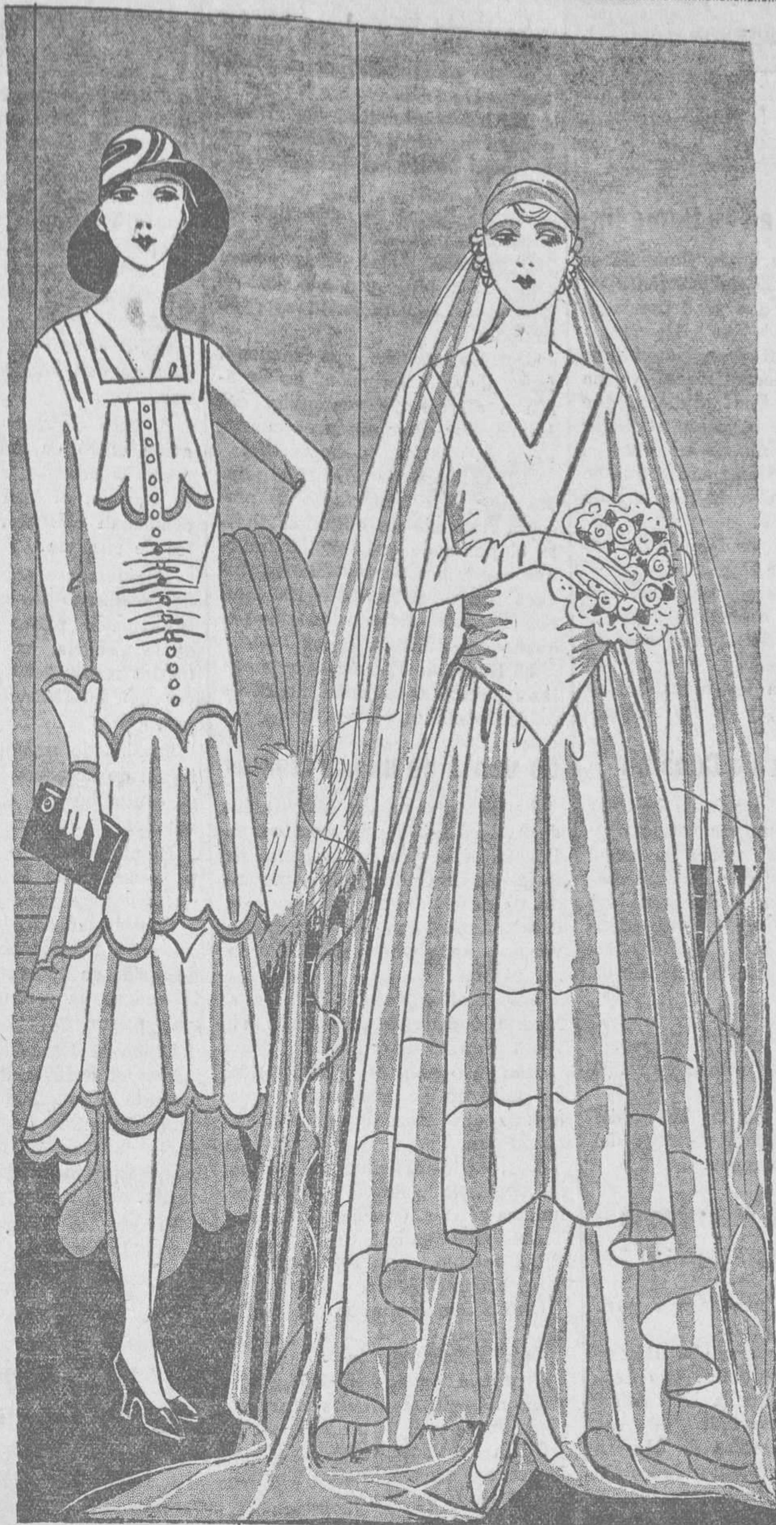
Traje de terciopelo guarnecido con volantes y piques de satín de colores. El cuerpo adornado con botones y cuello bordado.—Traje de desposada de crepe satín