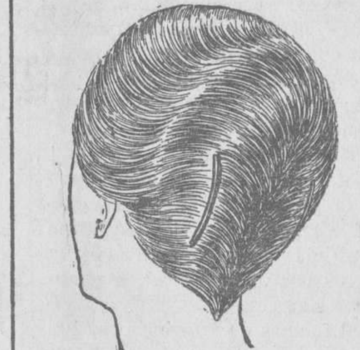
Peinado original. Los cabellos, ligeramente ondulados, son sujetados atrás con una pluma figurada en punta. Una peñeta mantiene la armonía del peinado.