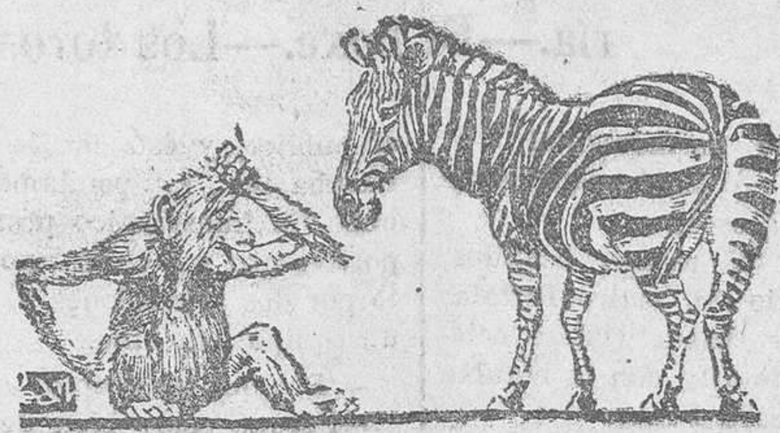
El mono a la cebra.—Ya habrás tenido que estar bastantes años en el servicio, para haber llegado a ganar tantos galones!