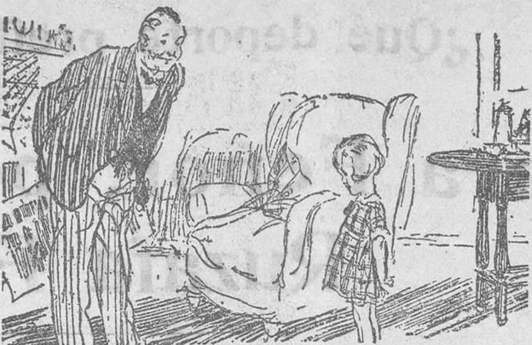
El huésped.—Buenos días, preciosa. ¿Has pasado buena noche? La pequeña.—No sé. He dormido todo el tiempo.