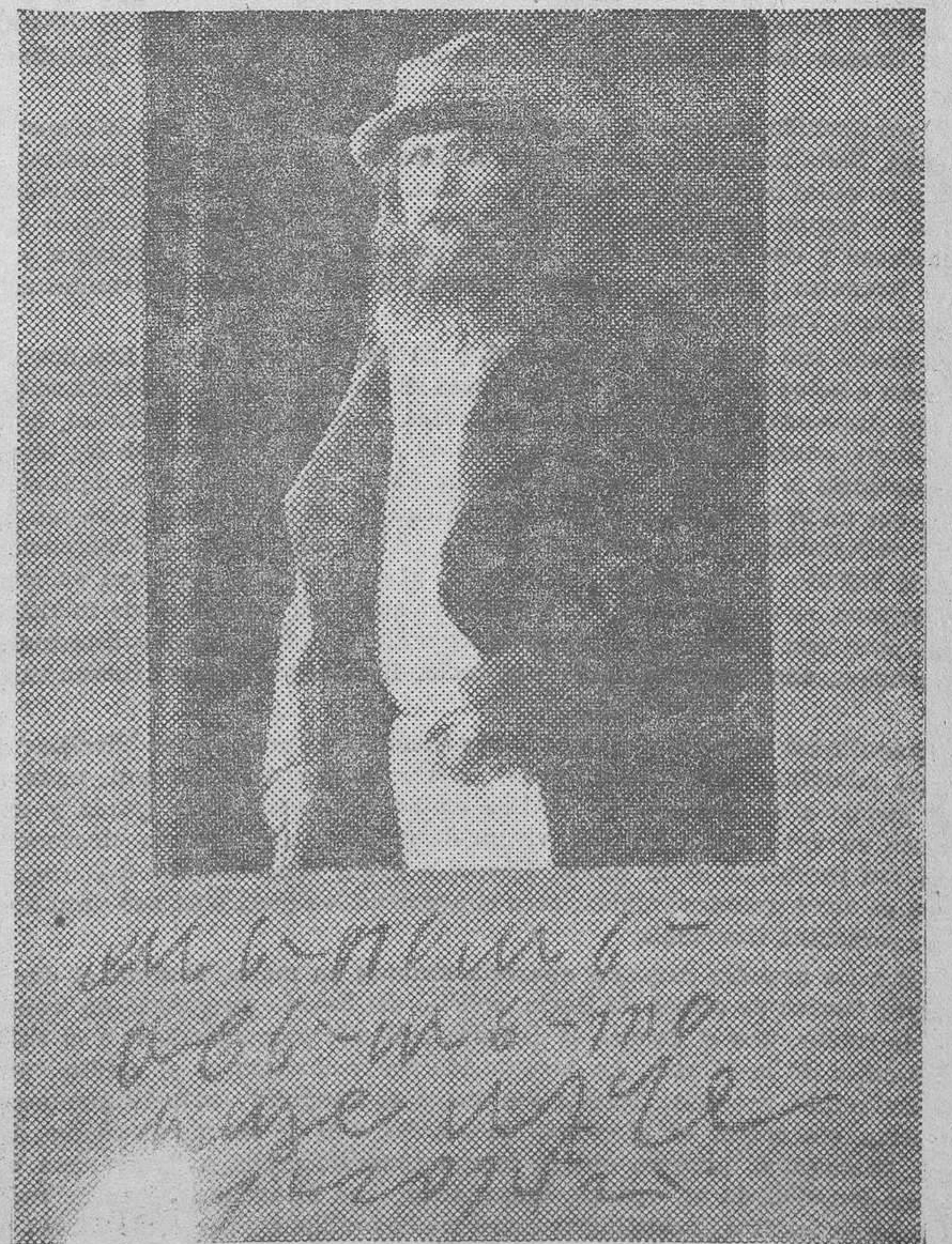
Rasputin, con su traje para las fiestas