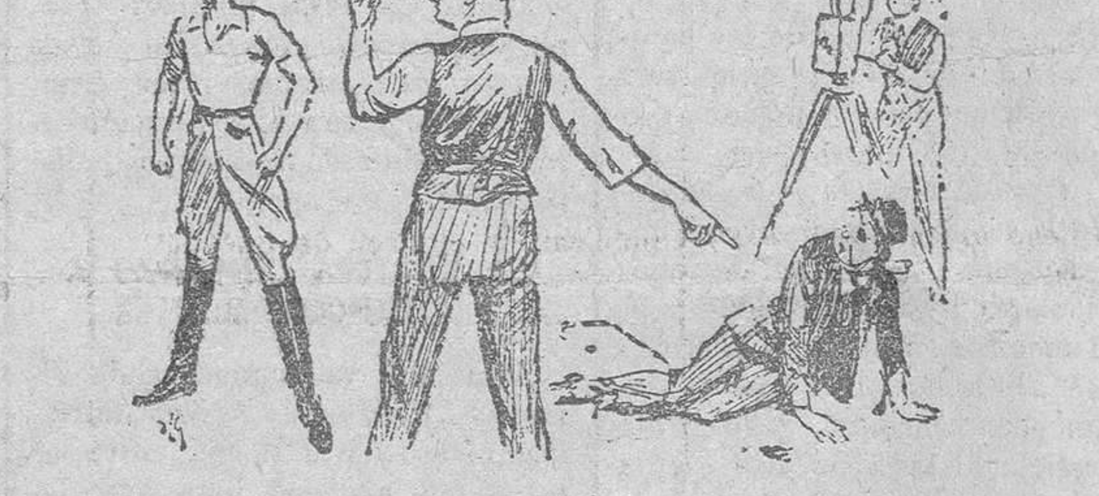
El director de escena, en el estudio.—Esta escena no ha salido bien. Es preciso que le dé una paliza de primer orden a su enemigo. Fíjese bien cómo le pego yo; después volverá orden a empezar.