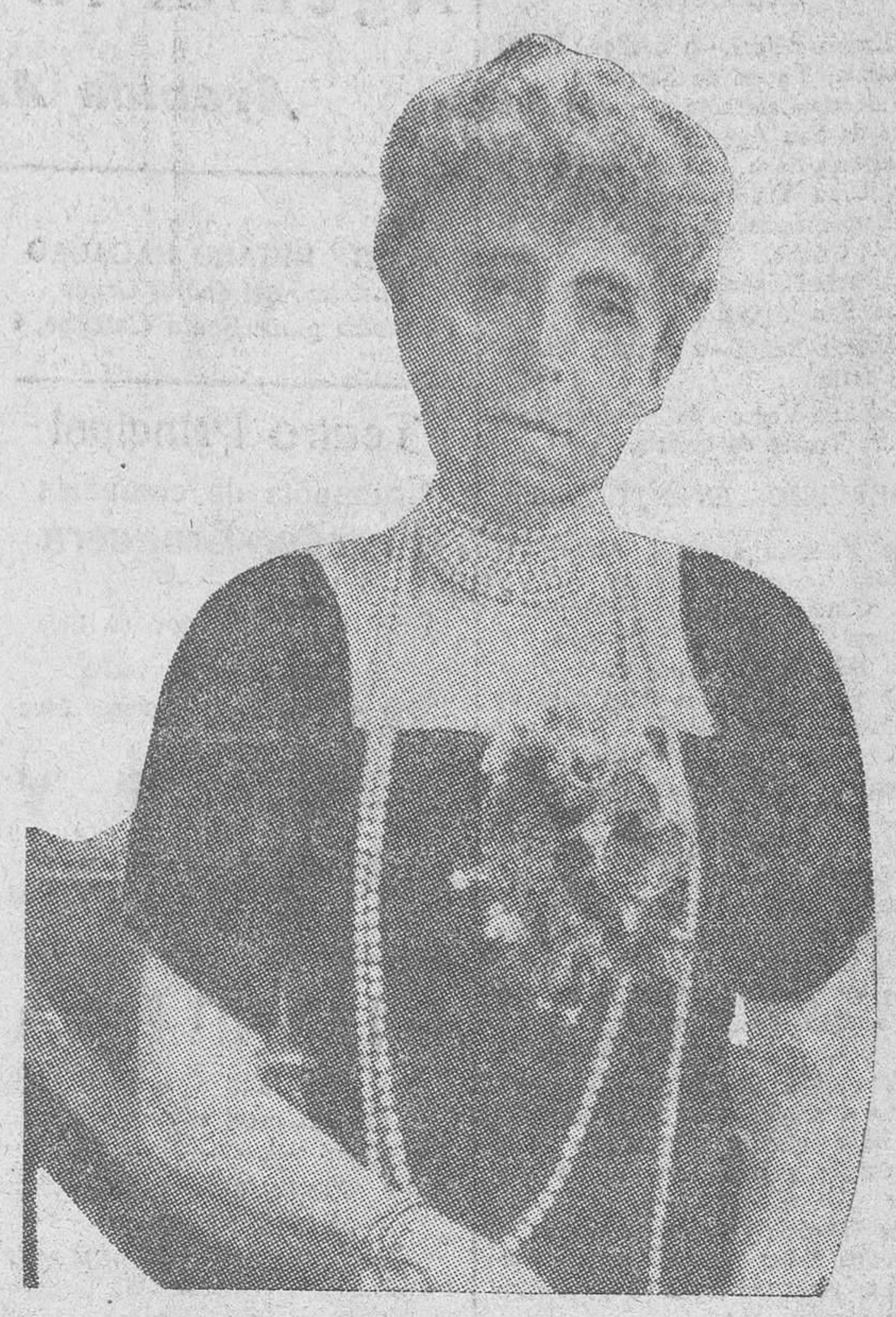
La Reina doña María Cristina