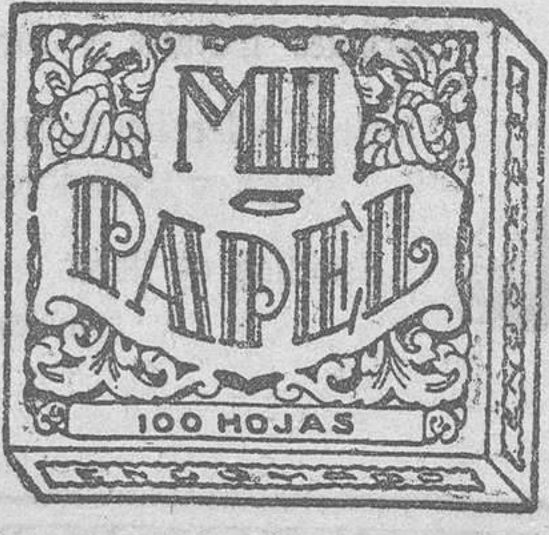
(MARCA DE FABRICA)

en las fototipias que llevan sus estuches. Esta nueva y bonita colección (Serie H), está compuesta de 80 reproducciones fotográficas de jugadores no publicados y seleccionados entre los valores nacionales de este deporte. Para coleccionarlas, hay editados álbums especiales en cada serie.