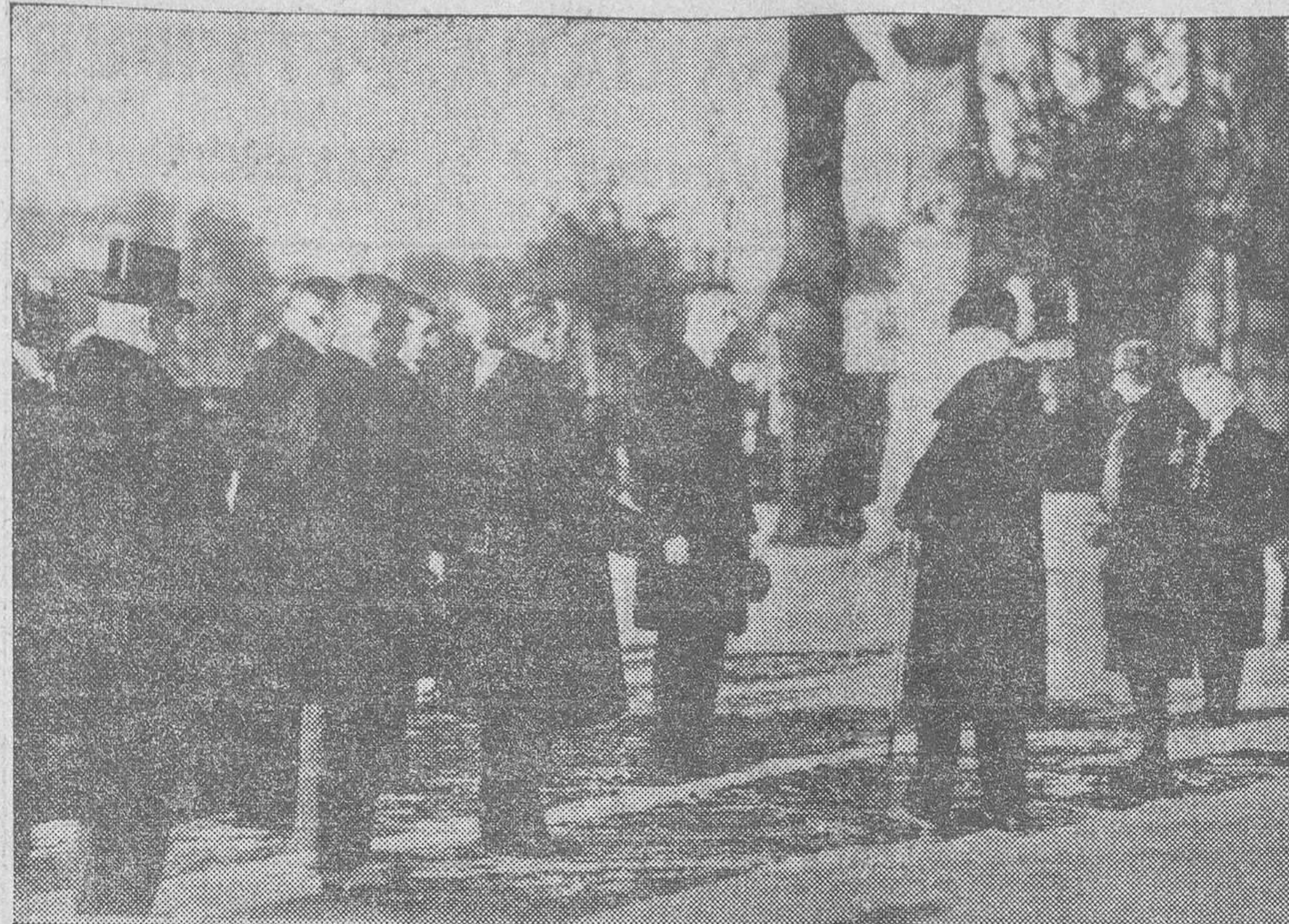
Guillermo II y su mujer reciben el homenaje de los ediles de Doorn. Documento único