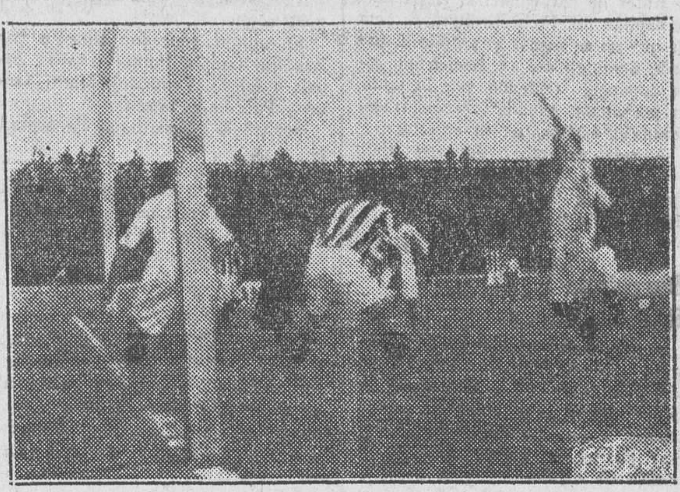
Nuestro fotógrafo, oportunisimamente, obtuvo la situación de los jugadores cuando el árbitro anuló el sexto goal, por offside de Llago