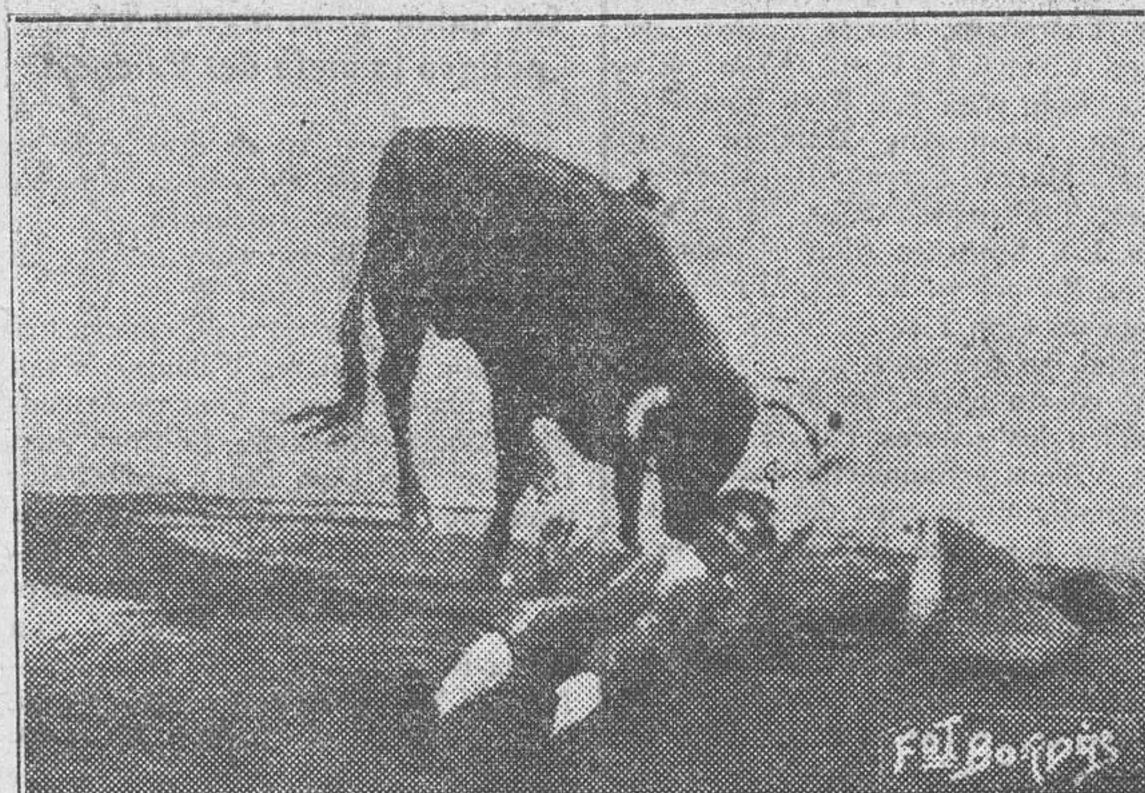
Cogida de Gitanillo

llegó la faena de muleta, después de brindar a Pepe Canet, el entrañable amigo de su tío, el matador del mismo apodo, ejecutó una labor superior, donde hubieron pases de todas marcas, desde el natural, cífidos y mandando como el mejor, hasta el molinete escafoirante, girando en los mismos pitones. El público, que no cesaba de aplaudir, obligó a la banda a que tocara en corto y por derecho, y entrando como los mejores, señaló un soberano pinchazo, seguido de una estocada en la cruz, volándose al entrar y tirándose de toro de tal forma, que fué cogido y volteado aparatadamente. Tardó el novillo en doblar, y cuando lo hizo, el presidente, por acuerdo unánime de la Asamb'ea, le concedió la oreja. Dió la vuelta al ruedo el afortunado debutante, y entre grandes aplausos se retiró a la enfermería. Deseamos al simpático Fortuna chico, un rápido restablecimiento y muchos triunfos como el que alcanzó ayer en nuestra plaza. Gitanillo de Triana confirmó ayer la impresión que de él teníamos. Toda la tarde puso su voluntad al servicio del público, y aunque le tocó car-