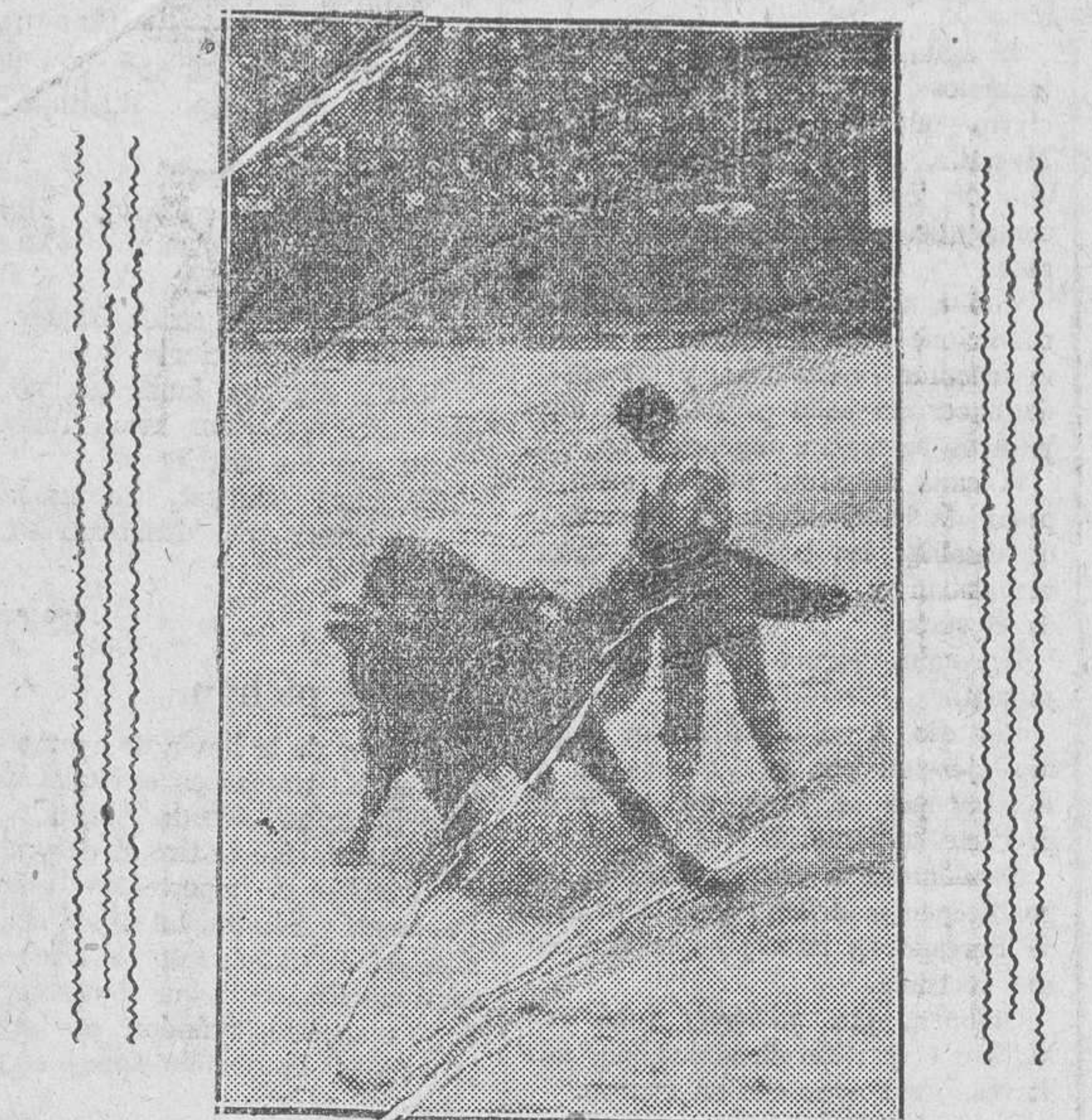
Un lance de Chaves

A las ocho y media de la noche se hallaban en la citada habitación un niño de 7 años y una anciana.