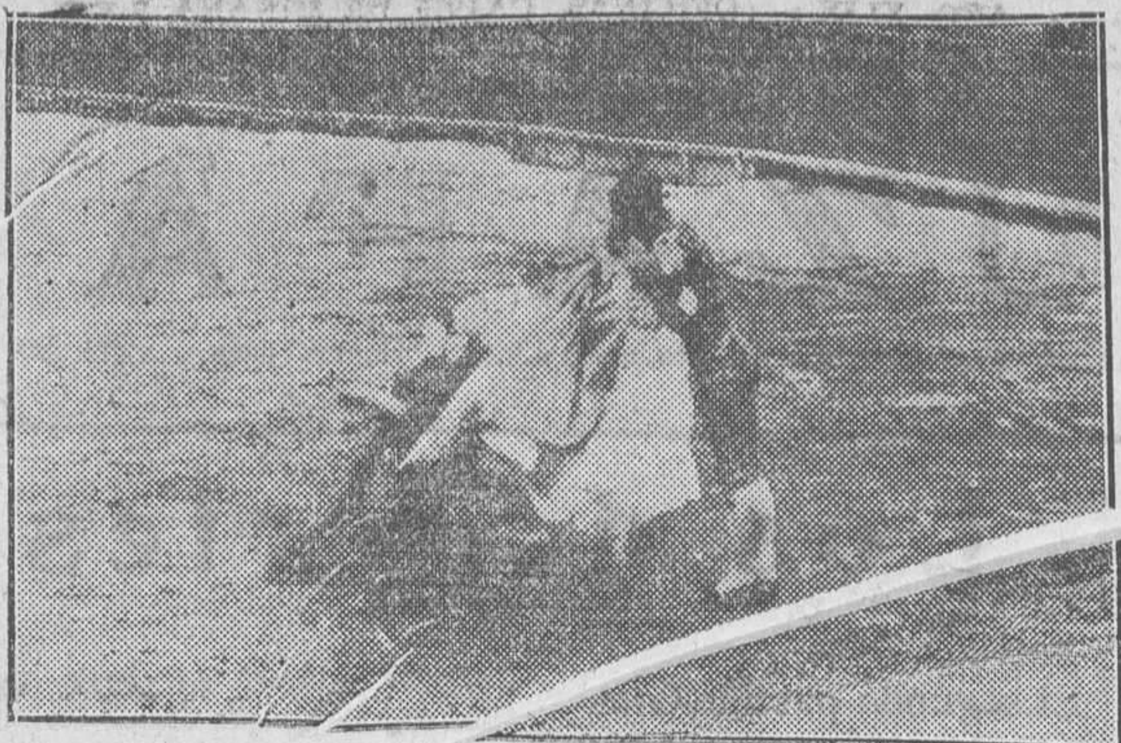
Un lance del Niño de la Palma