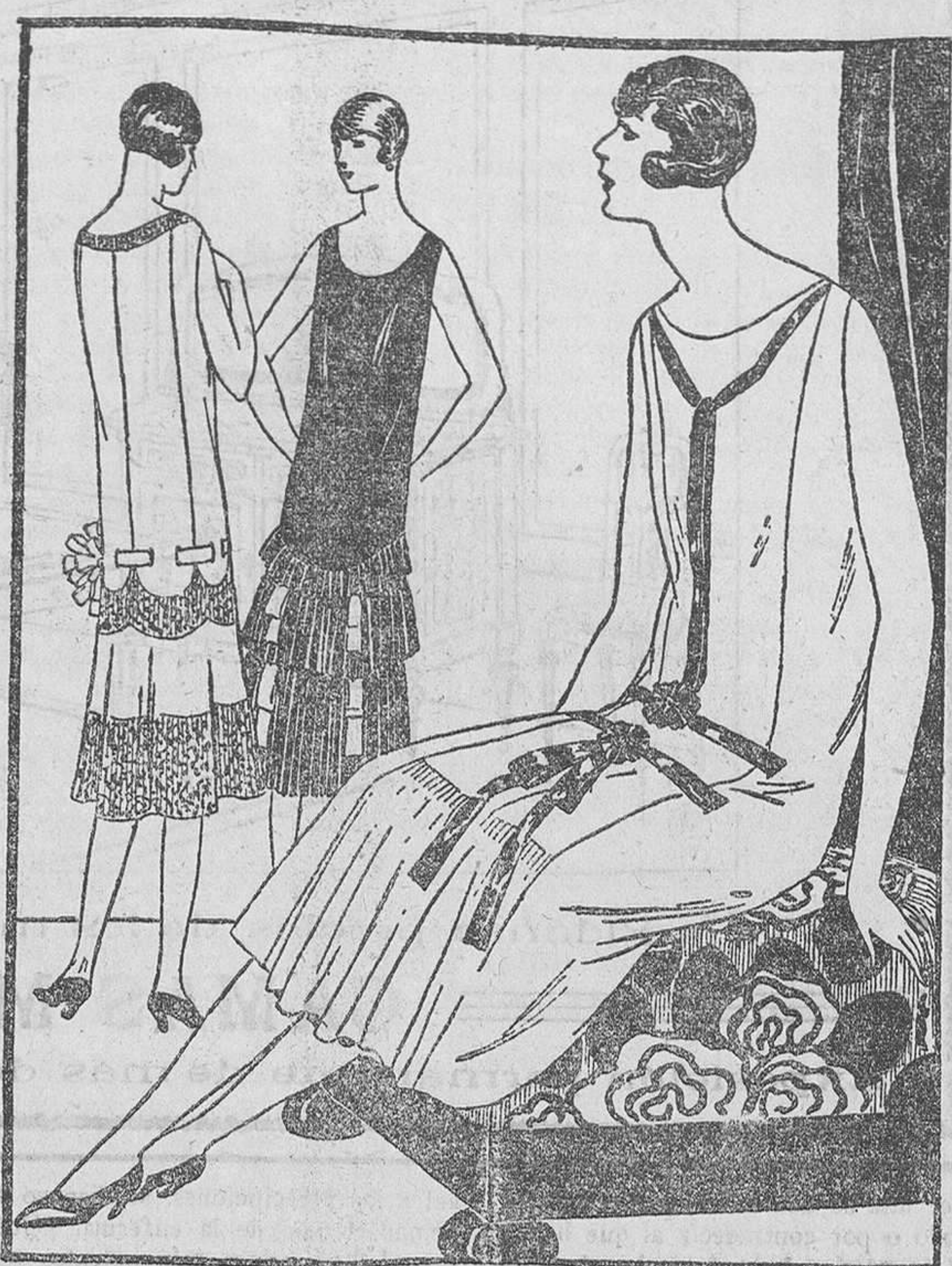
Vestido de crespón de China, albaricoque, mezclado con un espeso encaje de oro.—Vestido de terciopelo para el corpiño y crespón plegado para la falda.—Vestido de crespón tchin tchin azul guarnecida de cintas de terciopelo azul.

La mujer que triunfa en escena, lo consigue destacándose más que por una belleza convencional, por una personalidad muy acentuada, aún cuando ésta, en lo que se refiere a lo externo, sea consecuencia de algún defecto.