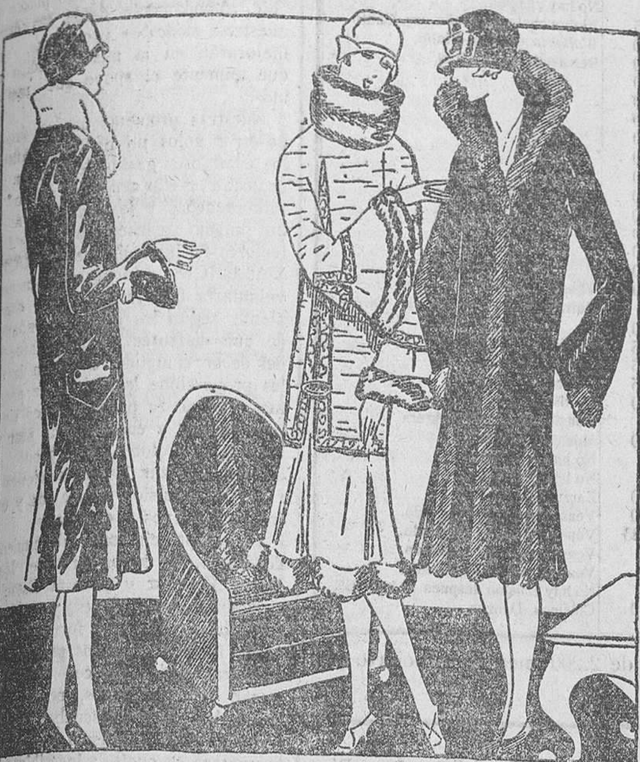
Levita iluminada de hermine.—Abrigo de Brodtail y sarga de seda, guarnecida de adornos.—Vestido de nutria enriquecido con bandas adornadas.

una línea voluntariamente más simple y más joven.